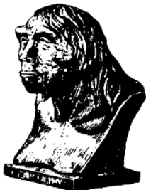
北京人头部复原像

大约在一万年前，我国进入了普遍使用磨制石器的新石器时代，工具的进步，是生产力提高的标志。