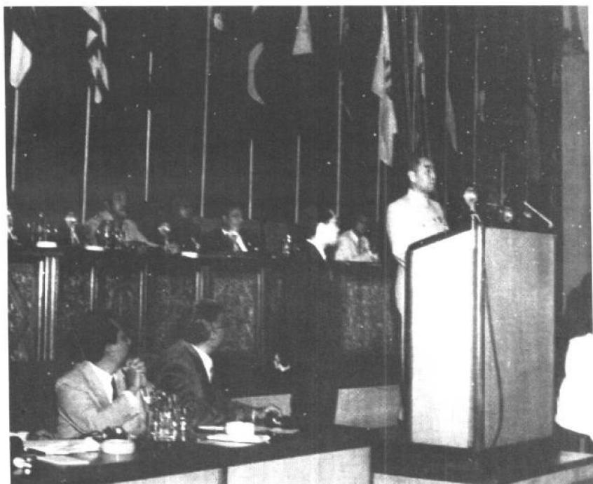
1955年4月，亚非会议在印度尼西亚万隆召开。周恩来在会上作了一个简短明确的发言，阐述一个新生的大国对国际关系的原则。