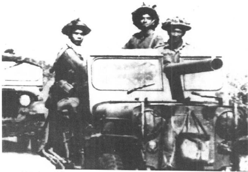
1971年巴基斯坦出现内乱，印度借口东巴基斯坦的民族问题与难民问题向东巴出兵。到12月3日，演变成印巴间的全面战争。经联合国的干预，到12月17日，双方正式停火。东巴基斯坦宣布独立，建立了孟加拉国。图为1971年12月4日，印度军队进入巴基斯坦境内。