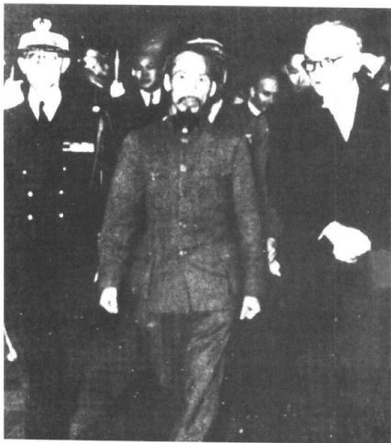
1954年，越南民主共和国主席胡志明(中)到达巴黎。与法国政府谈判越南独立问题。