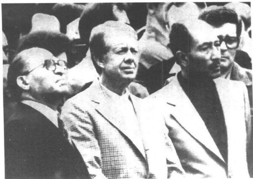
1978年9月17日，埃及总统萨达特和以色列总理贝京在美国首都华盛顿附近的戴维营签署了中东和平的协定。美国总统卡特担任“证人”在协定上签字。图为贝京（左）、卡特（中）、萨达特（右）在签字仪式上。