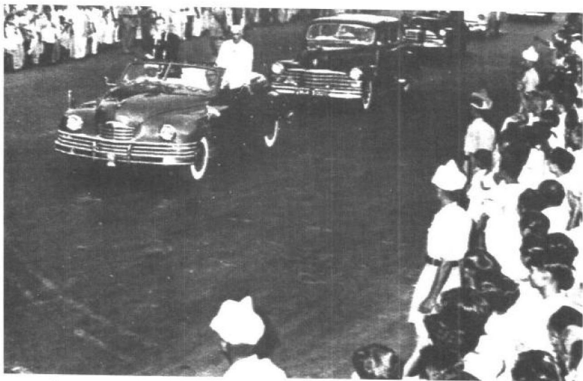
中国同印度和缅甸共同倡导和平共处五项原则，图为1954年6月周恩来访问印度时受到热烈欢迎的情景。