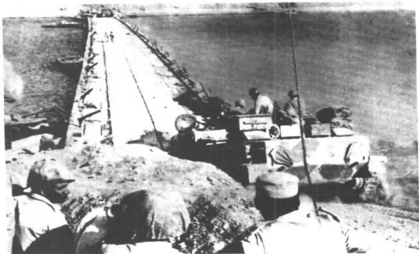
1973年10月6日下午，第四次中东战争（也称“斋月”或“赎罪日”战争）爆发。图为1973年10月7日，埃及军队强渡苏伊士运河。