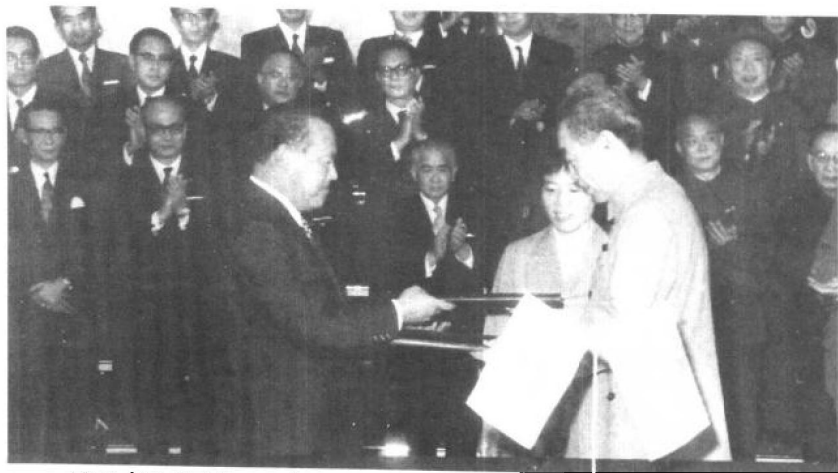
1972年9月29日，中日联合声明在北京签字，从而正式建立了外交关系。图为周恩来总理（前右）和日本田中角荣首相（前左）交换文本。