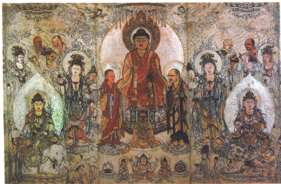
张胜温图卷局部（大理）