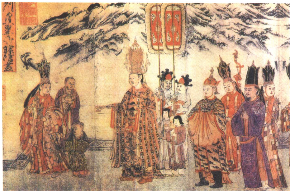
张胜温图卷局部（大理）