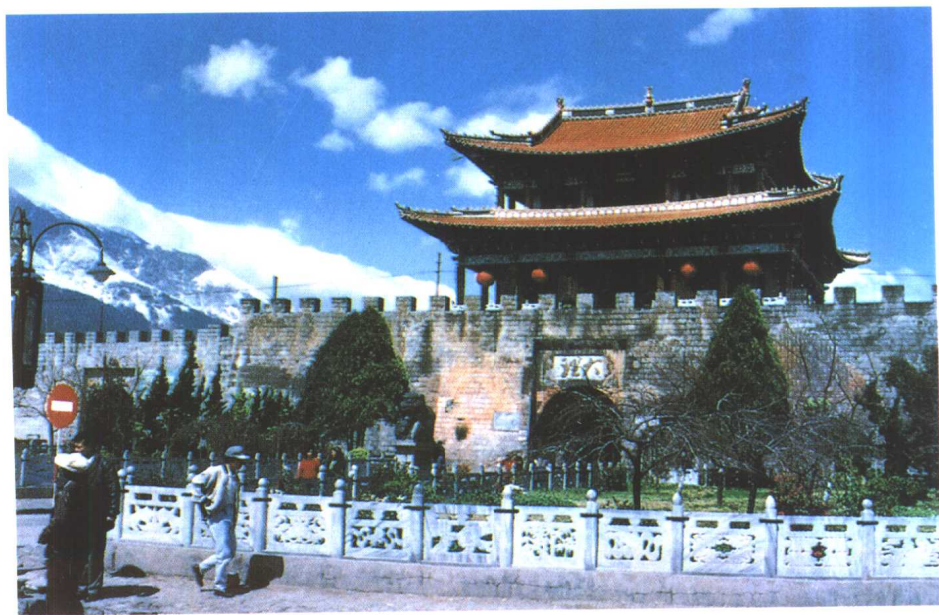
历史文化名城大理