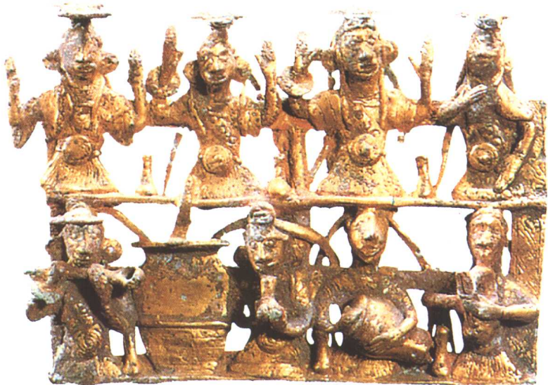
八人乐舞鎏金铜饰（滇文化）