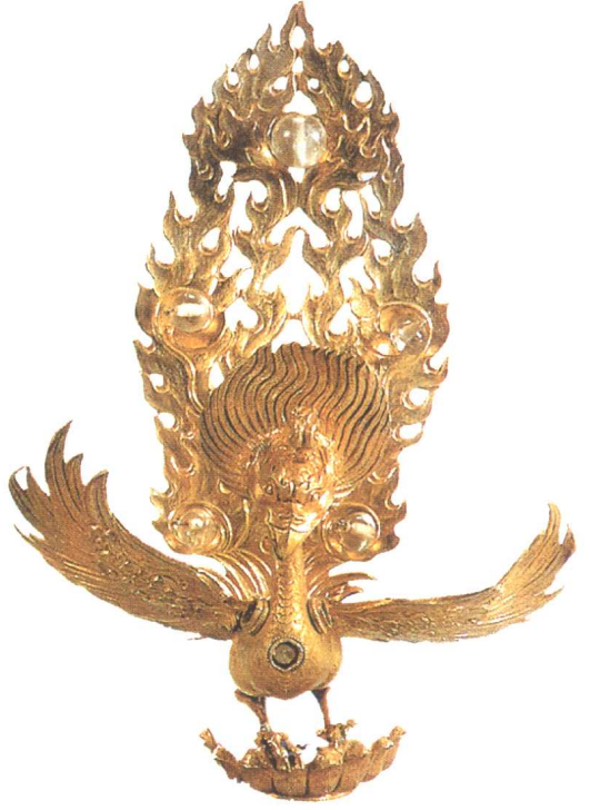
镶珠鎏金银金翅鸟（大理）