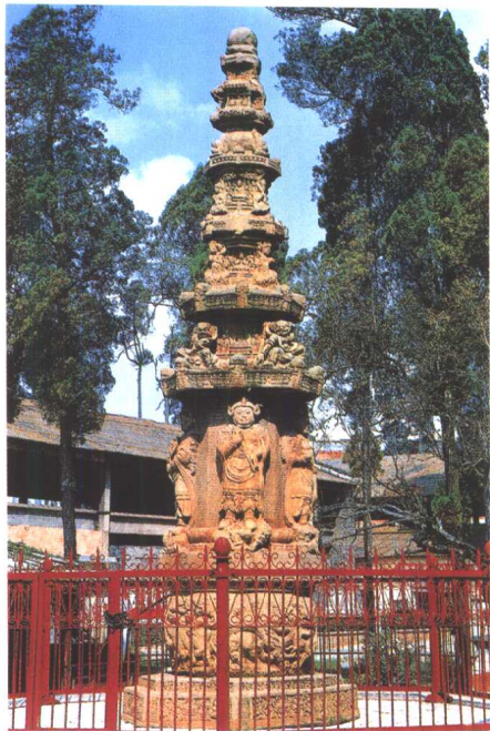
昆明地藏寺经幢（大理）