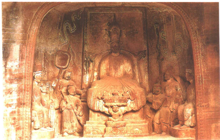
剑川石钟山石窟的南诏第六代国王异牟寻坐朝图