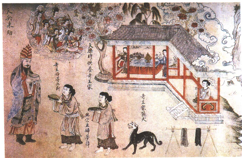
南诏图传局部（南诏）