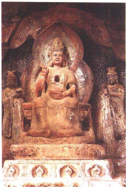
被誉为“东方维纳斯”的剑川石钟山石窟的甘露观音雕像