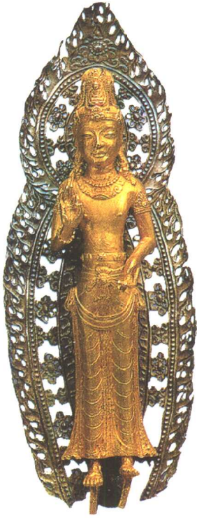
阿嵯耶观音金像（大理）