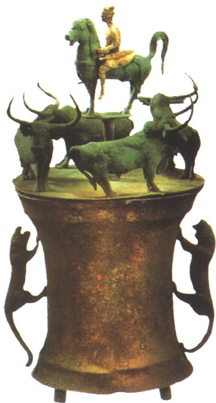
四牛骑士贮贝器（滇文化）