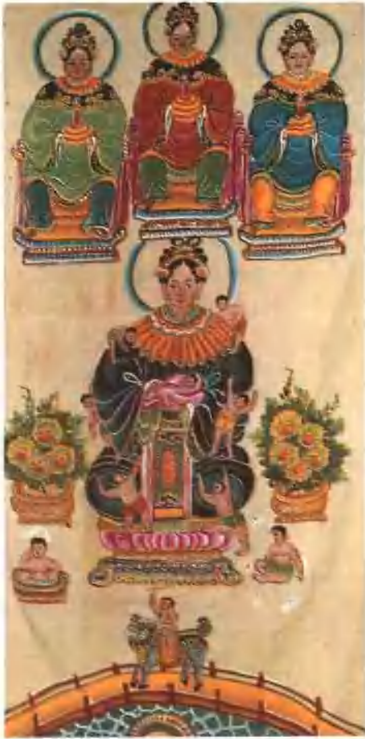
佛壇上掛的神像圖卷