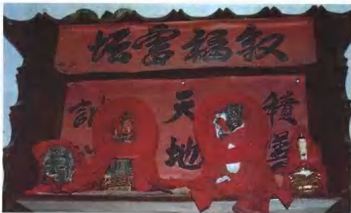
▲巫師恭祀的神壇，稱為「雷壇」或「儺壇」，雷神相傳是一隻神儺鳥

用雞蛋代表儺鳥，用米代表農耕成果，背景是太陽紋圖案的神帳，仍與湖南長沙南托、浙江餘姚河姆渡文化以太陽、儺鳥、禾苗三大特徵的原始陶畫完全一致，7000年來毫不走樣，可見儺文化的頑強生命力