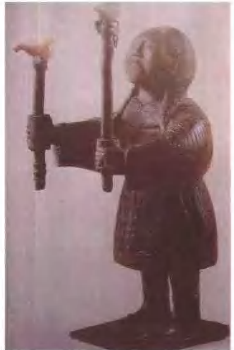
▲古滇國女巫，兩手執立有玉鳥的神杖