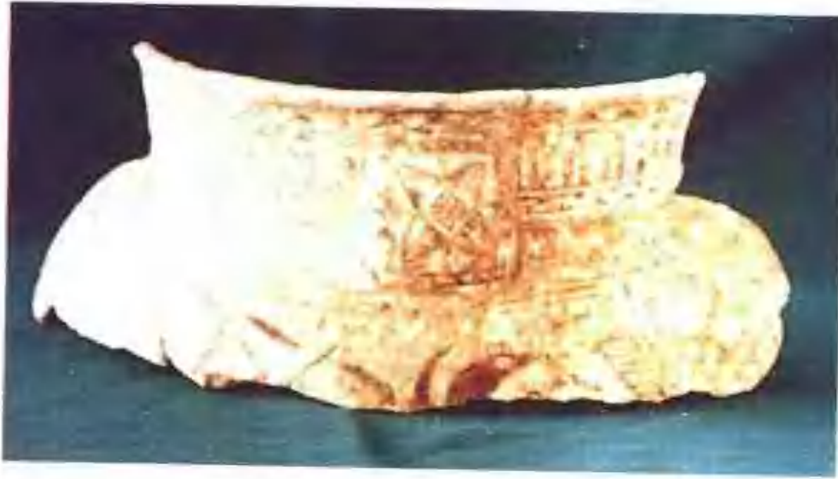
◀ 7000年前的「傩祭圖」 (湖南長沙南托出土)