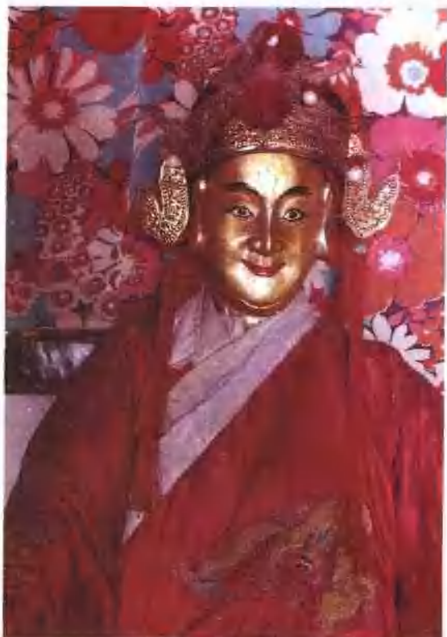
江西南豐儺敬供的儺神太子神像▶