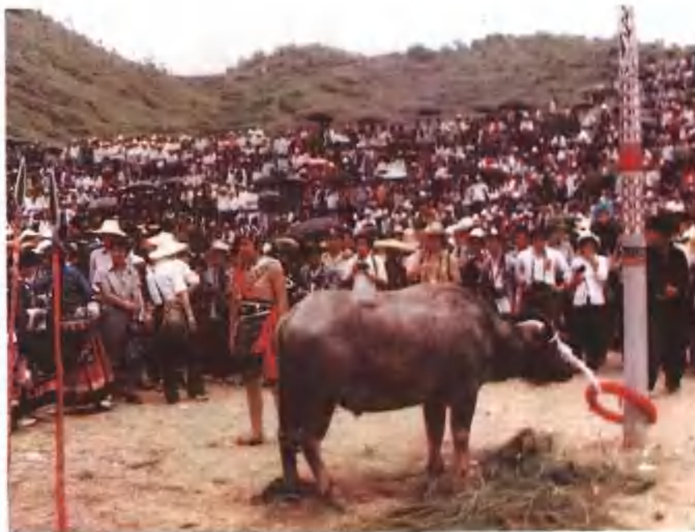
◀ 上, 等待獻祭的牛 苗族「椎牛祭祖」時被拴在花柱(圖騰柱)