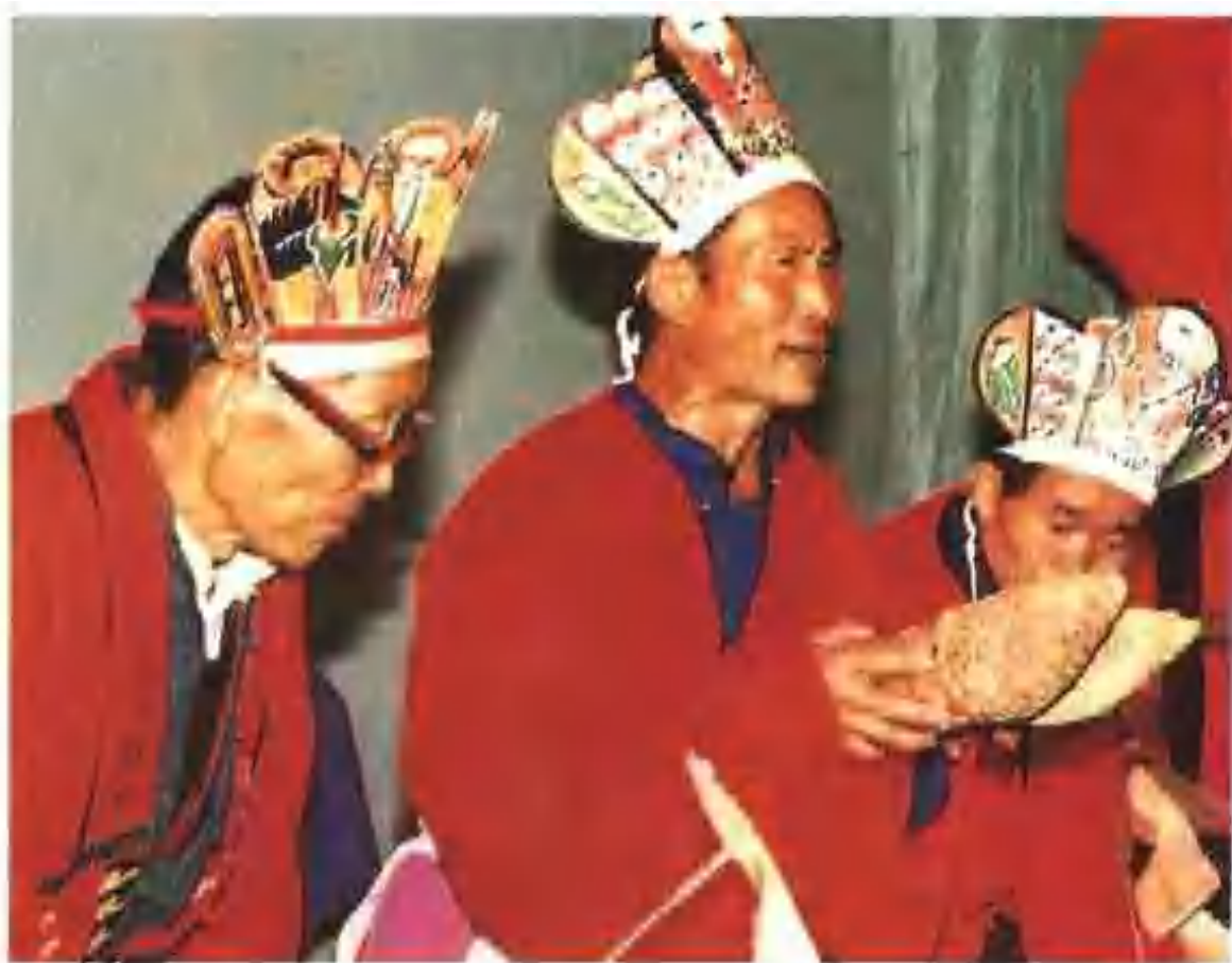
◀ 苗族巫師在用竹卜祈神求卦