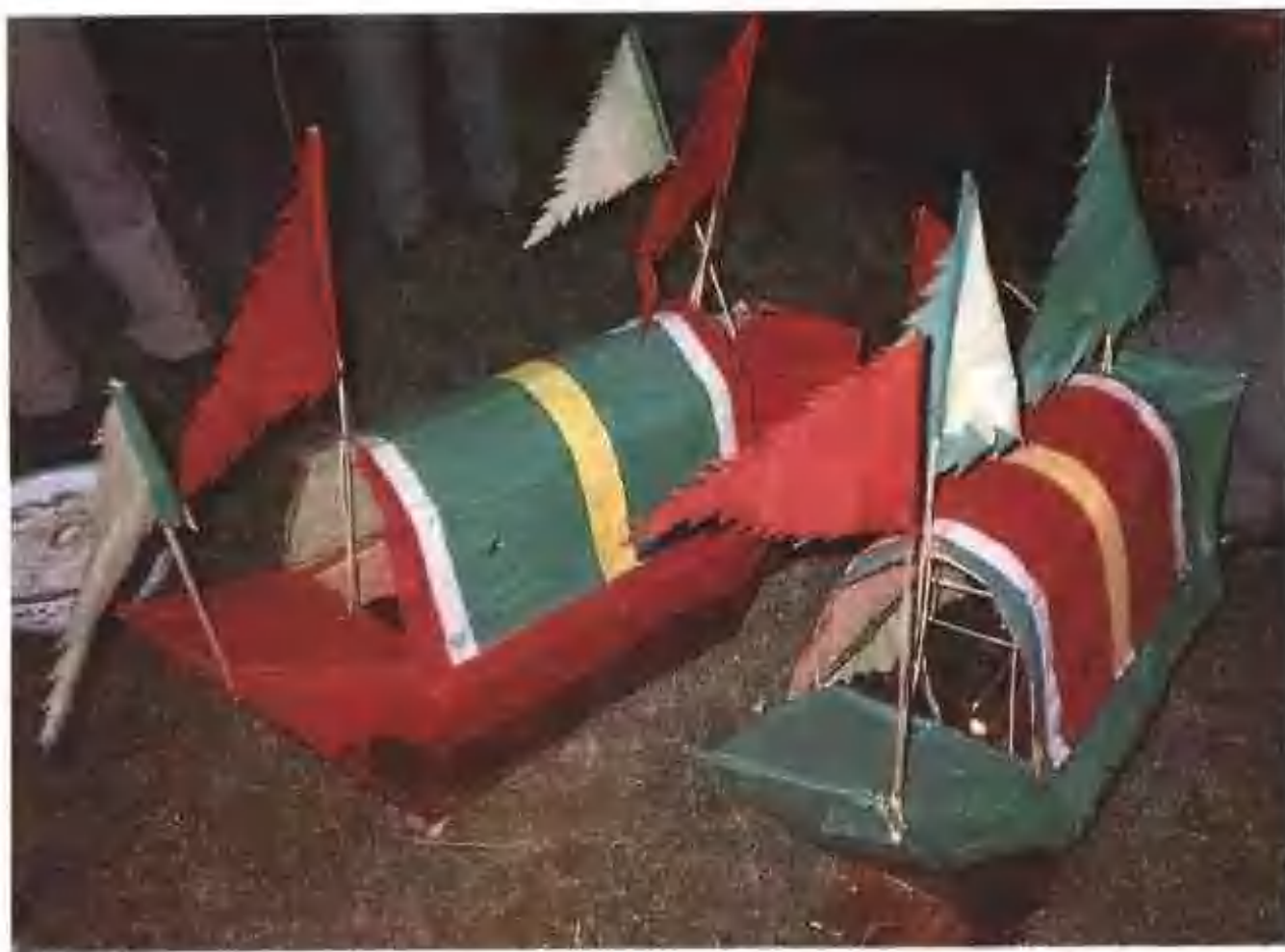
▲ 儂願結束後，用紙船（船公、船母）將災疫送到東洋大海