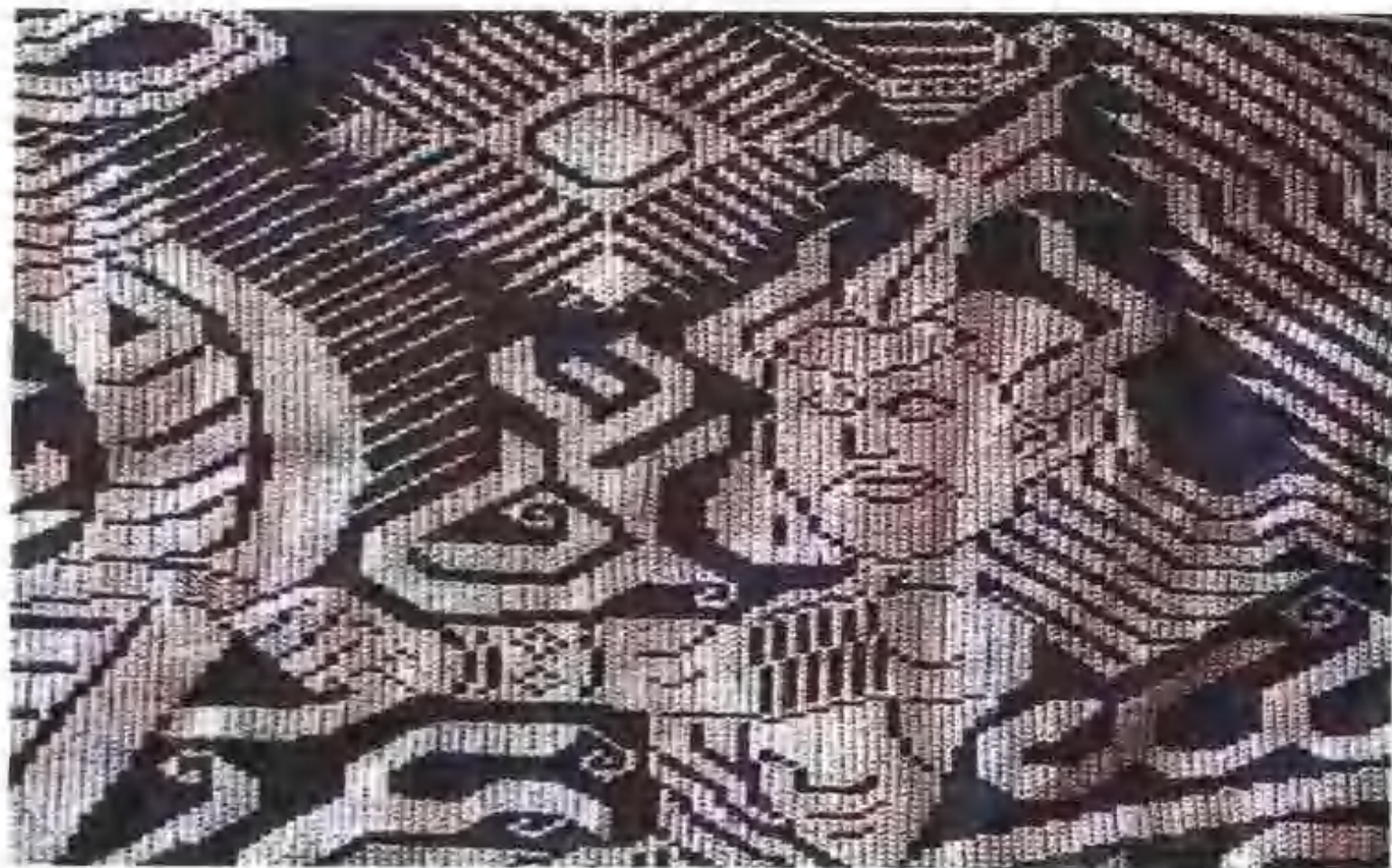
▼湖南小沙江花瑶織錦紋飾(局部)