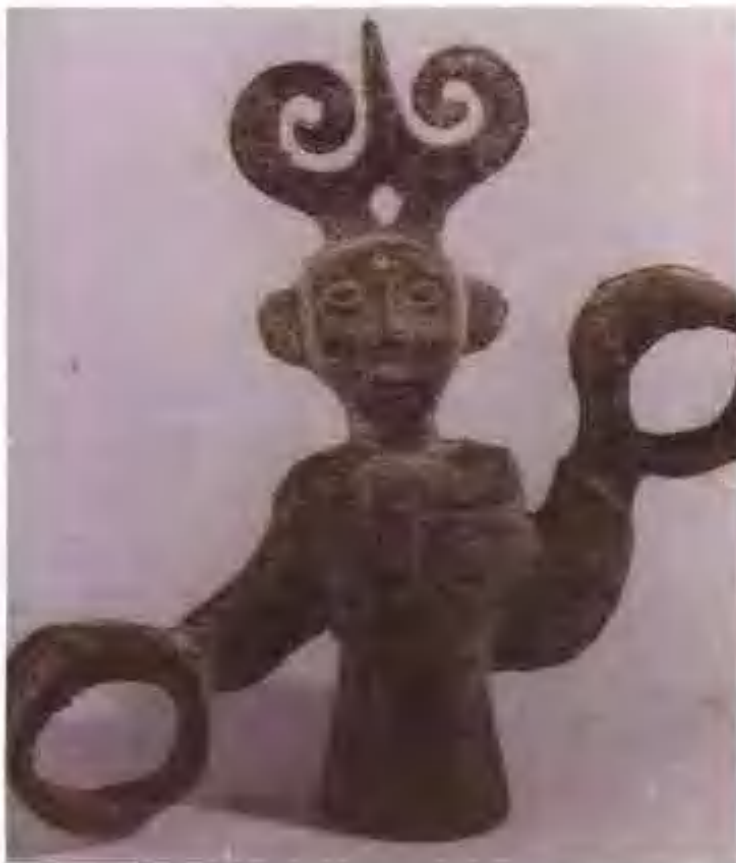
◀戴三尖冠的巫師（西周）