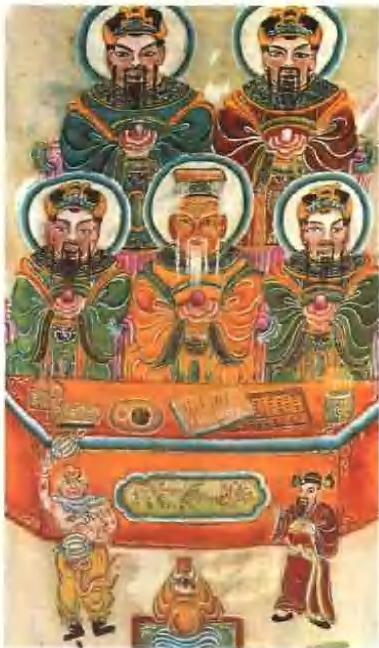
◀▶ 儼壇上掛的神像圖卷