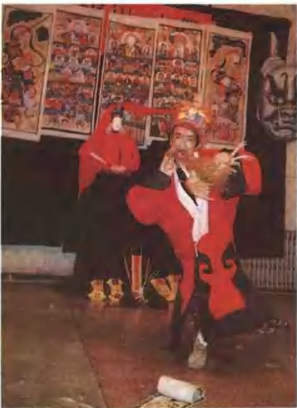
▶ 苗族巫師在祭神時，將雞的頸子用牙咬斷