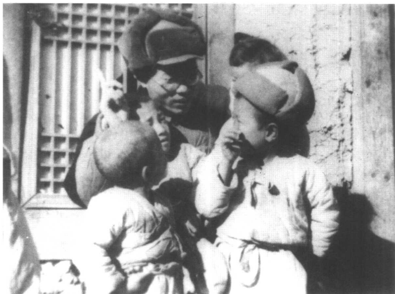
与朝鲜儿童在一起。