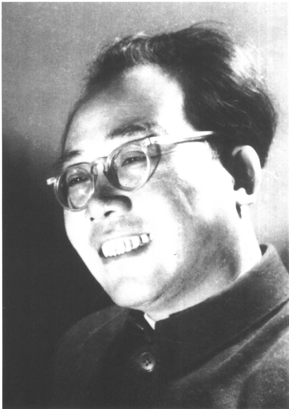
写作《东方》时的作者。