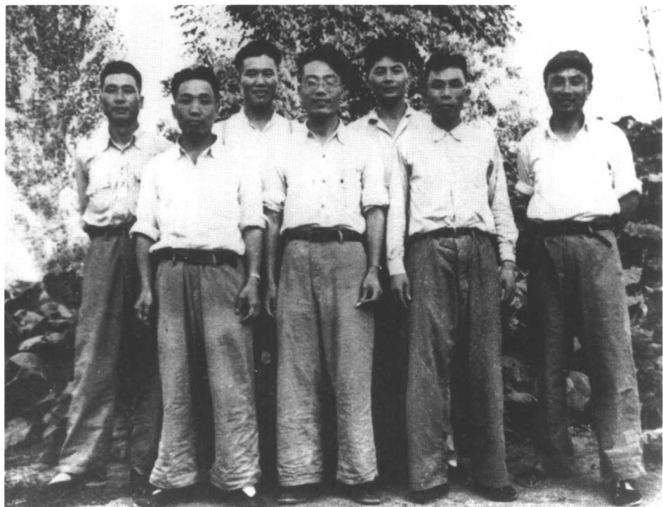
1952年在朝鲜与一八八师 老战友合影，左四为作者。