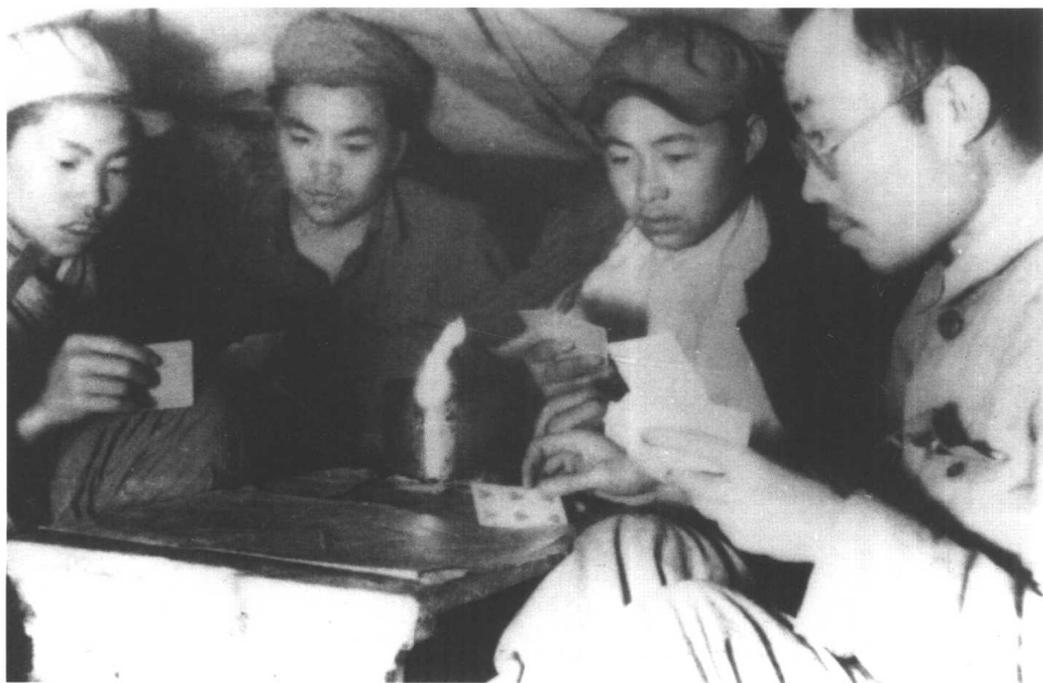
在前沿阵地坑道内与战士打扑克。