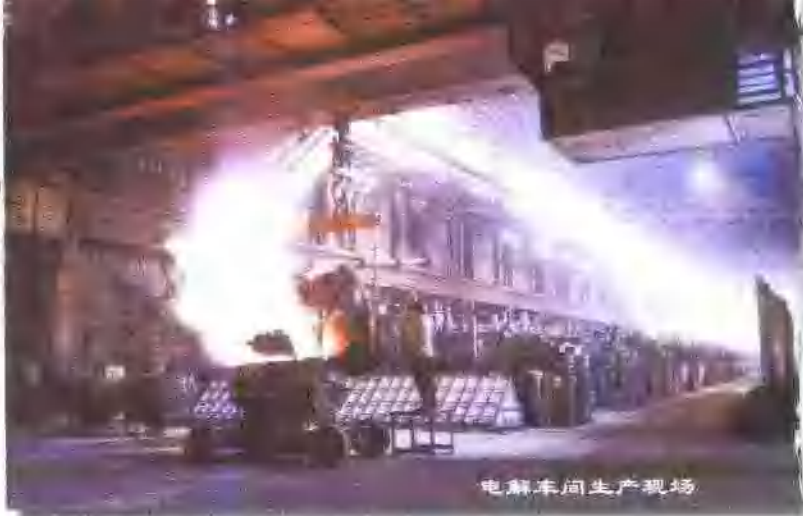
电解车间生产现场

包头铝业(集团)有限责任公司是国家大型一档企业。全国520户重点工业企业和十大铝冶炼企业之一。年产铝锭11.5万吨、碳素制品6.3万吨、铝型材3000吨。主要产品有“包铝”牌重熔用铝锭、稀土铝应用合金、6063铝合金、A356合金、电工圆铝杆、铸造铝合金以及各种铝电解用碳素制品和铝合金建筑型材等。1999年5月通过了ISO9002质量体系认证。