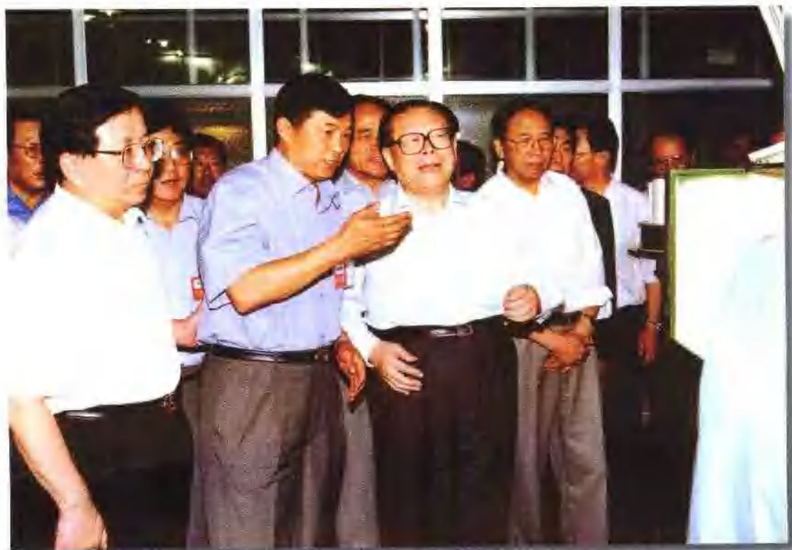
2000年6月16日，江泽民总书记视察宁夏有色金属冶炼厂、西北稀有金属材料研究院。