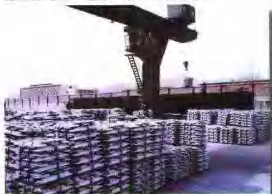
整装待发的“包铝”牌重熔用铝锭