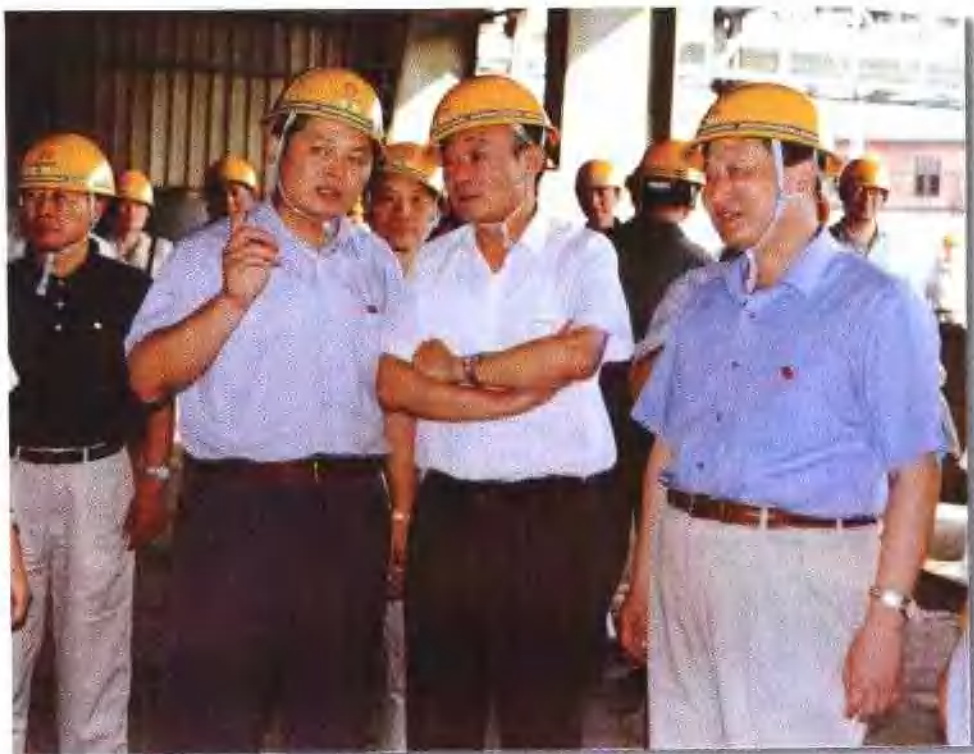
1999年9月8日，吴邦国副总理视察铜陵有色金属集团公司金隆铜业公司。