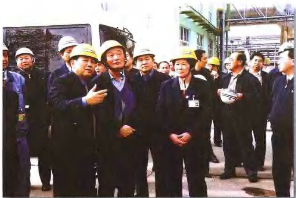
2000年4月12日，吴邦国副总理在国家经贸委主任盛华仁、国家有色金属工业局局长张吾乐陪同下，视察江西铜业公司。