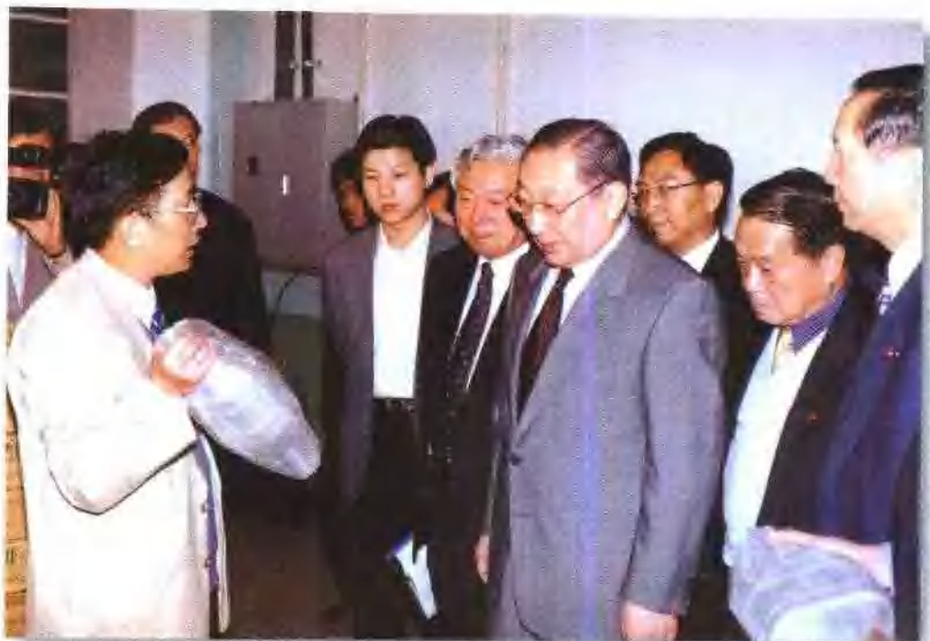
1999年4月29日，中共中央政治局常委、国务院副总理李岚清视察昆明贵金属研究所。