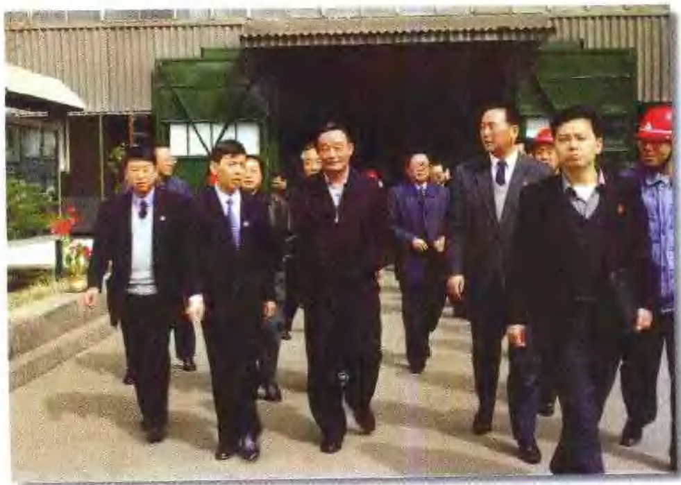
1999年3月24日，吴邦国副总理在甘肃省委书记孙英陪同下，视察金川有色金属公司镍闪速炉车间。