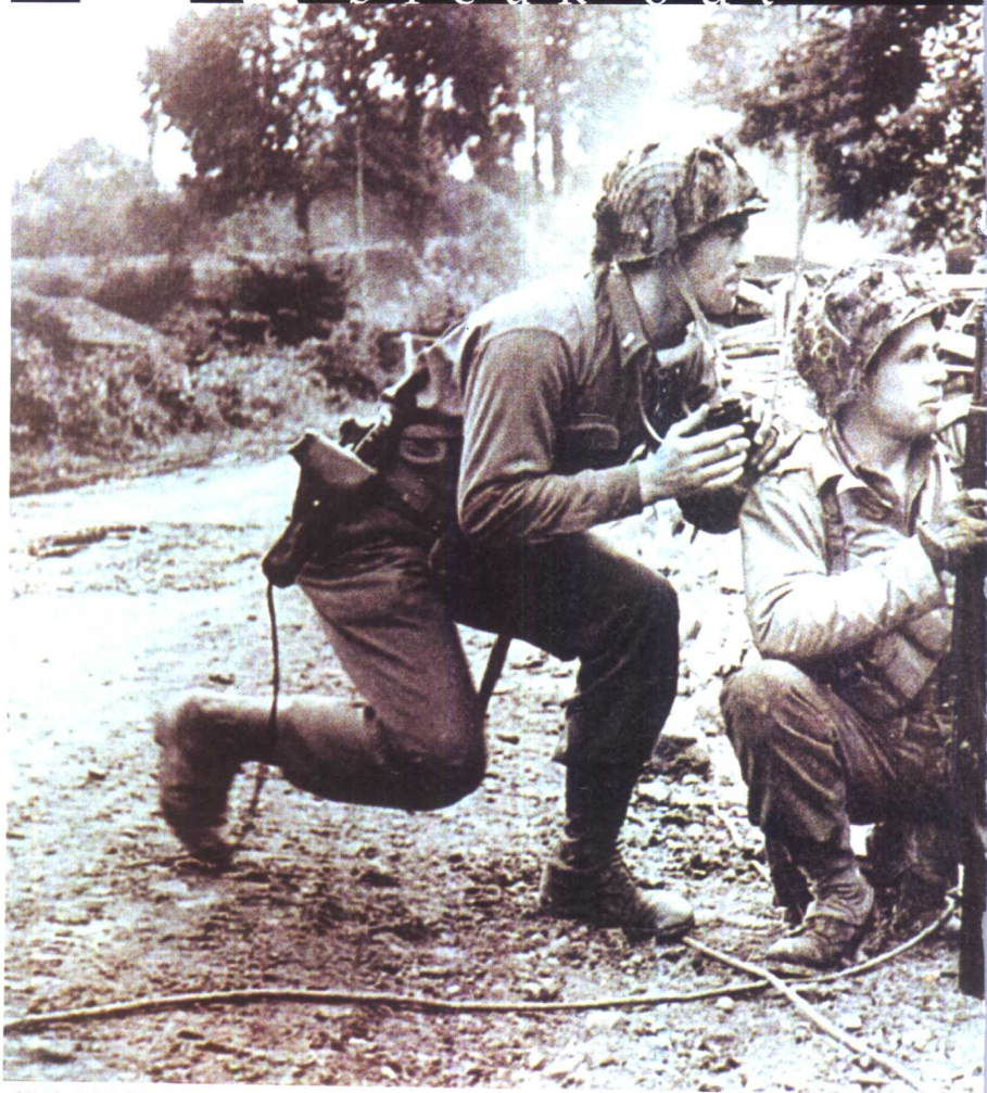
06 战斗中的英国特种部队队员