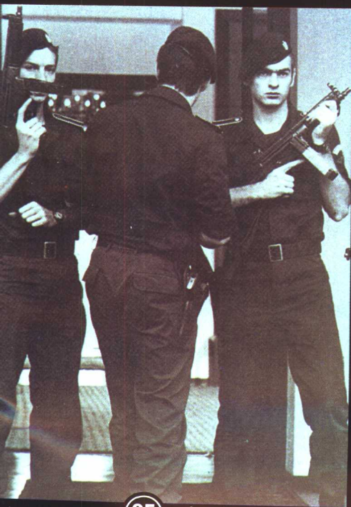
05 德国反恐怖大队队员