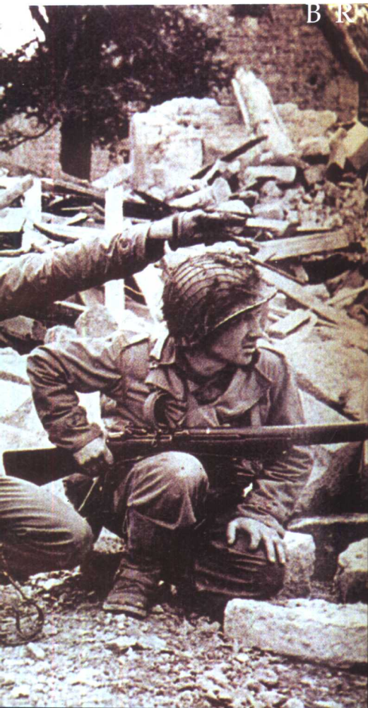
07 潜伏待命的特种队员