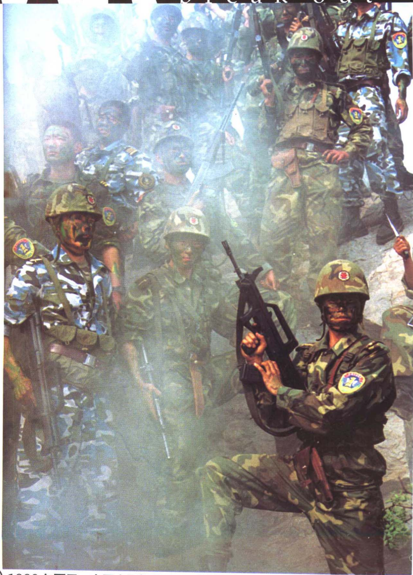
13 1999年夏天，中国人民解放军各特种部队集结演练