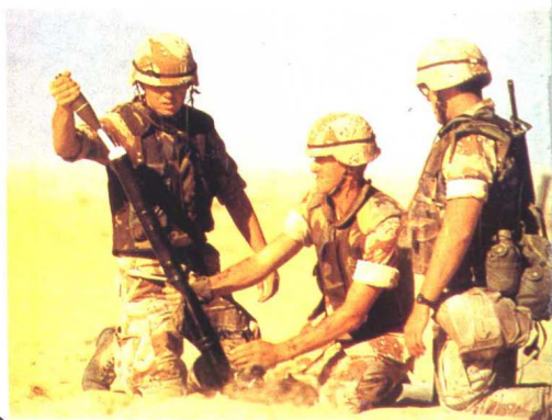
03 美国特种空降师队员