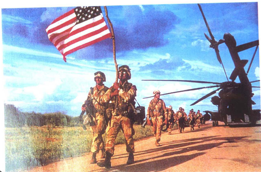
01 行进中的美国海军陆战队队员