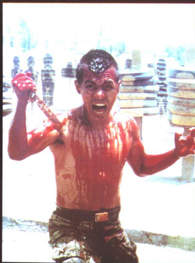
04 特种部队队员进行反恐怖心理训练