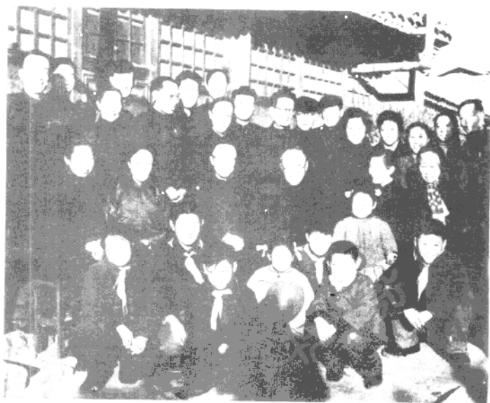
● 老少三代 一九六一年春节在载涛家