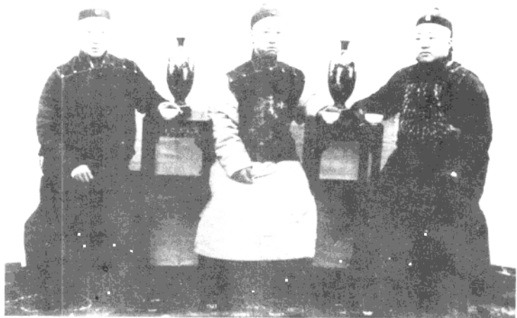
● 载沣（中）载洵（右）载涛（左）