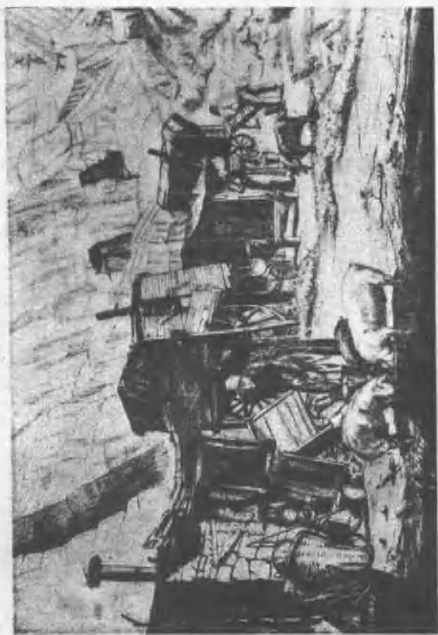
圖 1. 銅版藏