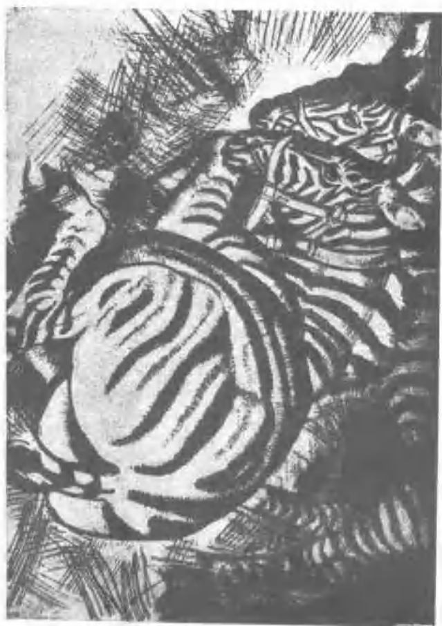
圖 2. 銅版鐫刻