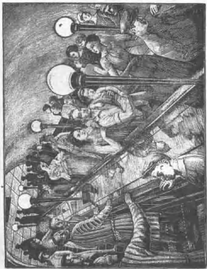
圖 3. 木 刻