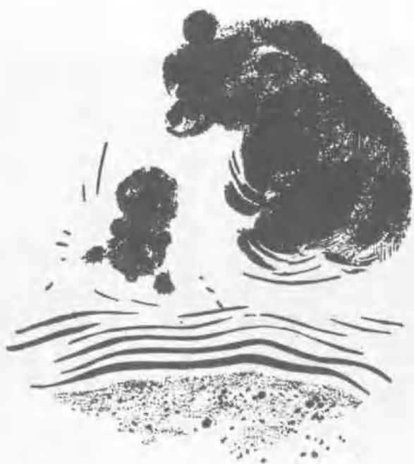
圖 4 石 刻