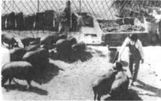
养猪积肥，作鱼塘精饲。