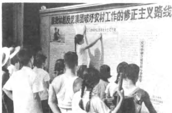
深入批林批孔，坚持社会主义方向，促进多种经营全面发展。