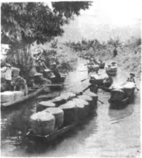
茧 结 实