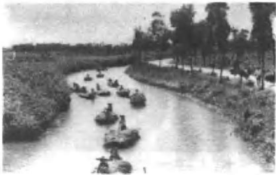
到外地割青草喂鱼。