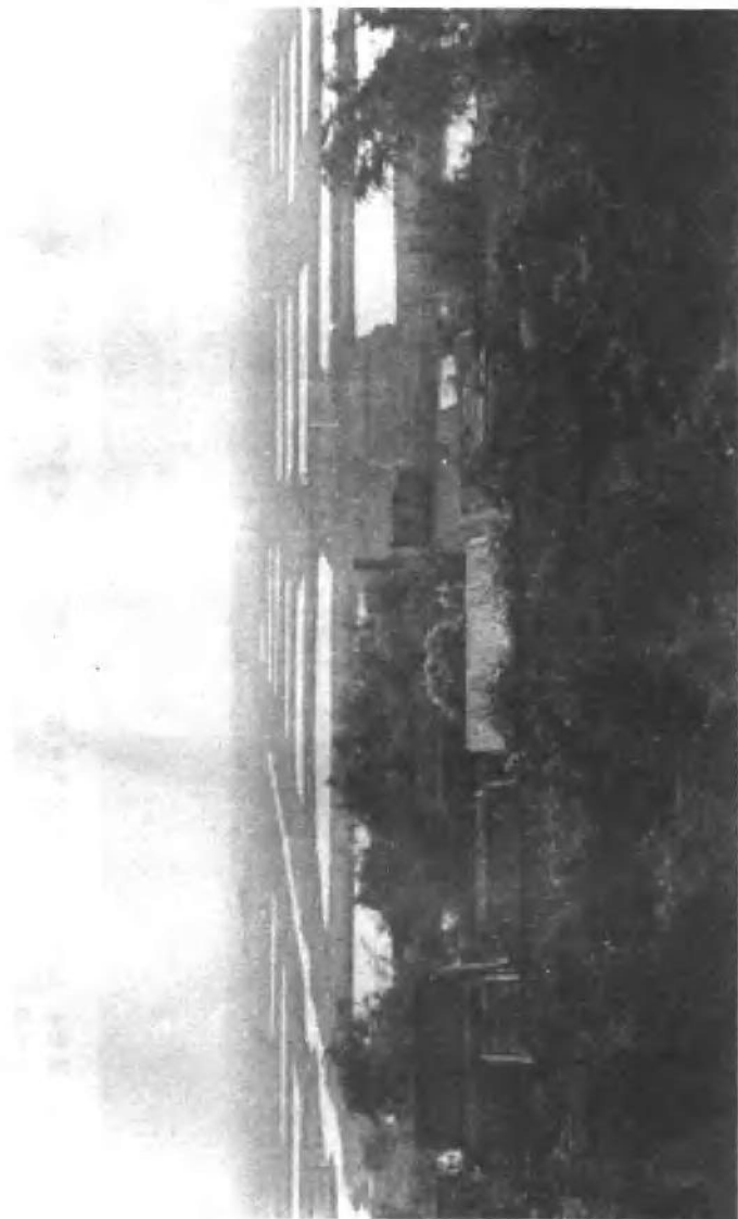
顺德县干部群众，发扬大干、苦干精神，想大的，干大的，连片整治低产基塘。