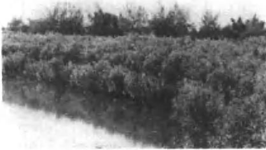
在塘边、河边种植太阳麻、象草等饲料作物。