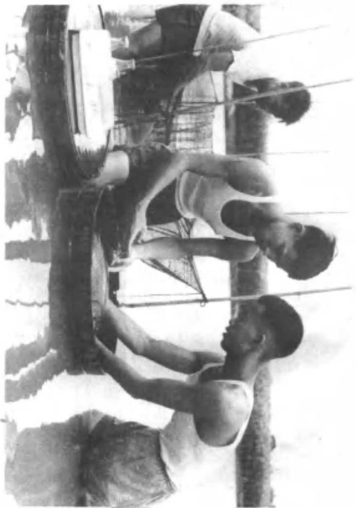
科学养鱼，向生产的深度和广度进军。