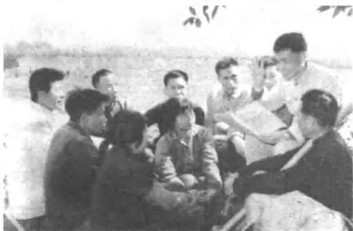
顺德县的领导干部把看书学习和调查研究结合起来，深入社、队与干部、社员研究贯彻执行党的方针、政策。