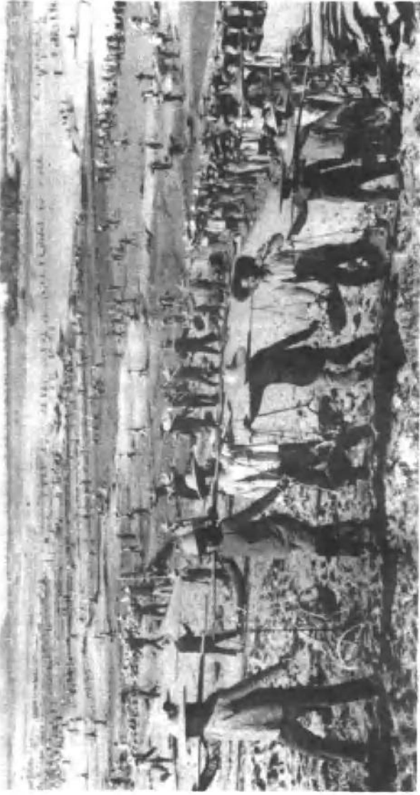
大干社会主义，不断改变生产条件。