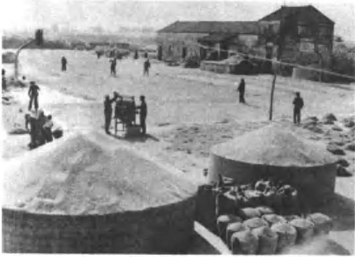
粮 丰 收