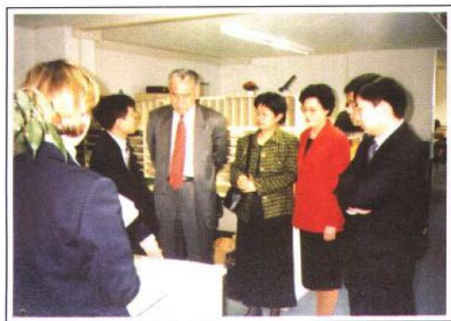
中国法院代表团团长祝铭山（左三）考察德国慕尼黑市法院。