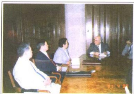
1991年4月27日至5月2日，中国最高人民法院法官法考察团赴墨西哥合众国考察了该国的法官制度。图为4月30日联邦最高法院院长乌利塞斯·斯切米尔博士向考察团成员介绍墨西哥的法院体系和司法制度。左起第四人为乌利塞斯院长，第三人为考察团团长、中华人民共和国法官法起草委员会副主任项华女士。