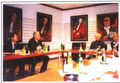
1999年11月23日，以最高人民法院副院长祝铭山为团长的中国法院代表团访问了德国。图为祝铭山（左二）与德国联邦宪法法院院长尤塔·林巴赫（右二）会谈。