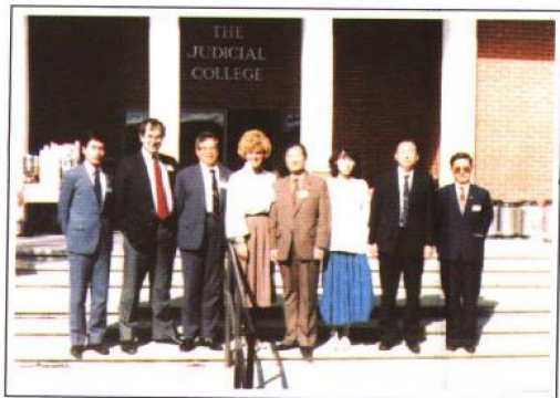
1988年11月1日，考察团与设在内华达大学校园内的美国全国法官学院的院长、教师座谈后，在校门前合影。

1989年4月13日，印度联邦最高法院全体大法官会见了正在该国考察的中国高级法官培训中心考察团全体成员。左起第三人为首席大法官阿·斯·帕塔克先生，第四人为考察团团长、中国高级法官培训中心委员会委员、中国最高人民法院审判委员会委员周道鸾教授，第五人为考察团副团长、培训中心委员、国家教育委员会高教一司司长夏自强教授。