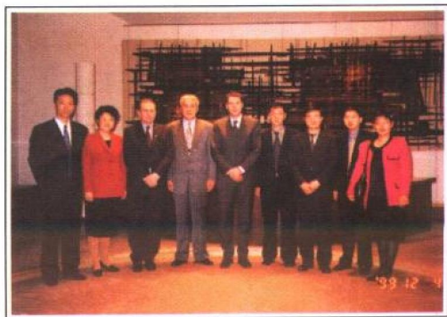
1999年12月4日，以最高人民法院副院长祝铭山（左四）为团长的中国法院代表团访问了法国。图为中国法院代表团与法国最高法院院长居依·卡尼卫（左三）在该院审判法庭合影。