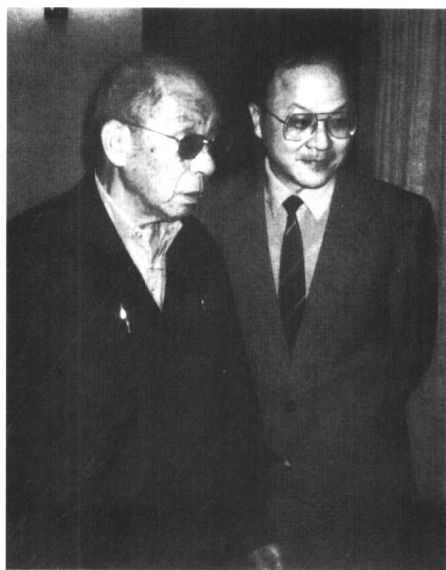
张学良与郭冠英在台北寓所(1989年3月)