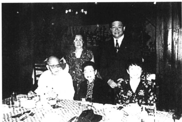
1993年于台北，张学良夫妇与张之丙、张之宇姊妹及哥伦比亚大学校友齐莱云合照