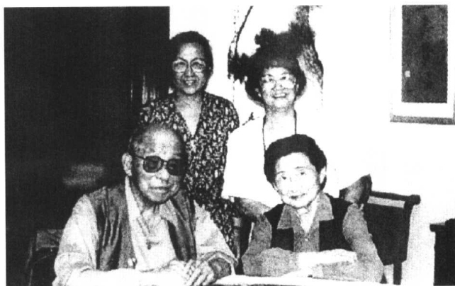
1992年于朴园，张之丙、张之宇采访张学良夫妇