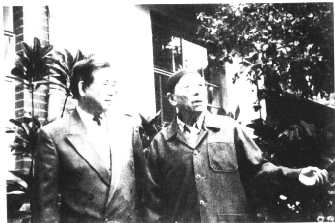
张学良在台北北投家中与史学家唐德刚