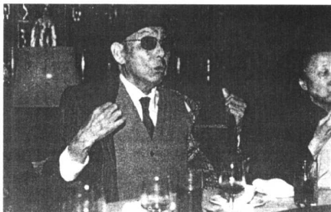
1990年张学良在台北接受日本NHK采访时激昂讲话