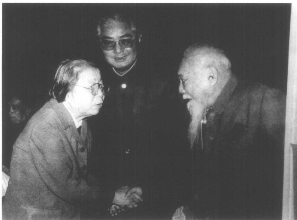
邓颖超和胡厥文亲切握手，中为荣毅仁。