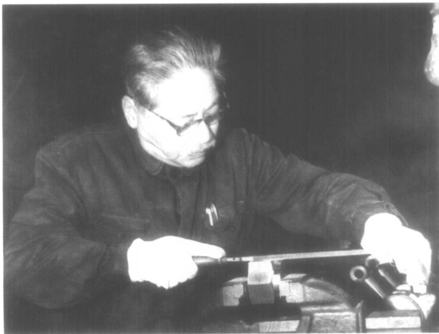
1962年，上海市副市长胡厥文在新民机器厂参加劳动。