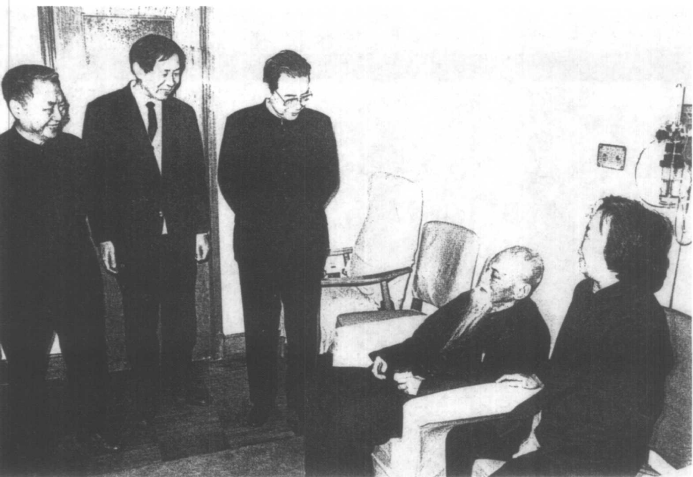
1988年2月，李鹏等中央领导看望胡厥文（右二）。