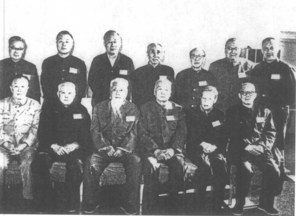
1983年11月18日民进四届一中全会选举胡厥文（左三）为民建中央主席。