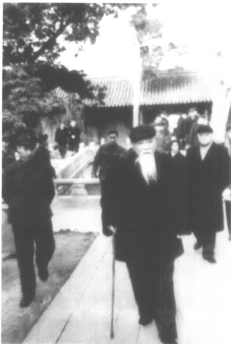
1981年，胡厥文视察嘉定博物馆。