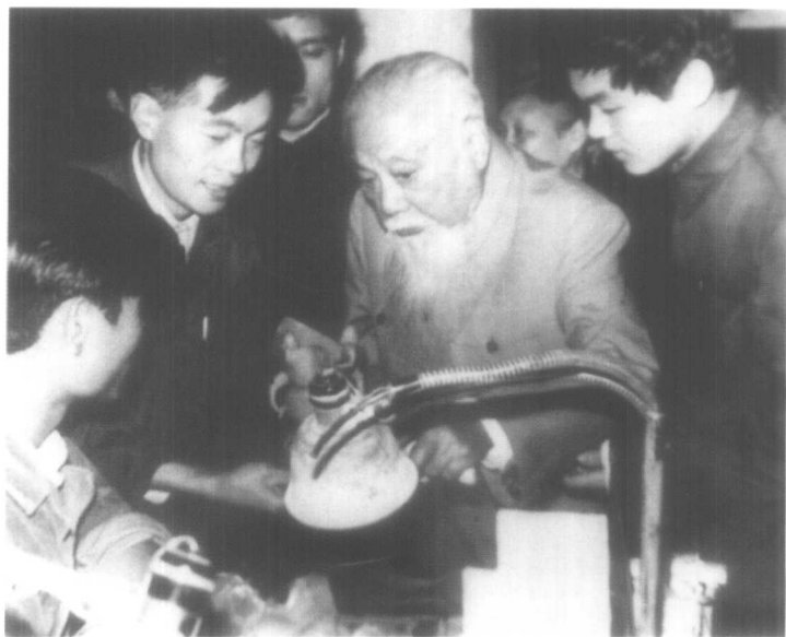
1981年，胡厥文 视察上海玉石雕刻厂。