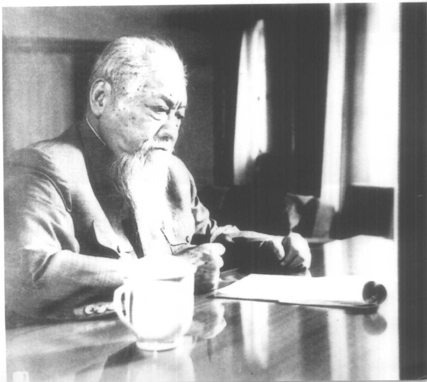
全国人大副委员长胡厥文在办公。