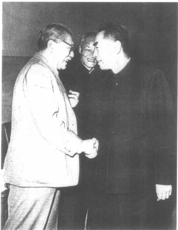
1960年4月，在二届全国人大二次会议上，周恩来总理与胡厥文握手交谈。