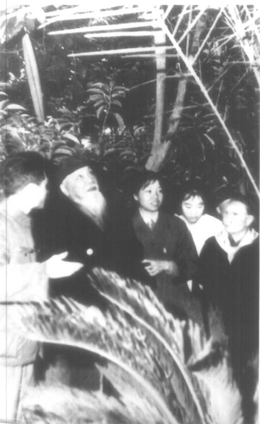
1981年，胡厥文参观植物园。