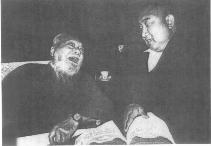
1983年4月，胡厥文和班禅额尔德尼·却吉坚赞交谈。