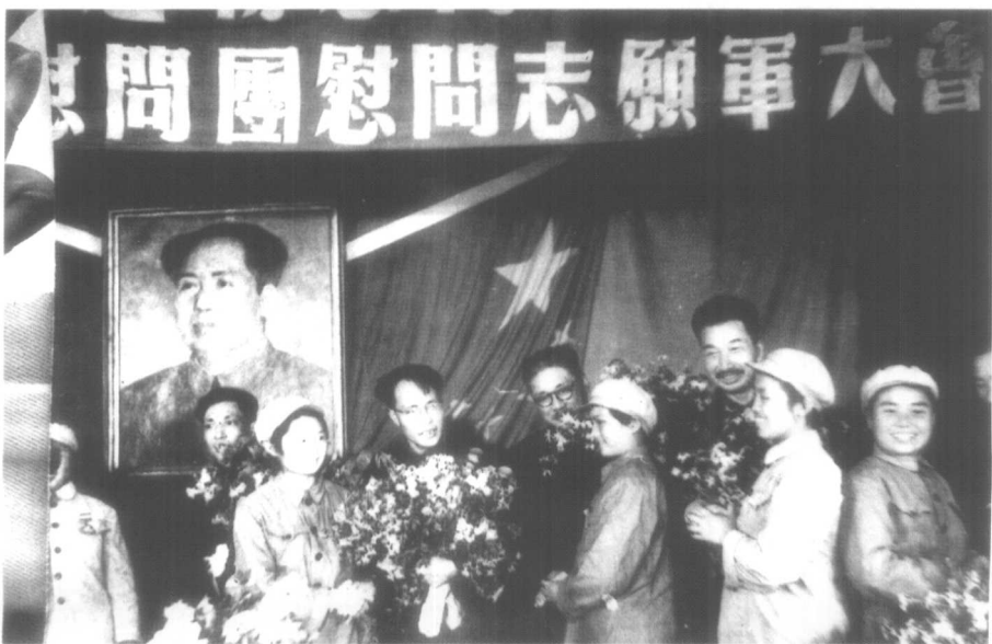
1952年，胡厥文（左四）率团赴朝鲜慰问中国人民志愿军。