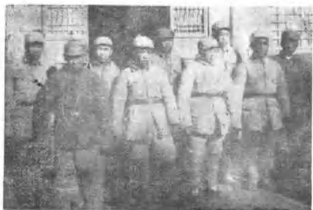
师直英雄 模范合影