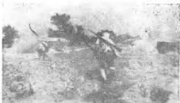
◀ 军台岭战斗中 中部队向敌纵 深碉堡群实施 连续攻击