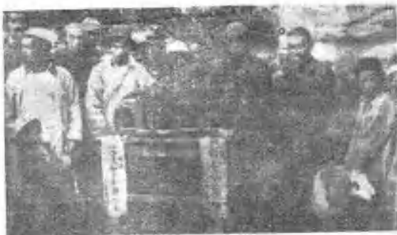
西进途中部 队受到临夏各 族人民的热情 欢迎