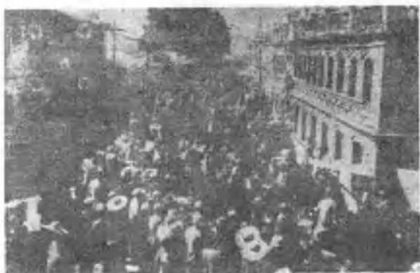
西宁宣告解 放，群众欢欣 鼓舞，纷纷拥 上街头热烈欢 庆