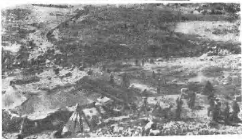
建设新青海， 部队在高寒地区 修筑青藏公路