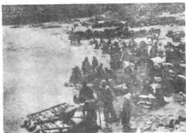
部队乘羊皮 筏西渡黄河， 向马步芳老巢 青海挺进