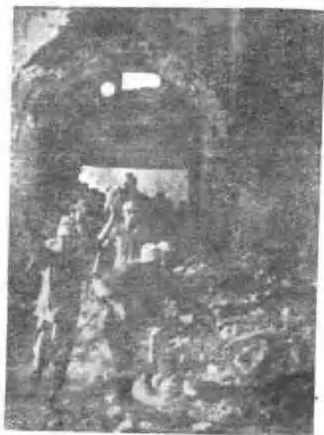
◀ 贾道守敌向我举手 投降