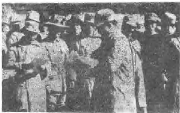
马步芳残部向我缴械投降