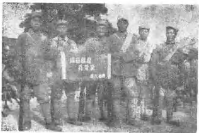
战斗英雄 集体周黑子 班