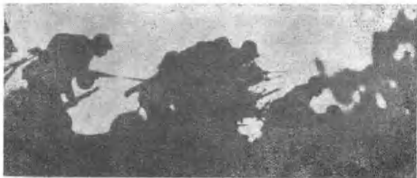
宜瓦战役中，部队向敌二十九军军部发起总攻击