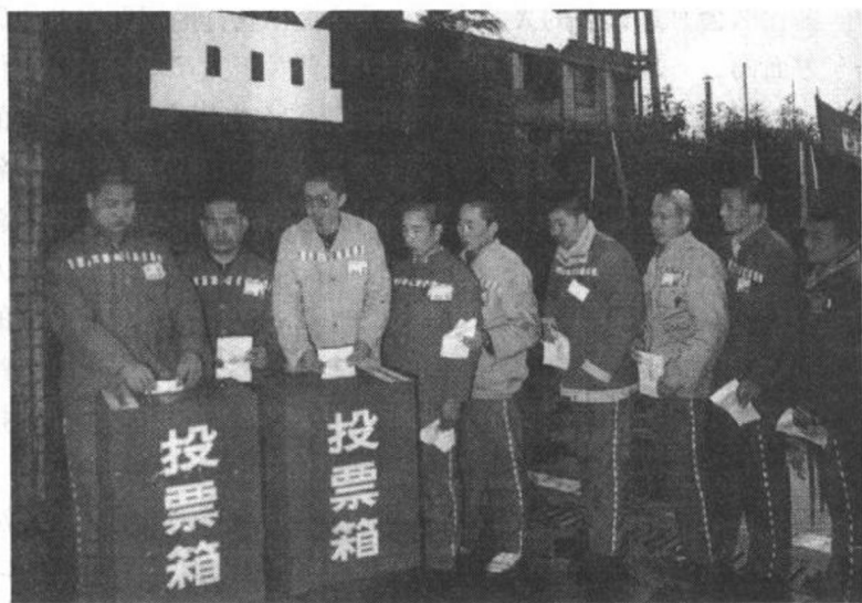
流动投票箱使有选举权的服刑人员充分行使选举的权利。

当然，也不能否认，监狱系统内确有违纪甚至违法的现象存在。这就如人们常说的：“林子大了，什么鸟没有？”任何领域都有“害群之马”。监狱不是“世外桃源”，自然不能例外。不久前，《中国青年报》对湖南省邵东监狱个别干警严重违纪违法事件予以披露，引起“强烈社会反响”。其实，正是因为这种事情比较少，所以才具有“新闻价值”。我认为，一件坏事具有“新闻价值”，对整个社会来说是好事；当一件好事具有“新闻价值”的时候，对整个社会就未必是好事了。