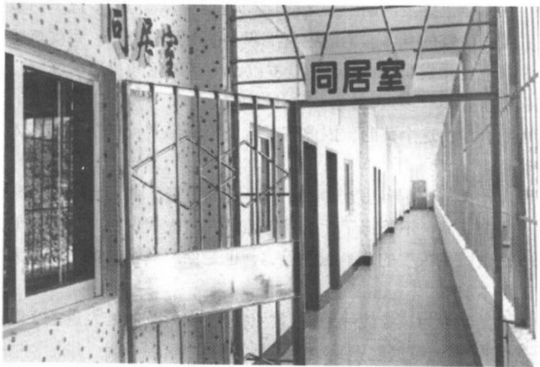
表现好的服刑人员,可以在监狱里的同居室与妻子同居。

三、在一些监狱,都有一个集中关押老弱病残犯人的监区。将老弱病残犯人集中关押的目的,一是便于管理,二是可以在生活和劳动等方面对其进行适当的照顾。北京监狱管理局在这方面迈出的步子更大,干脆把北京市各监狱的老弱病残犯人集中到一起,将延庆监狱改成专押老弱病残犯的监狱。这在全国也许是第一家。现在延庆监狱关押的1400多名犯人中,有70%是老弱病残犯。延庆监狱医院在预防和治疗犯人疾病方面,做了大量的独具特色的工作。