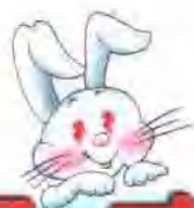
图 文 本