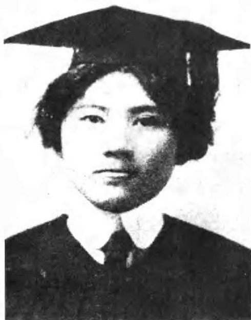
宋庆龄一九一三 年的大学毕业照