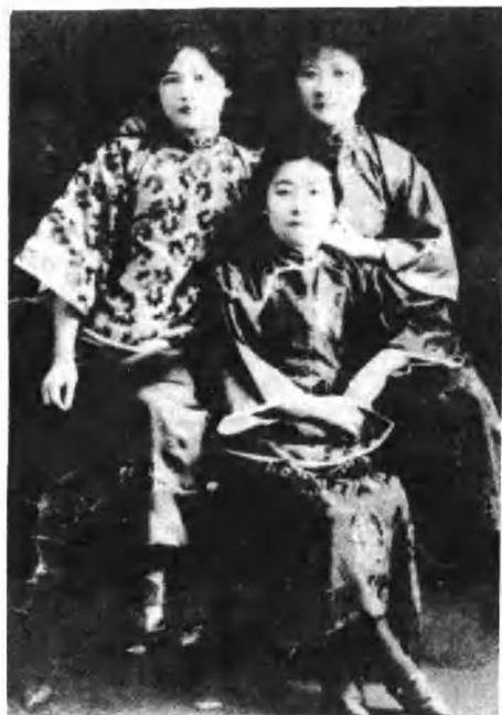
宋庆龄（左）、宋霭龄（中）、宋美龄（右） 在威斯里安女子大学读书 时合影