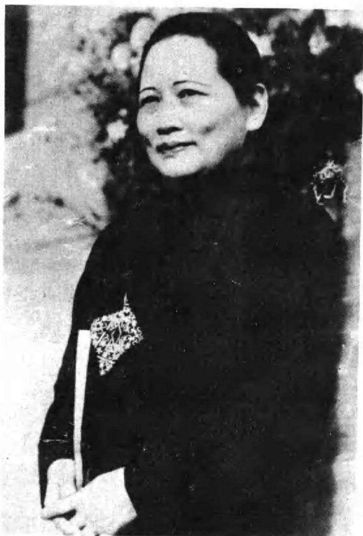
宋 庆 龄 (一八九三——一九八一)