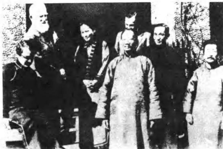
一九三三年二月十七日，宋庆龄宴请肖伯纳后在宅内合影留念。右起：鲁迅、林语堂、伊罗生、蔡元培、宋庆龄、肖伯纳、史沫特莱。