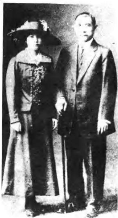
宋庆龄与孙中山一九一五 年在日本东京结婚留影