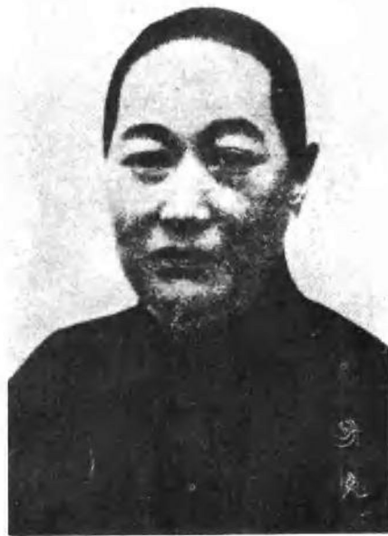
宋庆龄的母亲倪桂珍