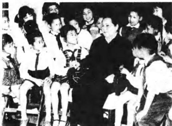
一九六二年，宋庆龄在“六一”国际儿童节的联欢会上。