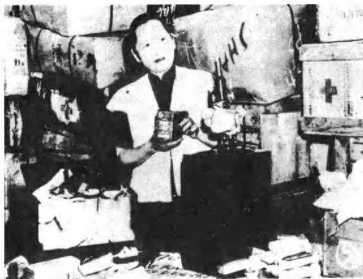
宋庆龄于一九四八年检查运往解放区的医药和器材。