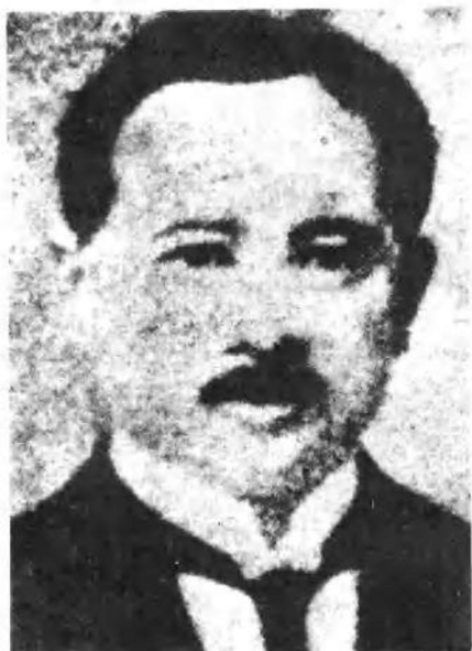
宋庆龄的父亲宋嘉树