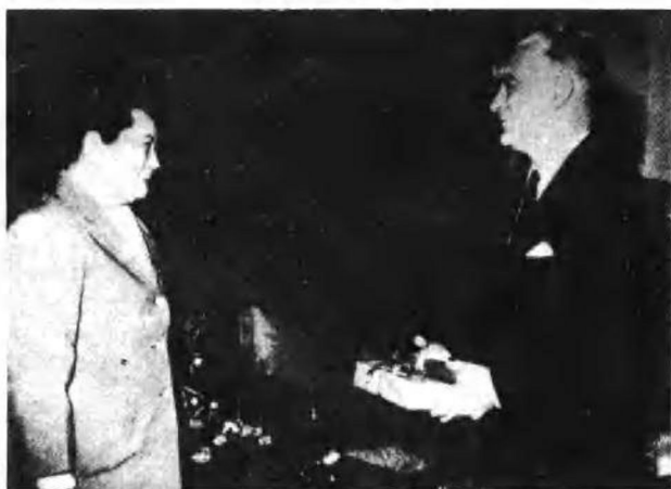
一九六四年十二月十八日，宋庆龄在北京住所会见中国人民的老朋友、美国著名作家埃德加·斯诺。