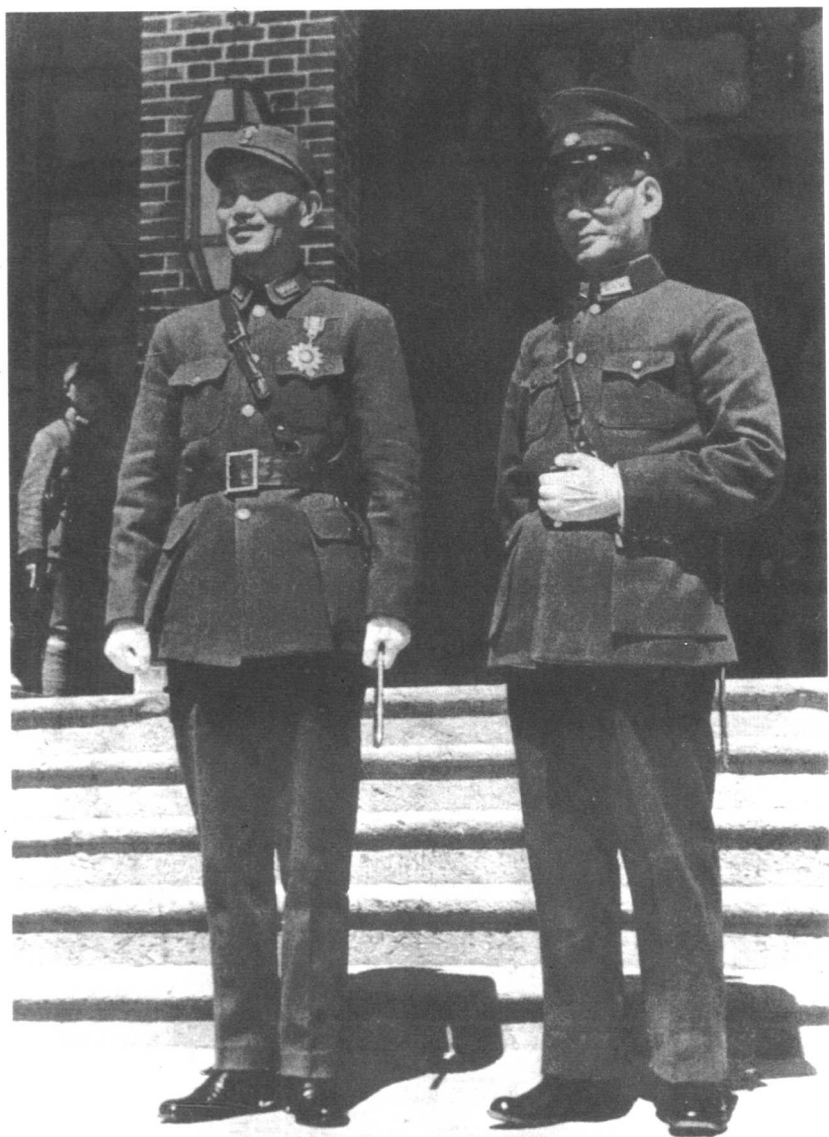
龙云与蒋介石合影。