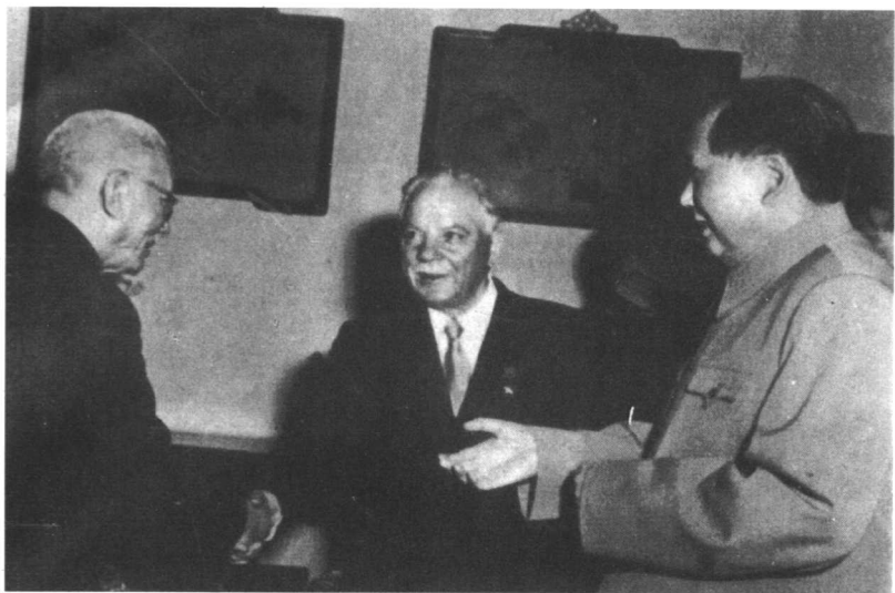
龙云与毛泽东、伏罗希洛夫在一起。