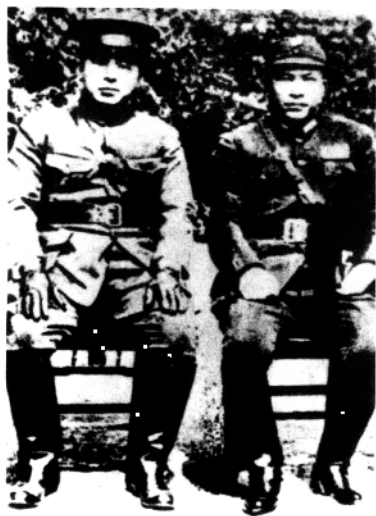
西安事变前，张学良 与杨虎城合影。这是两人 的最后一张合影。