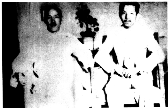
1929年7月，蒋介石与张学良在北平第一次会面。