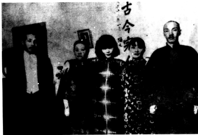
左起：张学良、宋霭龄、于凤至、宋美龄、蒋介石。