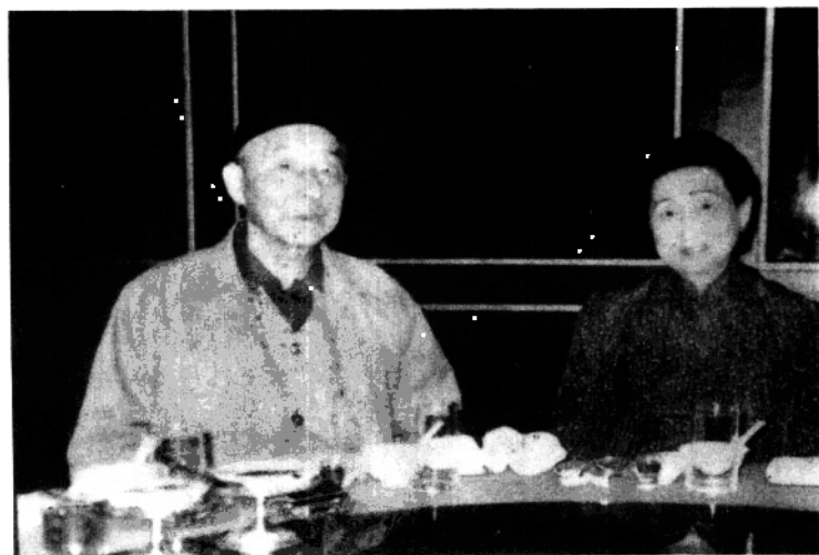
1988年，张学良与夫人赵绮霞合影。