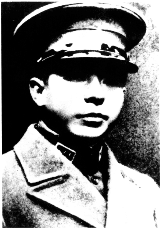
张学良摄于 1934 年。