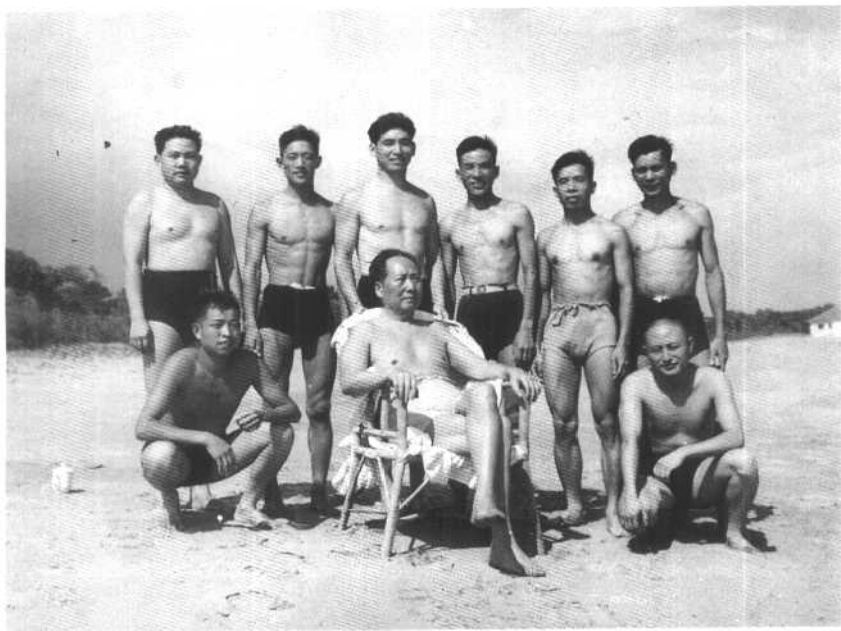
1960年8月1日，毛泽东在北戴河海滨游泳后和陈长江等人合影。