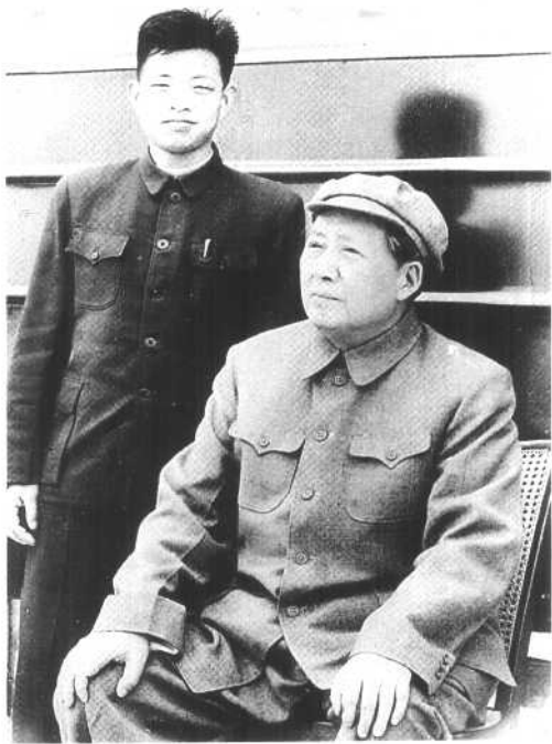
毛泽东视察南方途中，和本书作者陈长江在专列前合影。