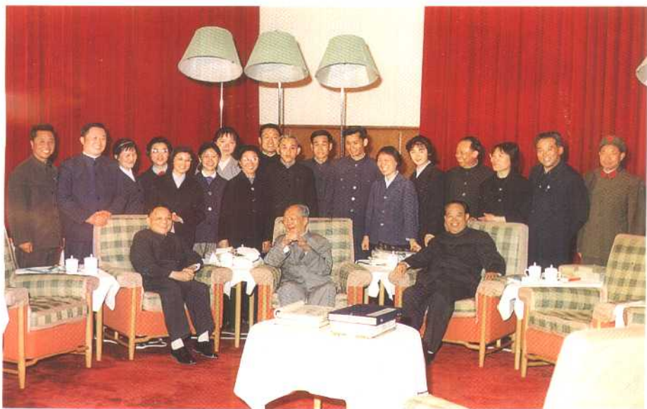
1975年9月2日，毛泽东由邓小平、汪东兴陪同会见英国前首相希思后，和身边工作人员合影（右起第一人为陈长江）。这时毛泽东刚成功地作完眼疾手术，恢复了部分视力，十分高兴。