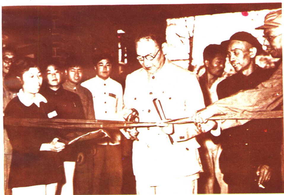
1958年程潜省长为全省野生植物展览会剪彩