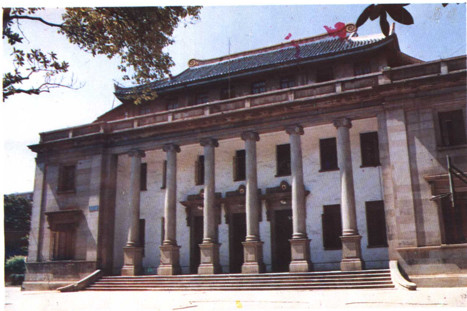
50年代湖南省人民政府(礼堂)旧址