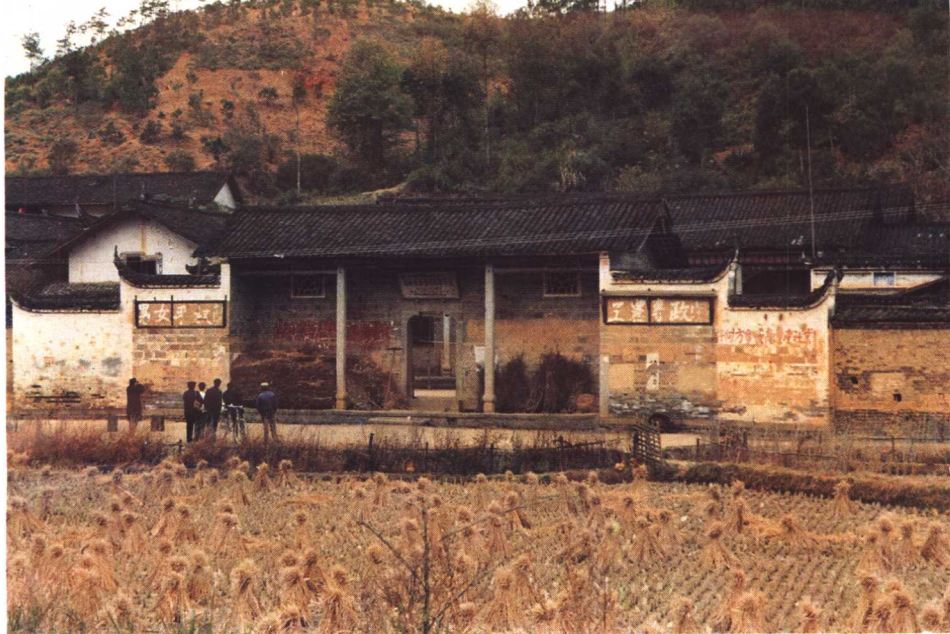
1931年湖南省苏维埃政府旧址——浏阳东门锦绶堂