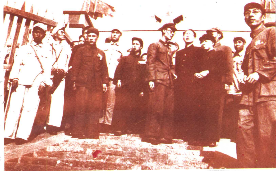
1951年王首道主席(前右二)与中共湖南省委书记黄克诚(前右三)在长沙市轮渡码头调查