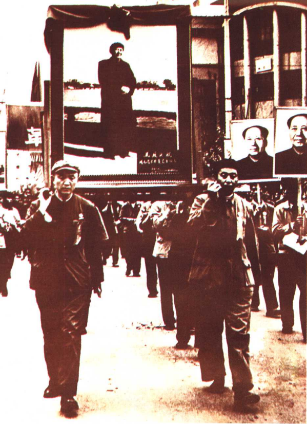
1970年12月代理省革命委员会主任华国锋(中)深入枝柳铁路工地调查