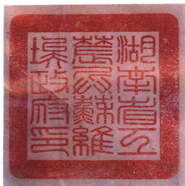
湖南省苏维埃政府方印