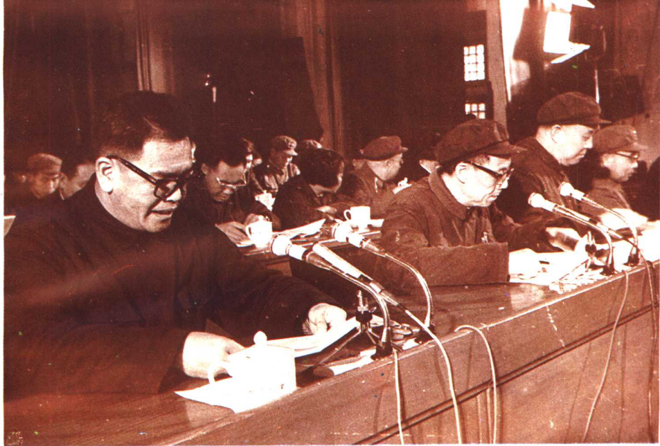
1977年11月省革命委员会主任毛致用(左一)在省五届人大一次会议上作工作报告