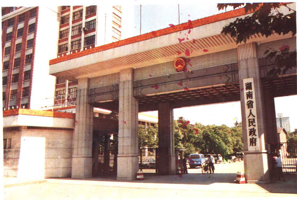
80年代湖南省人民政府大院