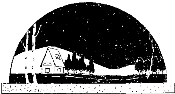
人们抬头看，头上是一个圆穹形的天空

比如，人们抬头看，头上是一个蓝蓝的圆穹形的天空；人们放眼望，脚下是一片一望无际的原野。他们于是就对这些自然现象加以简单的解释，认为天空是一个圆穹形的屋顶，象一口倒扣着的锅，罩盖在平坦的大地上；圆屋顶的四壁嵌着无数美丽的金钉，这就是我们看到的闪闪发光的星星。