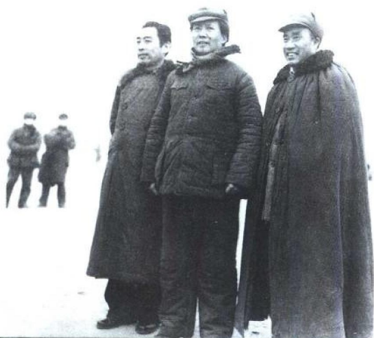
1946年11月19日， 周恩来到延安后和毛 泽东、朱德在一起。