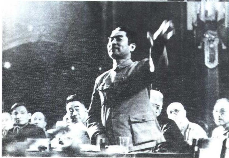
在新政协 筹备会上发言。