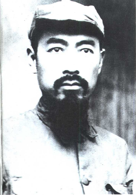
红军时期的周恩来。