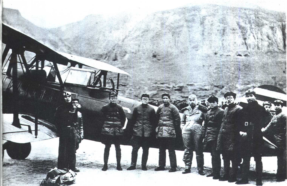
西安事变和平解决后，周恩来到延安时，在机场同（左三起）秦邦宪、张闻天、毛泽东、彭德怀、林伯渠、肖劲光合影。