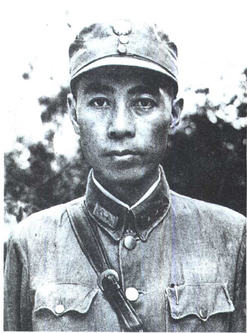
抗战初期的周恩来。