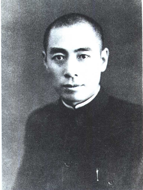
西安事变期间的周恩来。