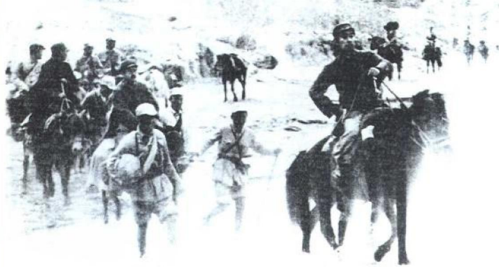
周恩来（前右一） 骑马者）和毛泽东（前 右三骑马者）、任弼时 （前右二骑马者）在转 战途中。