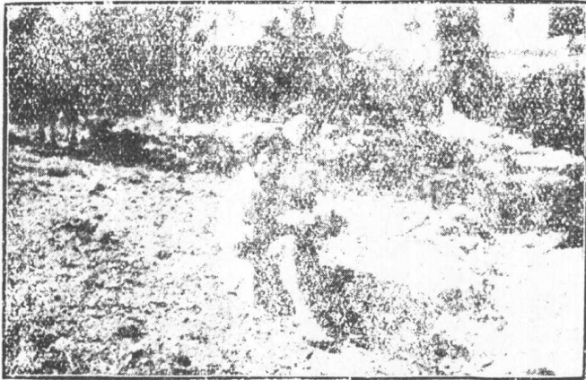
此系夷族除黑白夷外所稱水田也是