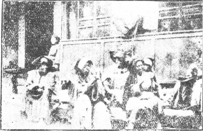
越嶲夷婦在漢族街市地紡織毛線情形