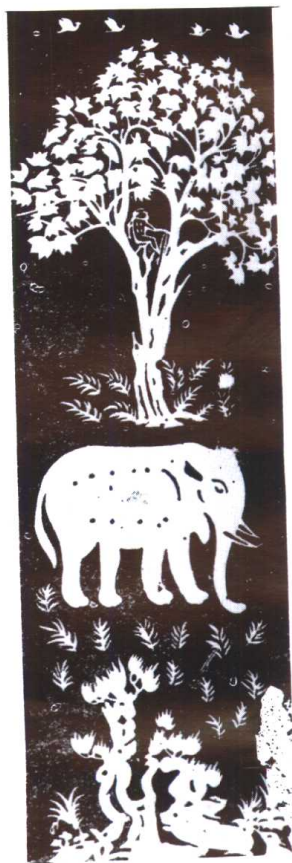
唐代蜡纈象纹屏风。