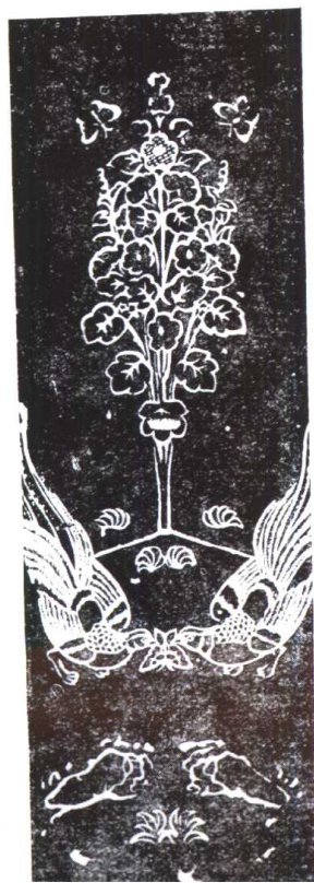
唐代夹纈花树对鸟屏风。