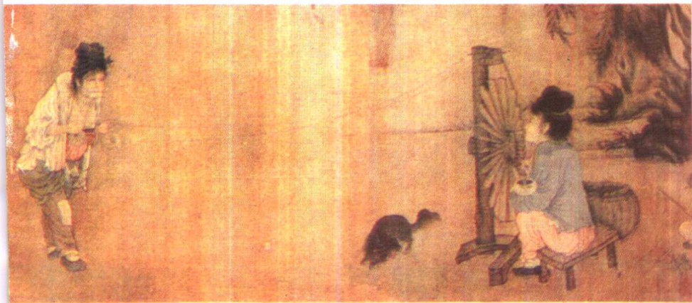
北宋·王居正《纺车图》