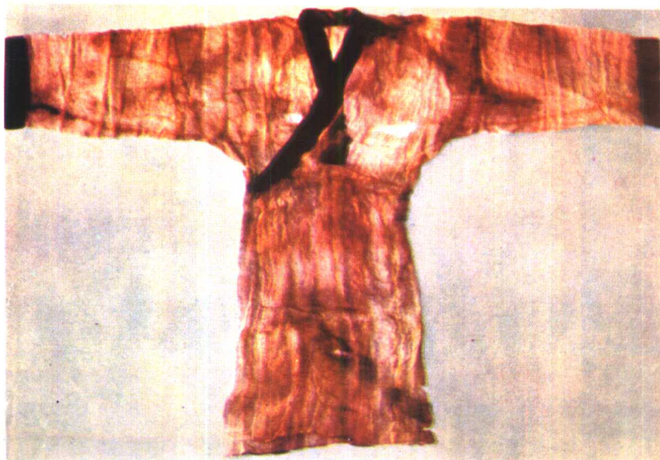
长沙马王堆一号汉墓出土的素纱禅衣。