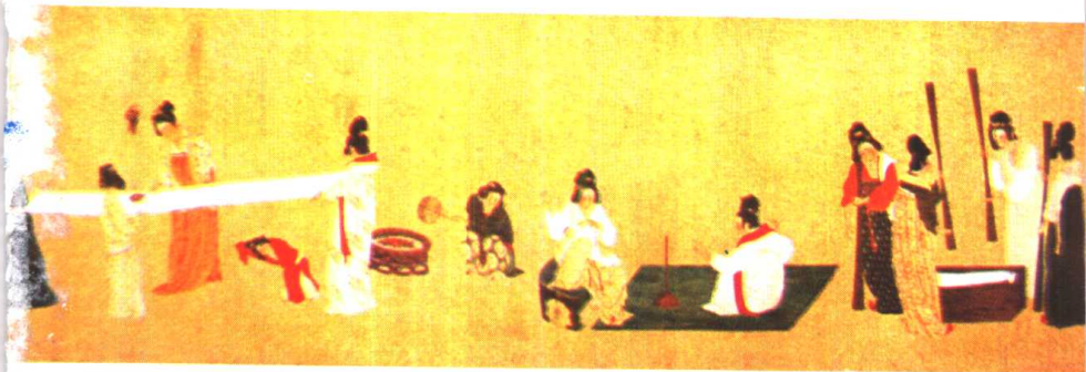
《捣练图》唐·张萱作，原画现藏美国波士顿博物馆。