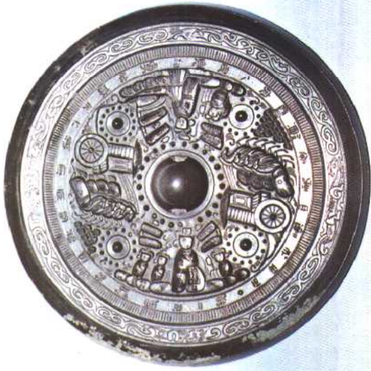
车马神仙画像镜（东汉）