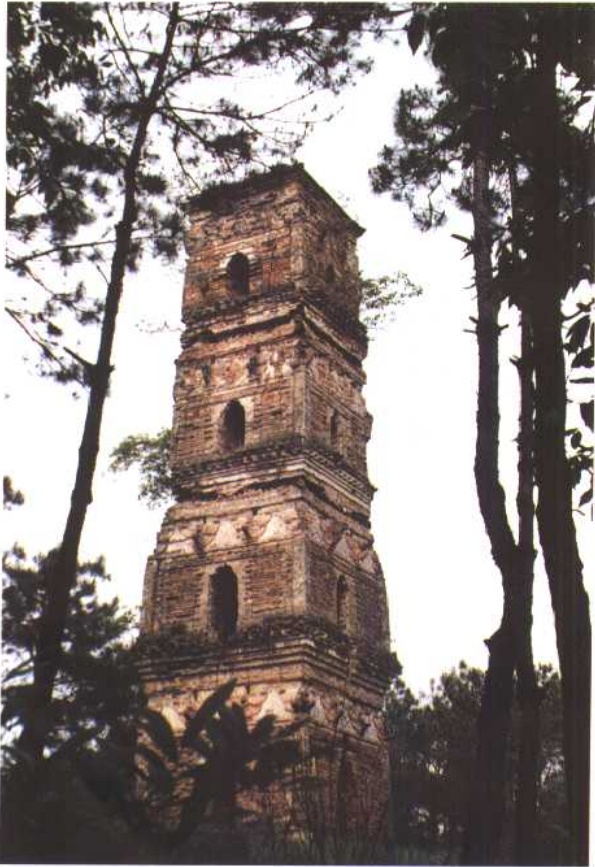
建于北宋的枫桥东化城寺塔