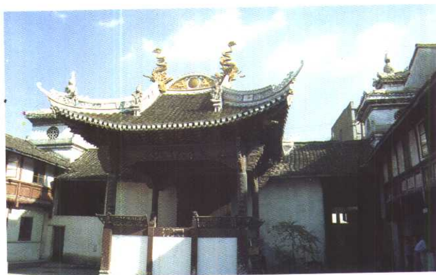
一九三九年三月 卅一日周恩来作 抗日演讲的枫桥 大庙戏台