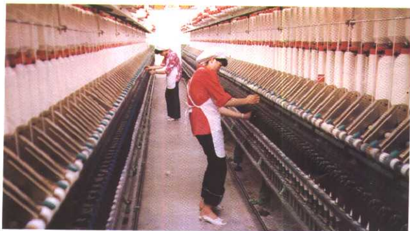
诸暨纺织总厂车间一角