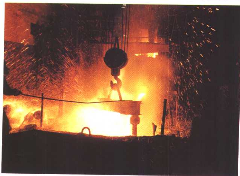
诸暨铸钢厂车间一角