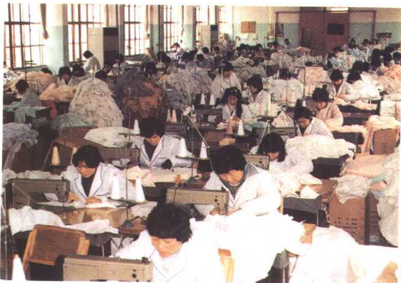
中日合资旦旦有限公司 生产车间