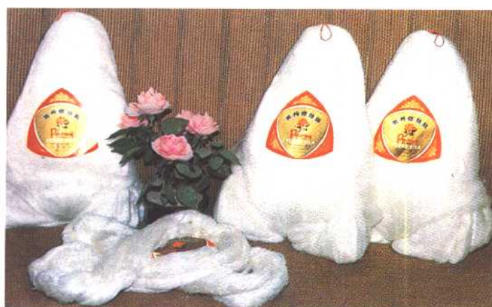
“牡丹牌”丝绵、丝绵线