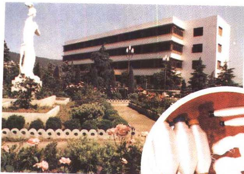
诸暨绢纺织厂一角及省优 产品“红梅牌”绢丝