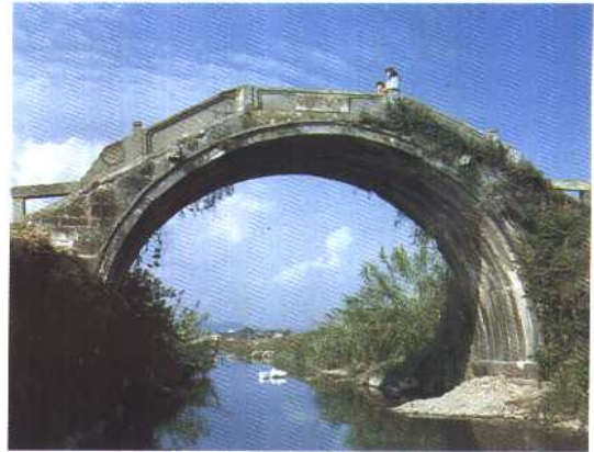
建于清嘉庆四年的宝珠桥