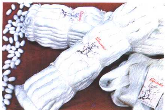
省优产品“梅花牌”白厂丝