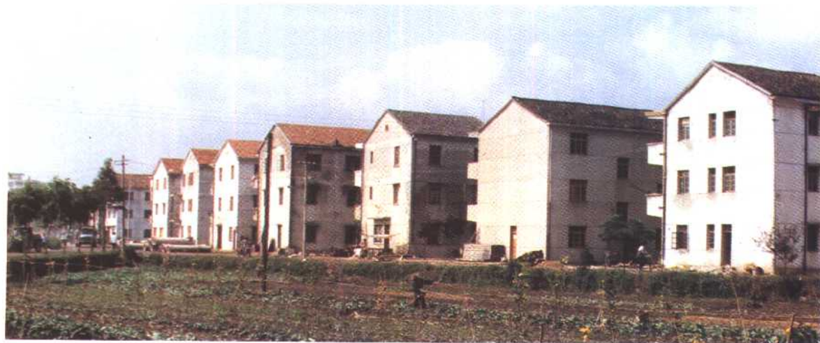
丫路头村农民新居