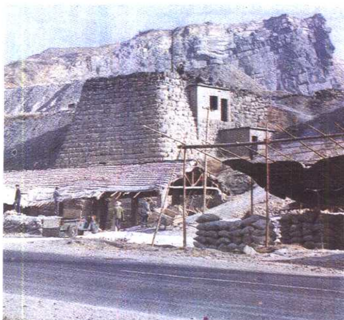
石灰窑及露天石煤矿