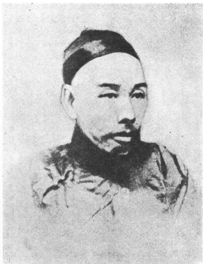
黃 運 憲 像