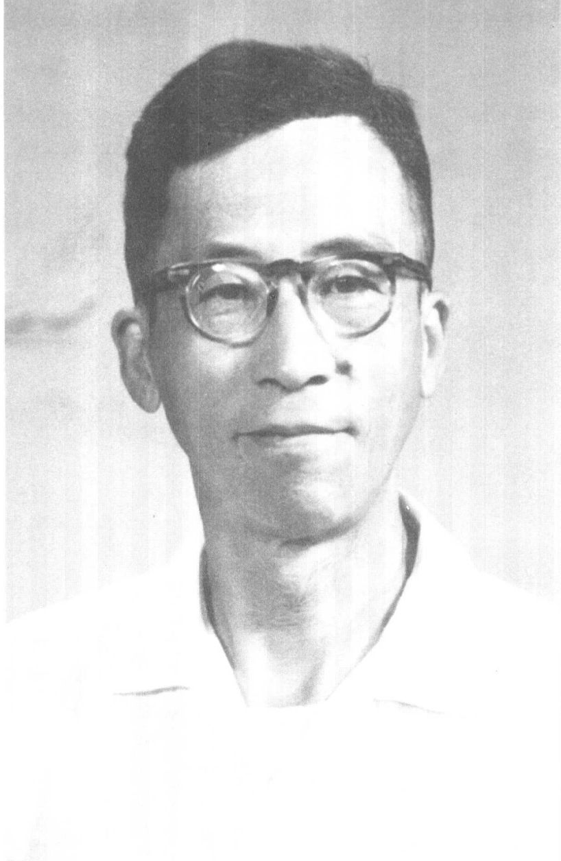
作者像 · 摄于1972年