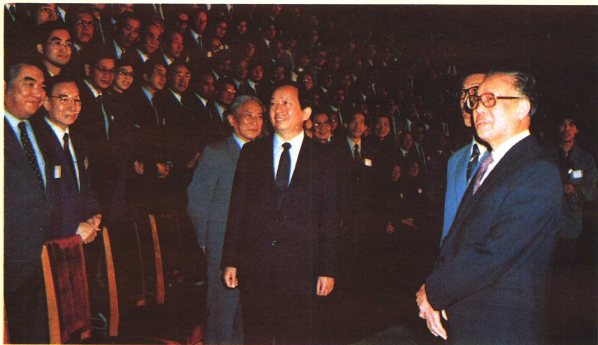
▲ 1985年5月，赵紫阳总理会见“中国面对未来”国际研讨会的中外代表。