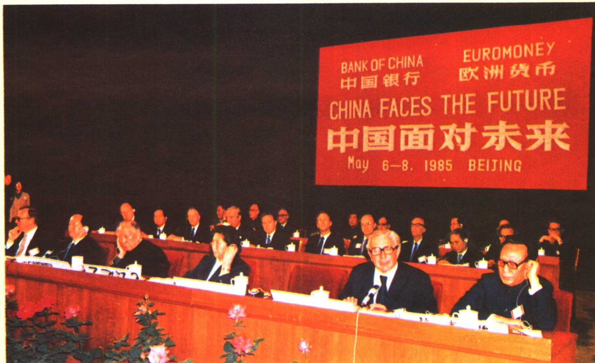
▲ 1985年5月初，中国银行和《欧洲货币》出版社联合举办“中国面对未来”国际研讨会。图为薄一波、田纪云、陈慕华等领导人出席开幕式的情景。