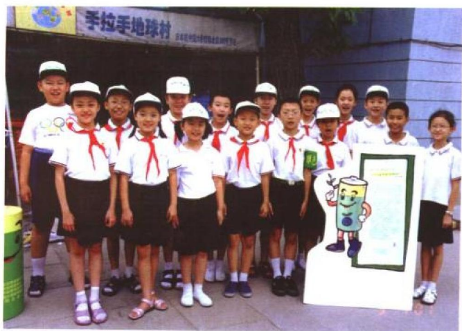
▲ 少先队大队“手拉手地球村”的绿色小卫士们热心为大家服务。