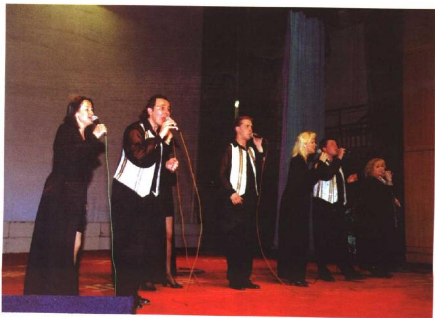
▼ 白俄罗斯的艺术家们来校为学生做精彩演出。