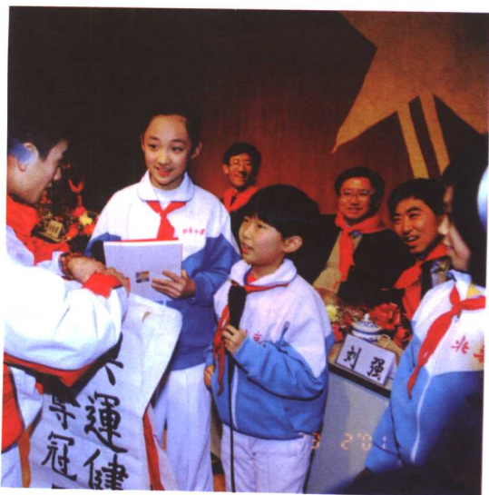
▲ 我校的小记者向世界冠军郑李辉大哥哥提问。