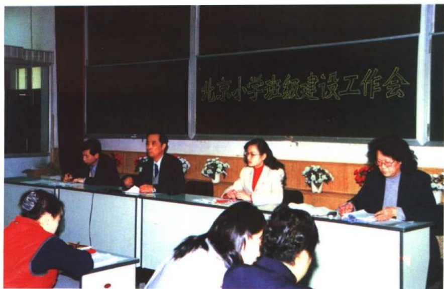
▲ 2000年2月24日，北京小学召开班级建设工作会，共同研讨主体性班级教育的理念与实践经验。

▼ 2000年5月26日，北京小学召开“九五”市级重点课题“优化素质结构，促进小学生全面发展”的改革实验课题结题会。北京教科院副院长文喆、老教育专家温寒江、北京市教委基教处处长富凯宁参与课题鉴定。