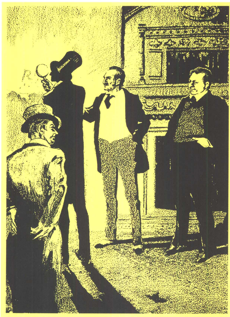
劳瑞斯顿花园街的惨案