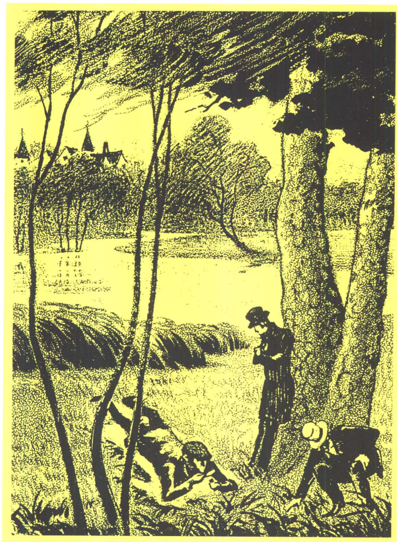
博斯科姆比溪谷秘密