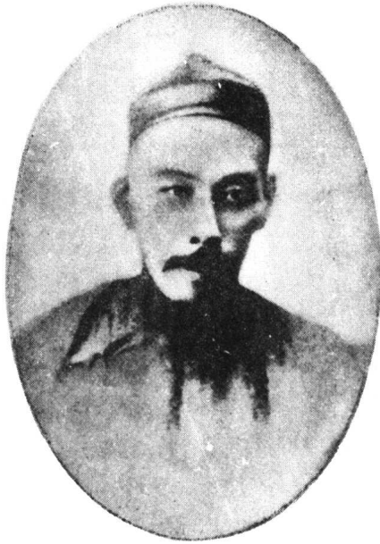
黃公度先生中年留影