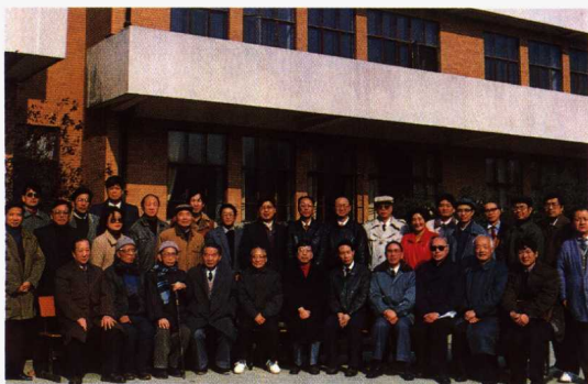
参加赵景深教授追思会人员合影。