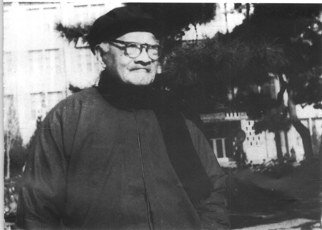
1980年于北京大学朗润园湖畔