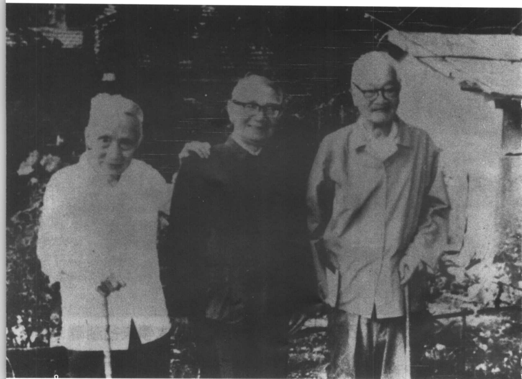
1982年7月与朱光潜（左一）、茅以升（中）合影于北京大学燕南园