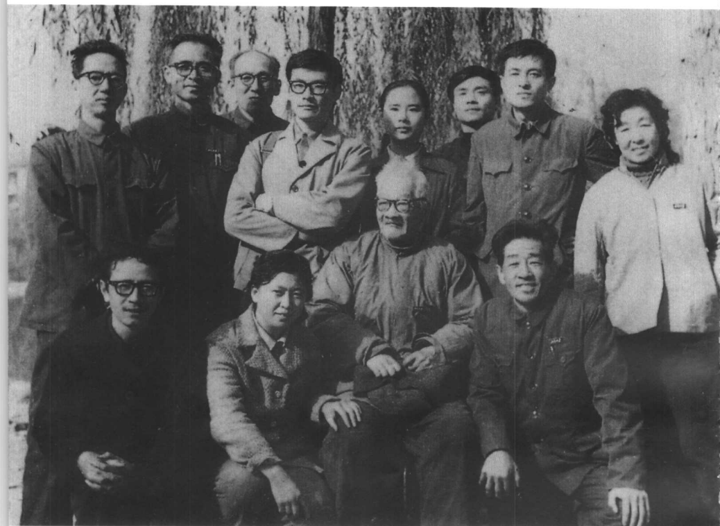
80年代初与北京大学哲学系部分师生在一起