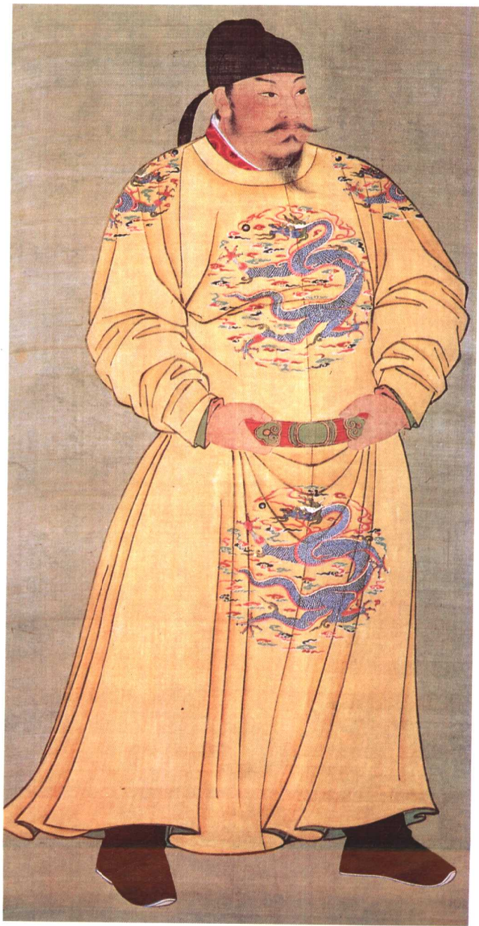
在中國帝王中，像有唐太宗那麼多優點的人很少。