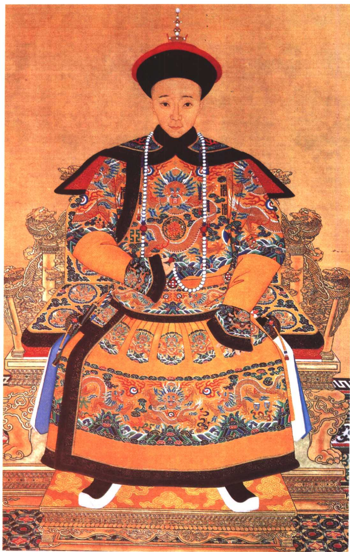
不幸的報告，終於傳到熱河，咸豐皇帝吐了血。