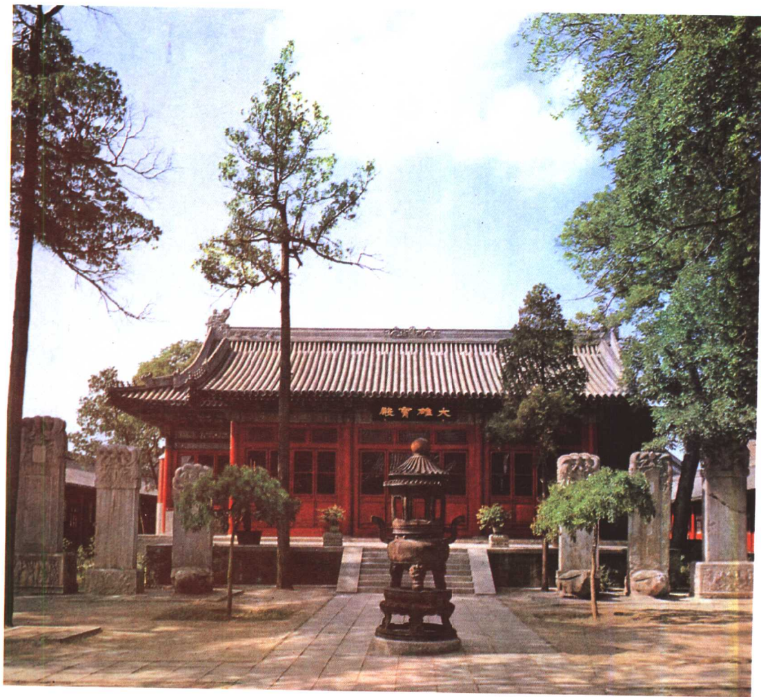
法源寺比起来，就冷清多了。