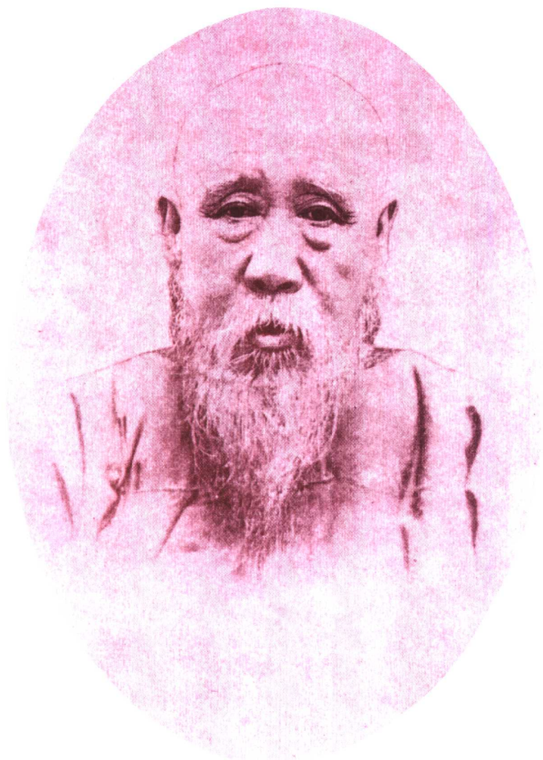
皇帝的老師翁同龢。