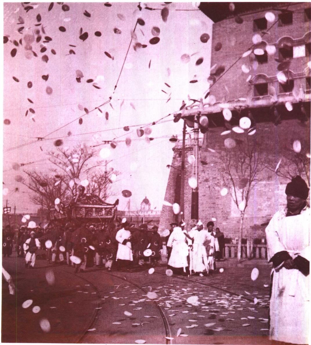
「一撮毛」是職業性灑紙錢的。