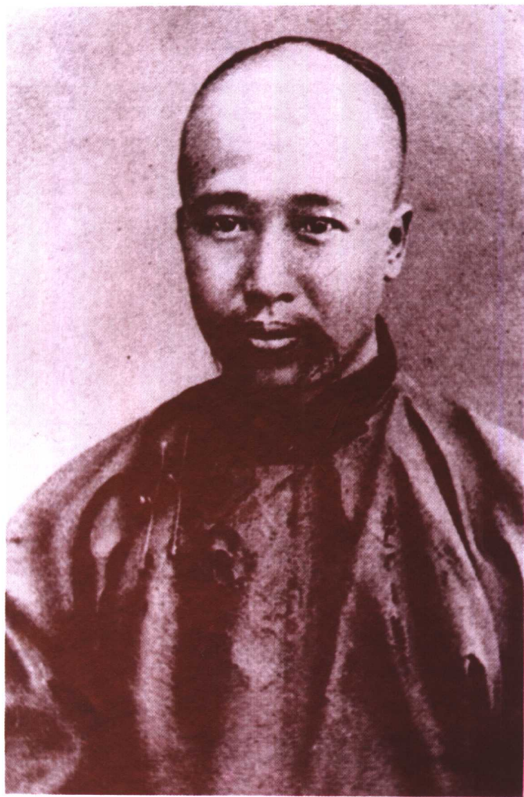
在康有為心裏，有件事情使他聊以自慰。