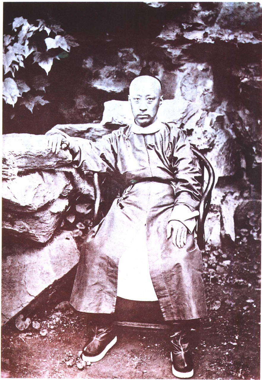
皇帝的弟弟恭親王。