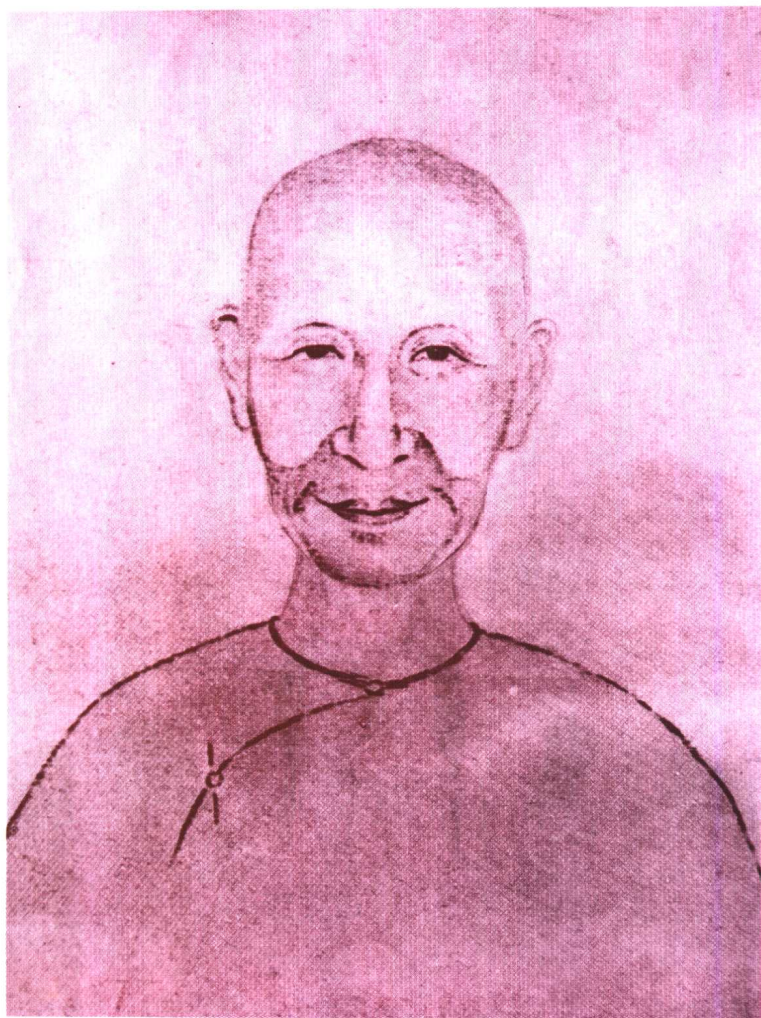
九江先生（朱次琦）不是一輩子只肯穿布袍的進士嗎？