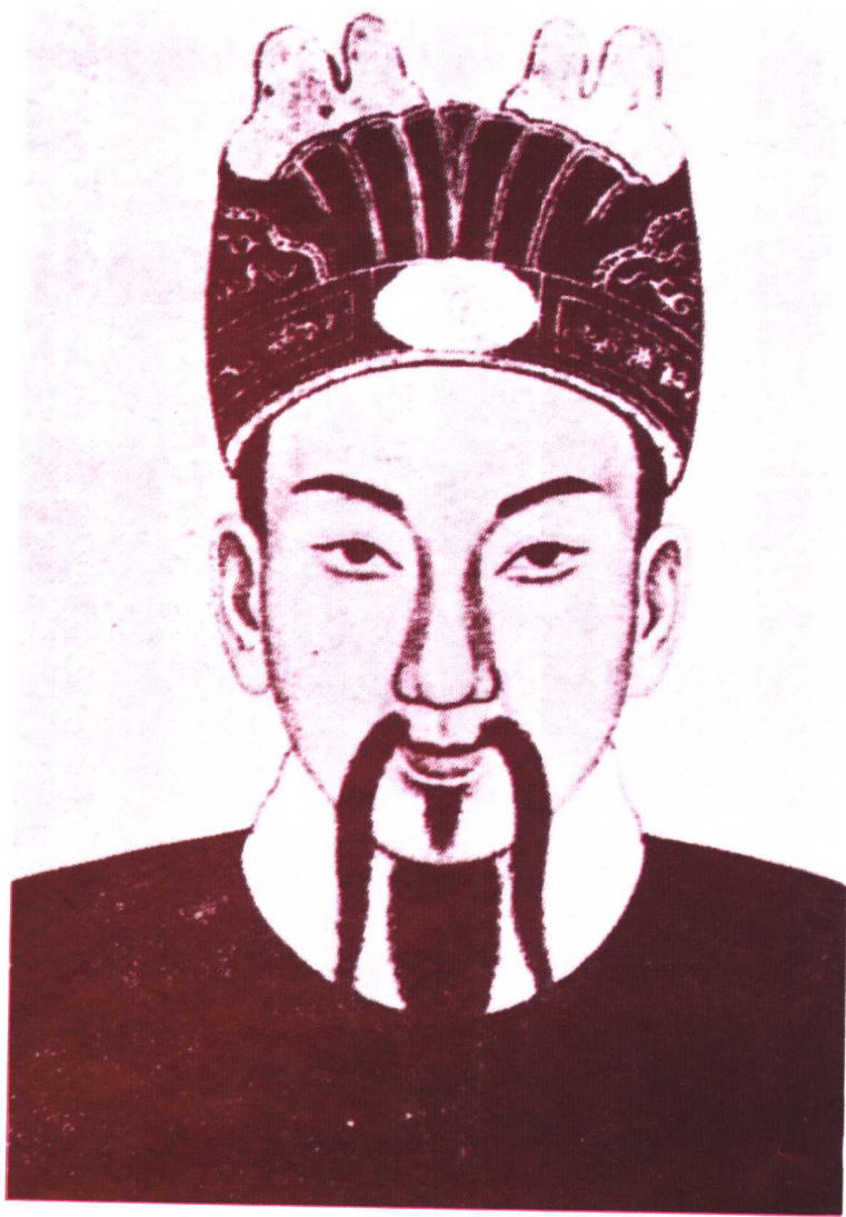
袁督師（袁崇煥）的殉國真相，一直諱莫如深。