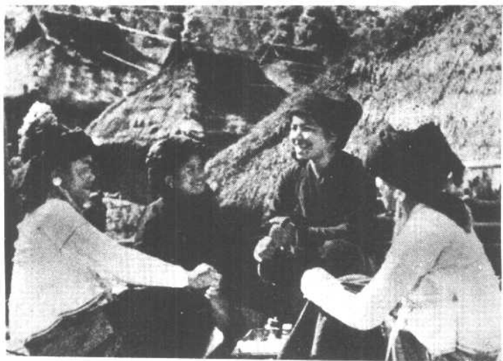
走村串寨的布朗族赤脚医生。