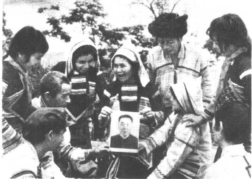
基诺族人民热爱华主席。