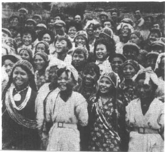
欢乐的怒族青少年。