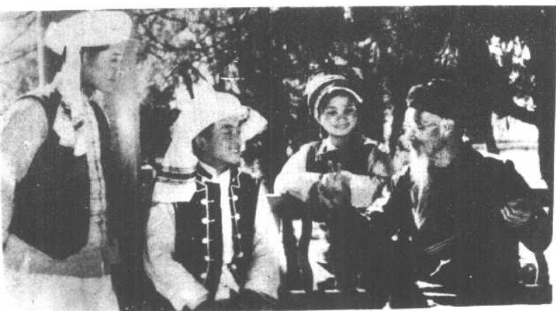
白族老艺人为青年传授大本曲的演唱技艺。