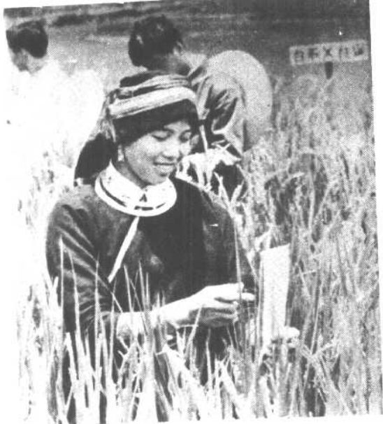
瑶族农业技术员 在田间观察水稻杂交 的生长情况。