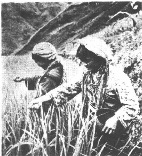
独龙族社员在稻田里撒农药。