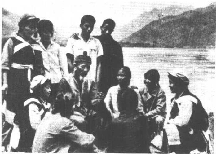
当年为红军划船抢渡金沙江的纳西族老船工， 向青年进行革命传统教育。