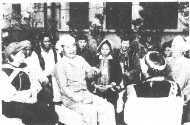
出席五届人大第一次会议的云南各族代表。