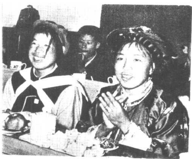
出席中国妇女第四次代表大会的普米族代表（右）。