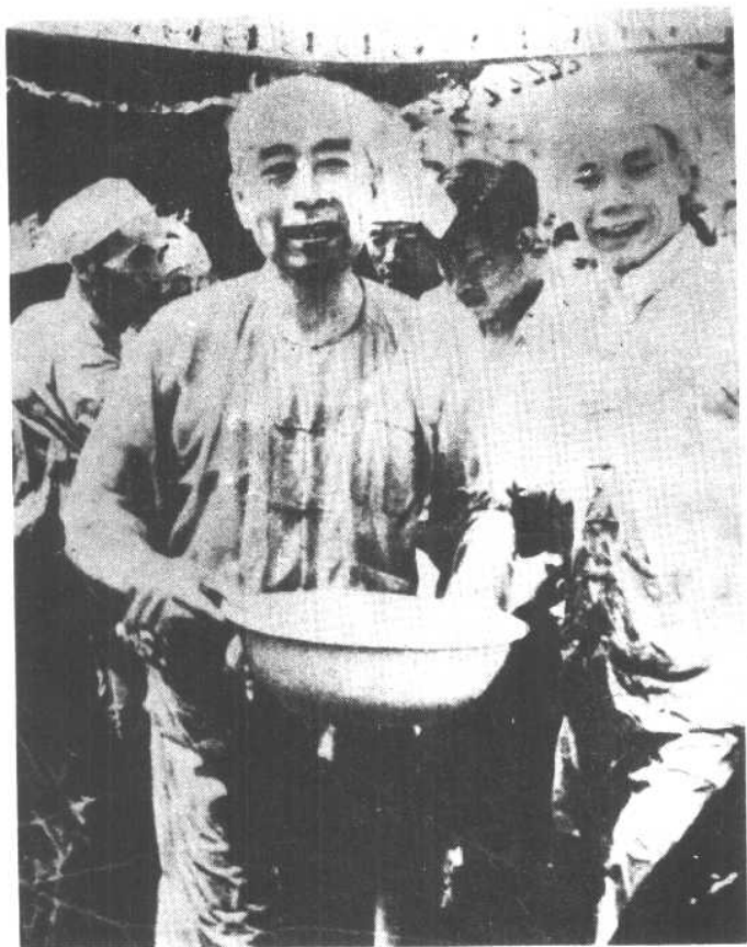
周总理和傣族人民欢度泼水节。