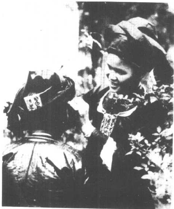
西畴县壮族妇女的服饰。