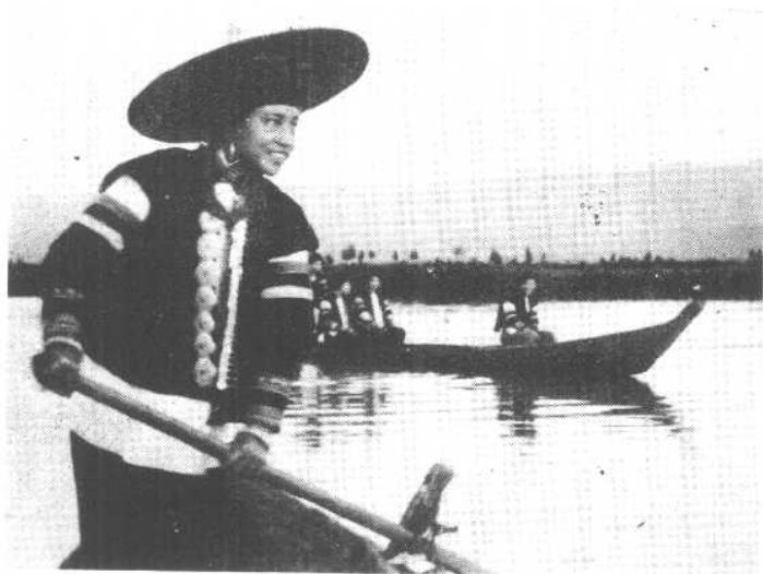
通海县杞麓湖畔的蒙古族。