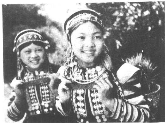
幸福的苦聪新一代。