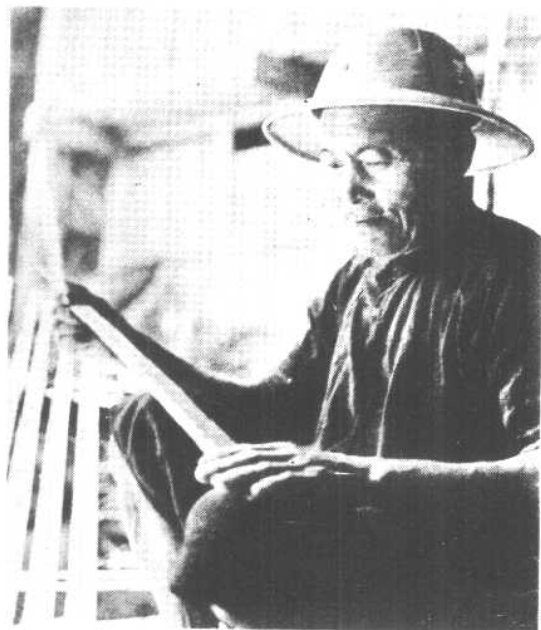
阿昌族老工人 在精心制作著名的 “户撒刀”。