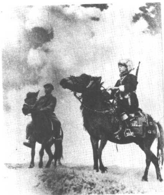
军民联防，保卫边疆。 藏族民兵和边防战士共同 巡逻。