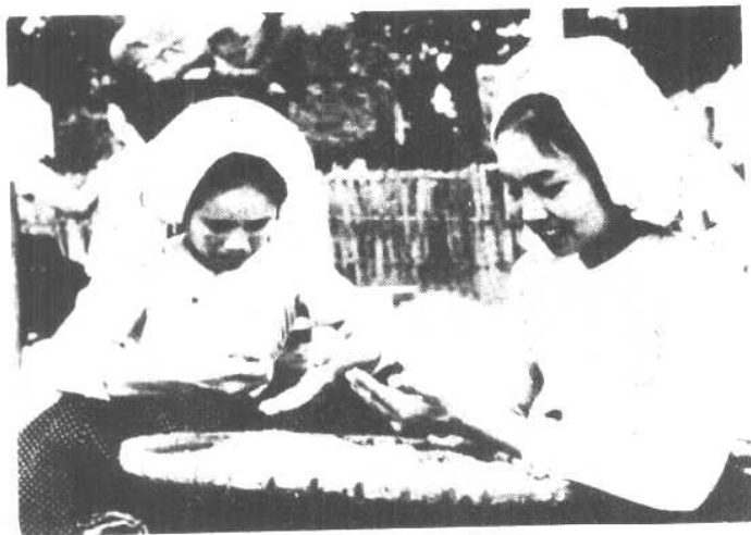
傣族社员精选良种。