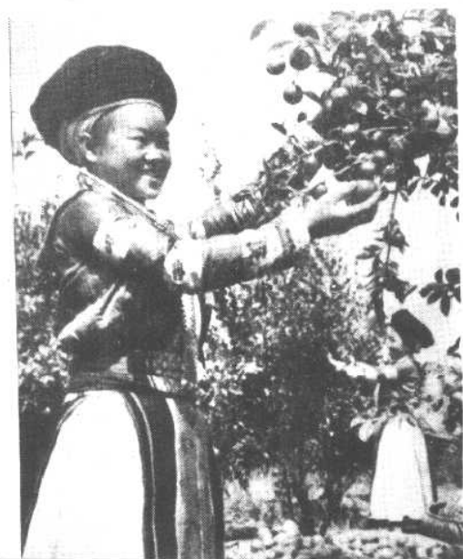
苗族女社员喜摘油茶果。