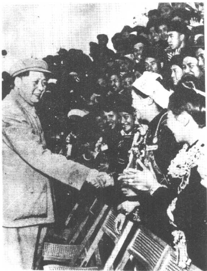
毛主席亲切接见各族代表。