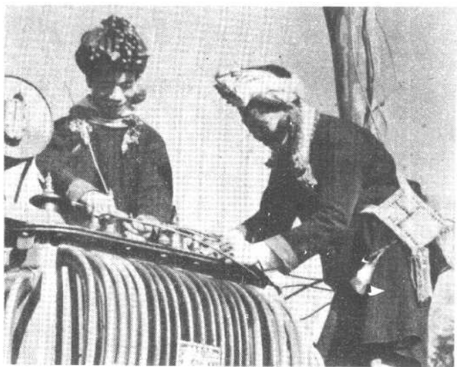
崩龙族的技工在安装变压器。