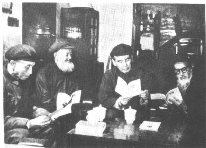
昆明回族阿訇与宗教界人士学习新宪法。