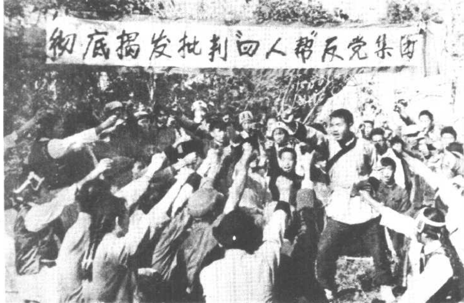
怒江傈僳族自治州各族人民愤怒声讨“四人帮”的罪行。