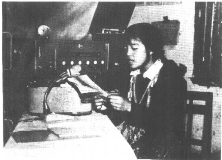
景颇族广播 员用本民族语言 进行广播。