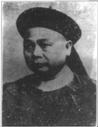
詹天佑——京张铁路总办兼总工程师

1905年,英俄两国为获得京张铁路的修筑权而争得不可开交,最后清政府宣布该铁路由中国人自己修筑。帝国主义分子狂妄叫嚣:“能修这条铁路的中国人还没诞生呢!”而今天我们都知道,京张铁路不仅由中国人修了,而且建得很好,这个大长我们民族志气的民族英雄,就是詹天佑。面对困难,詹天佑这样勉励自己和工作人员:“全世界的眼睛都在望着我们,必须成功!”“不论成功或失败,决不是我们自己的成功或失败,而是我们的国家!”(徐启恒、李希泌《詹天佑和中国铁路》)