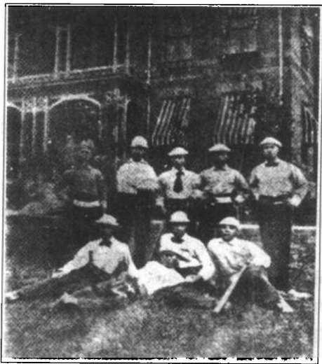
留学生组织之棒球队合影

当年幼童之一的温秉忠(宋庆龄姐妹的姨丈)回忆说:“最后一天——他们的船驶到旧金山大桥下,旧金山给幼童们初次的印象,在以后很长的岁月中,他们仍生动地记忆着。许多轮船穿梭行驶,并排停泊。鳞次栉比的整洁民房,树荫草地中的大厦,市区蜂窝似的商场。”幼童仿佛置身于另一个世界。