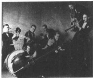
① 1922年The New Orleans Rhythm Kings 乐队在Friar公司的照片

爵士乐不再仅仅是美国文化的一部分，它已经是世界的音乐了，尽管欧洲的爵士乐发展速度也很快，如法国，但听上去总是缺少那么一点味道，一点黑人的味道。