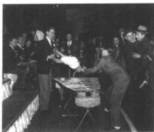
① 兴奋过度的乐迷正冲向Benny Goodman, 1939年