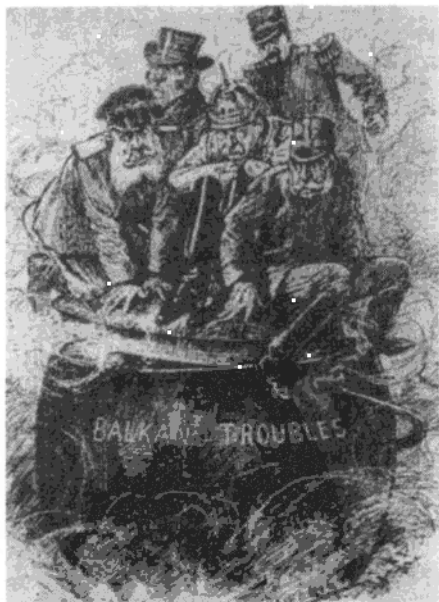
《开锅了！》 《笨拙》画报上反映欧洲 形势的漫画，桶上的字是「巴尔干危机」。