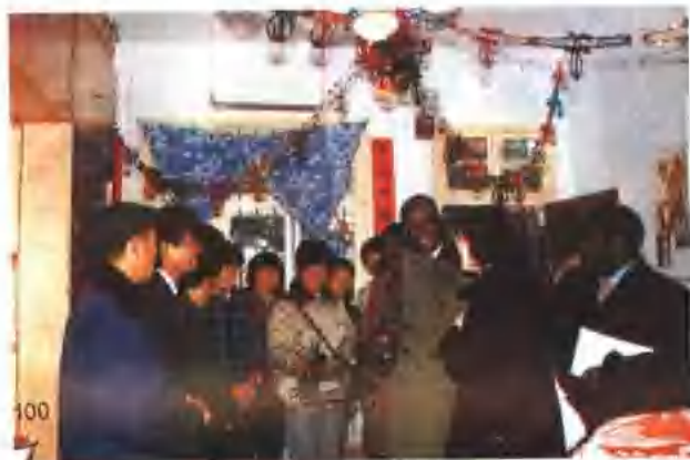
多哥贵宾兴 致勃勃访问长沙 郊区岳麓山乡农 民家庭