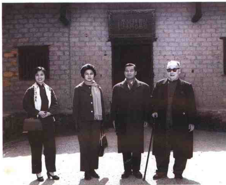
1963年2月22日国务院副总理兼外交部部长陈毅及夫人陪同柬埔寨国家元首西哈努克亲王及夫人参观韶山毛泽东同志旧居