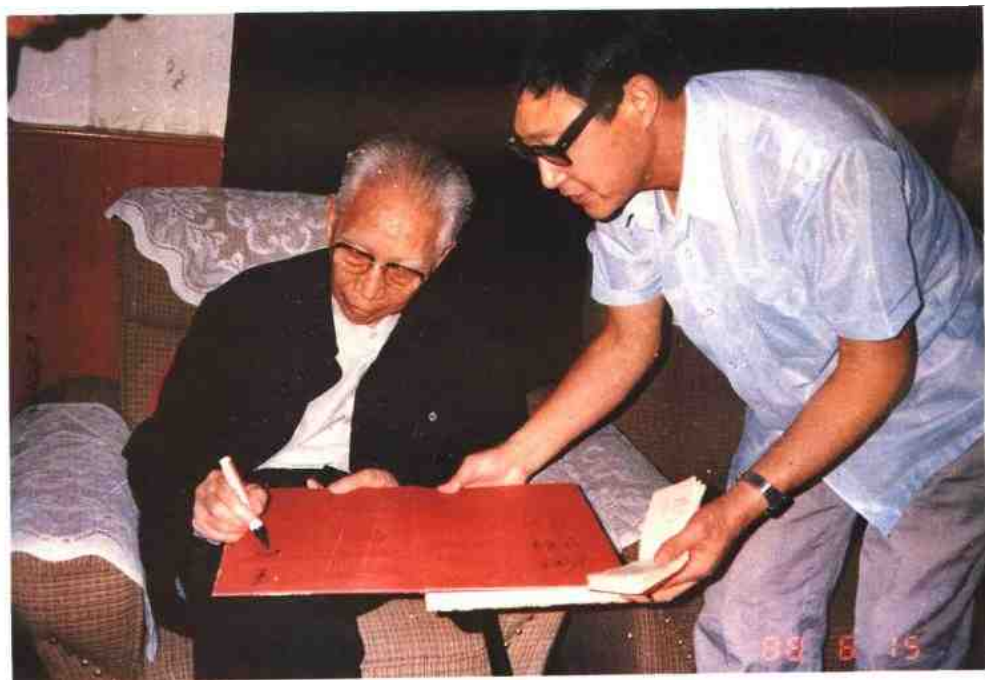
1988年6月，国家副主席王震在正大岳阳有限公司（中泰合资企业）视察时为该公司题词。