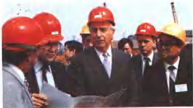
英国贸工部 大臣杨勋爵一行 在华能岳阳电厂 工地