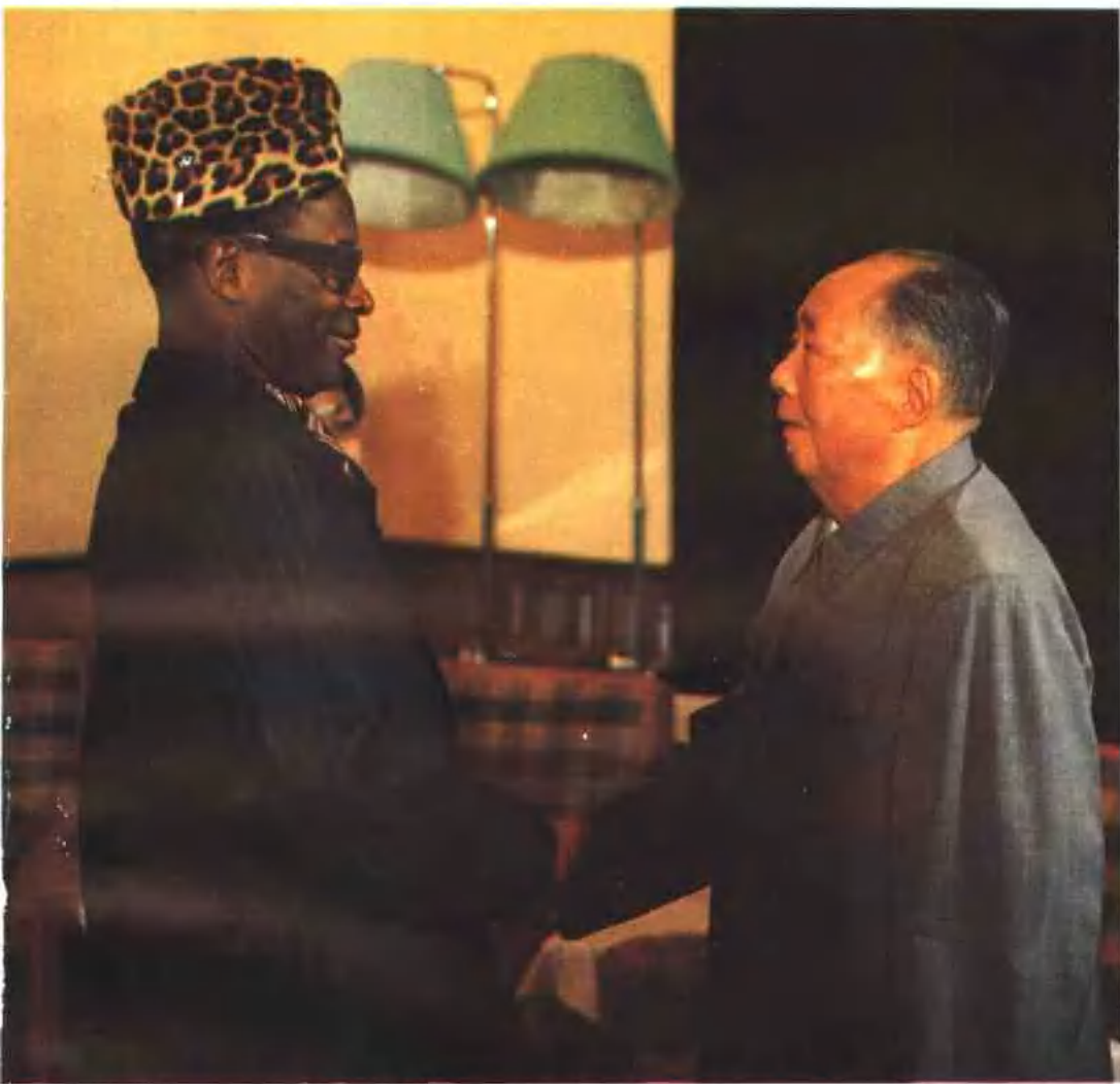
1974年12月17日，毛泽东主席在长沙接见扎伊尔总统蒙博托·塞塞·塞科。