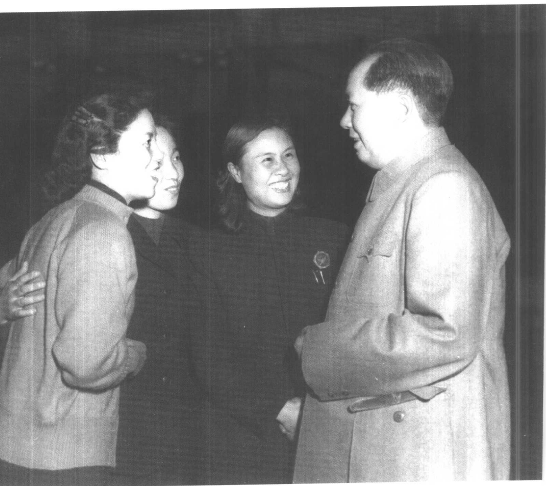
1954年8月,毛泽东和电影演员舒绣文(左一)、桂剧演员尹羲(左三)等在一起交谈。