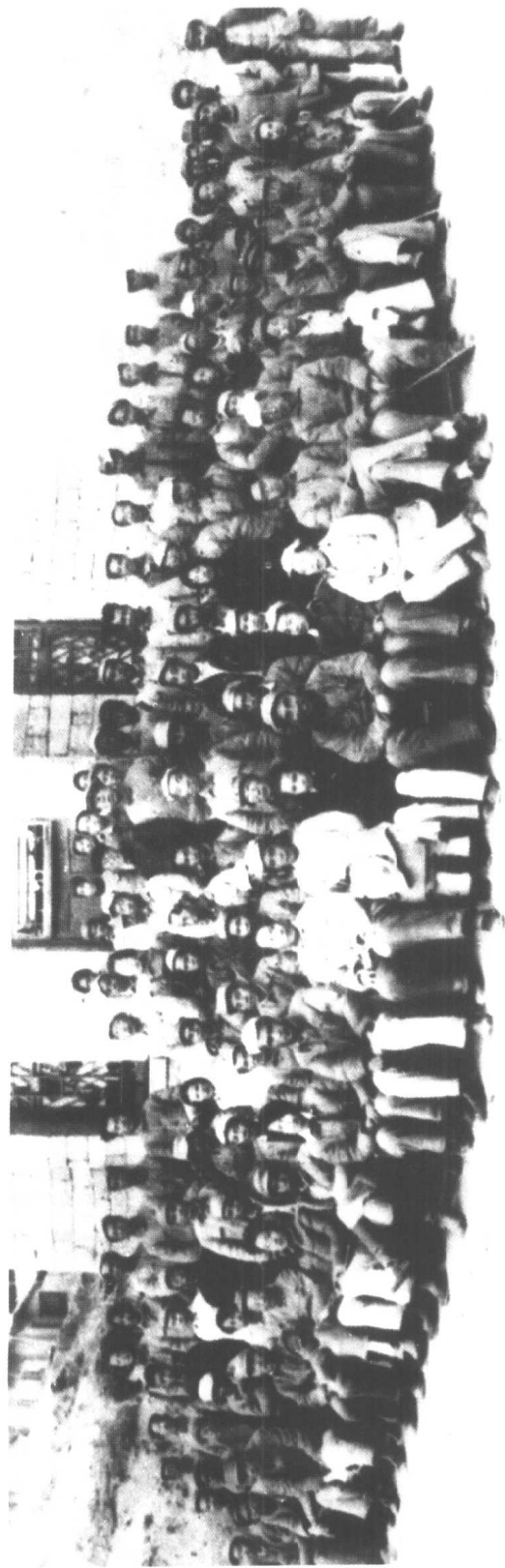
1942年5月，毛泽东与参加延安文艺座谈会的代表合影。