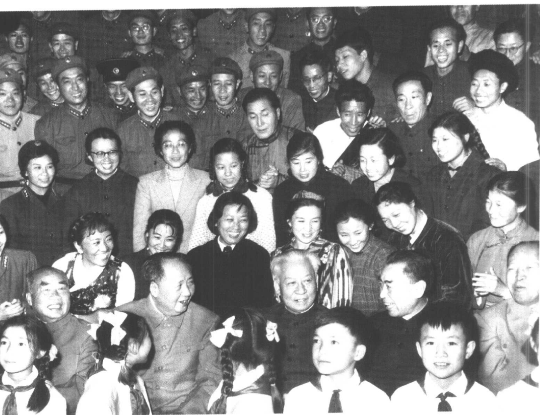
1964年10月16日,毛泽东、刘少奇、周恩来、朱德、彭真等接见参加大型音乐舞蹈史诗《东方红》演出的全体演员。