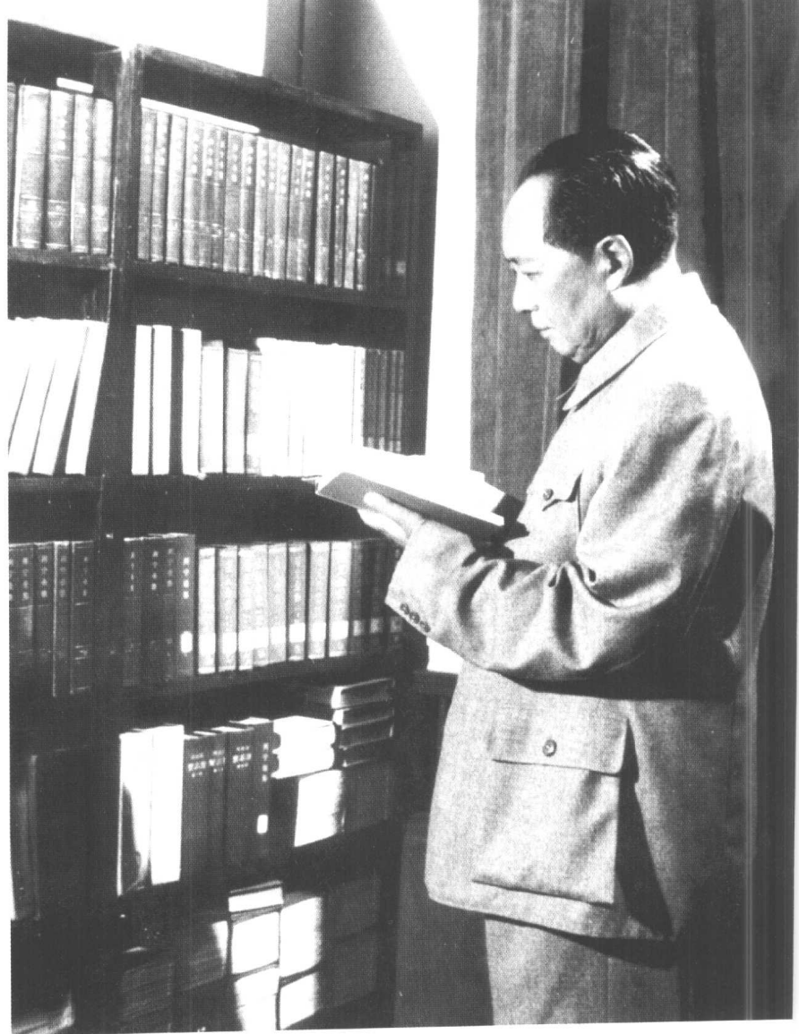
1961年,毛泽东在庐山翻阅 《鲁迅全集》。