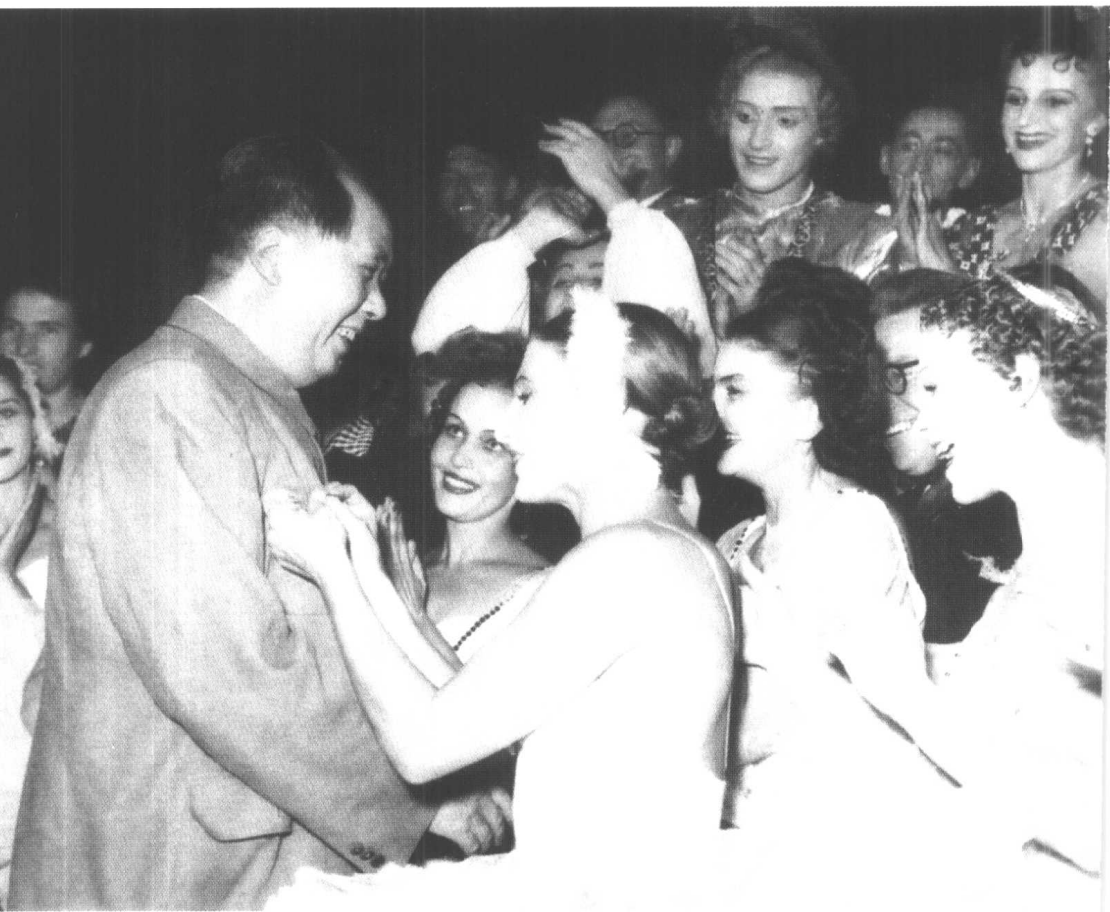
1957年10月29日，毛泽东在观看苏联新西伯利亚歌舞剧院芭蕾舞团演出的《天鹅湖》后，接受演员赠送的纪念章。