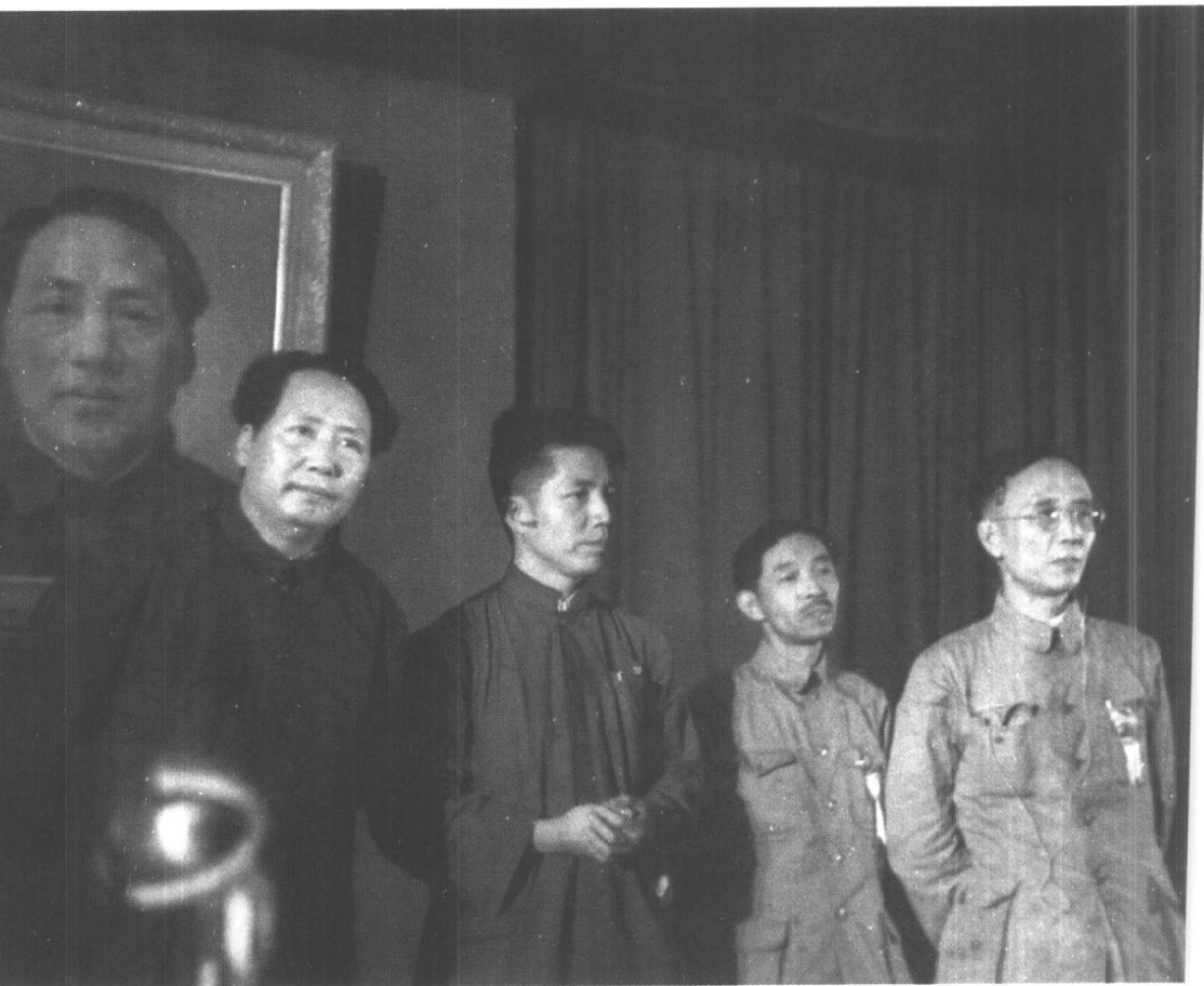
1949年7月2日，毛泽东同周扬（左二）、茅盾（左三）、郭沫若（左四）在中华全国文学艺术工作者第一次代表大会主席台上。