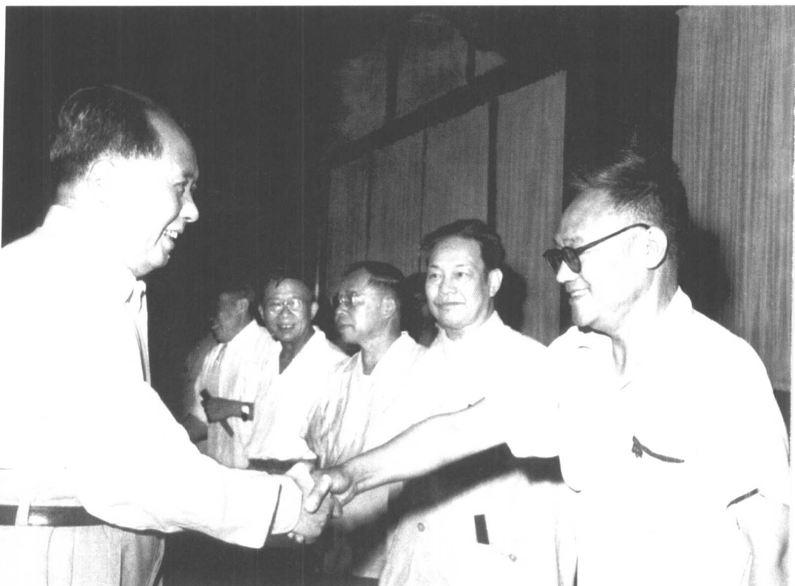
1951年10月，毛泽东接见作家巴金（右一）、京剧表演艺术家周信芳（右二）等。