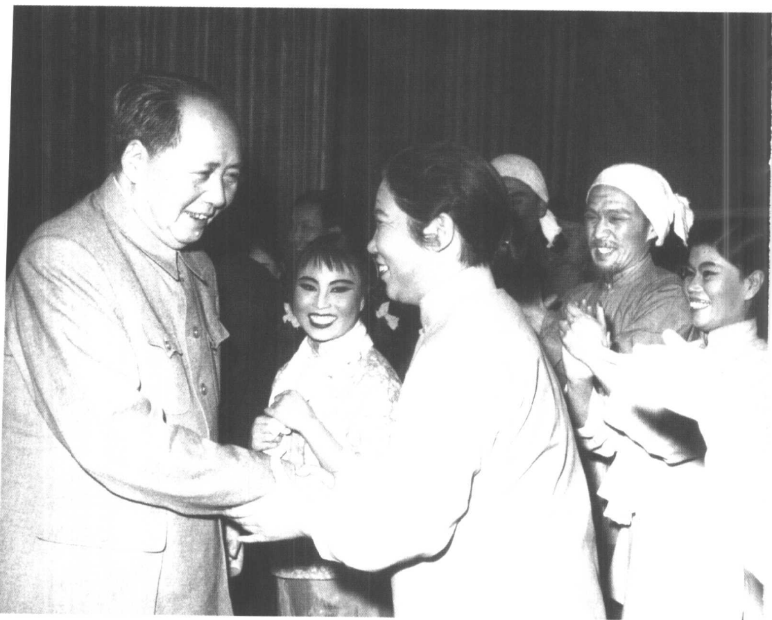
1964年元旦，毛泽东观看豫剧现代戏《朝阳沟》后，和豫剧表演艺术家常香玉握手。