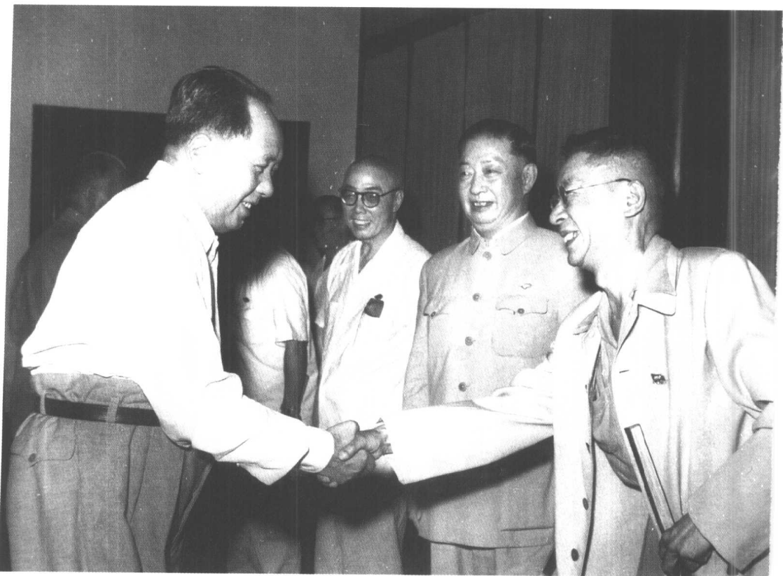
1960年7月23日，毛泽东接见戏剧家田汉（左二）、京剧表演艺术家梅兰芳（左三）、作家老舍（左四）等出席全国文学艺术工作者第三次代表大会的代表。