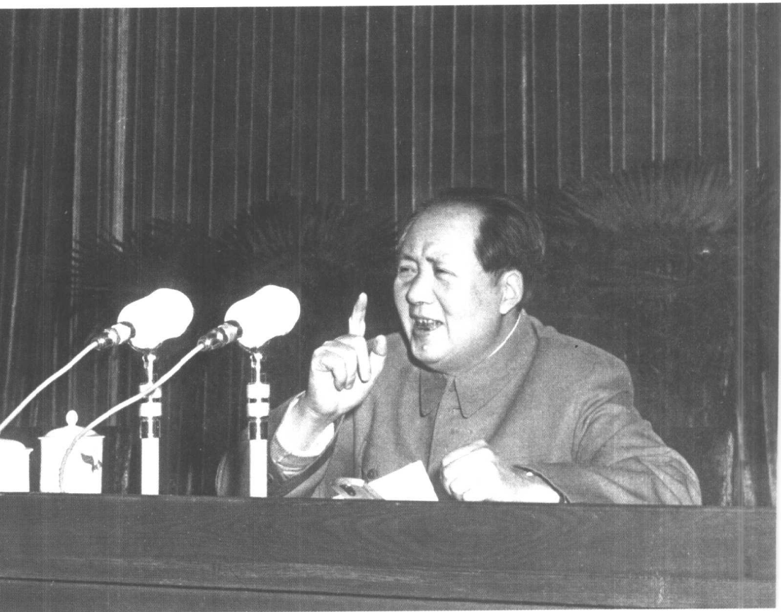
1956年1月20日，毛泽东在中共中央召开的知识分子问题会议上发表讲话。