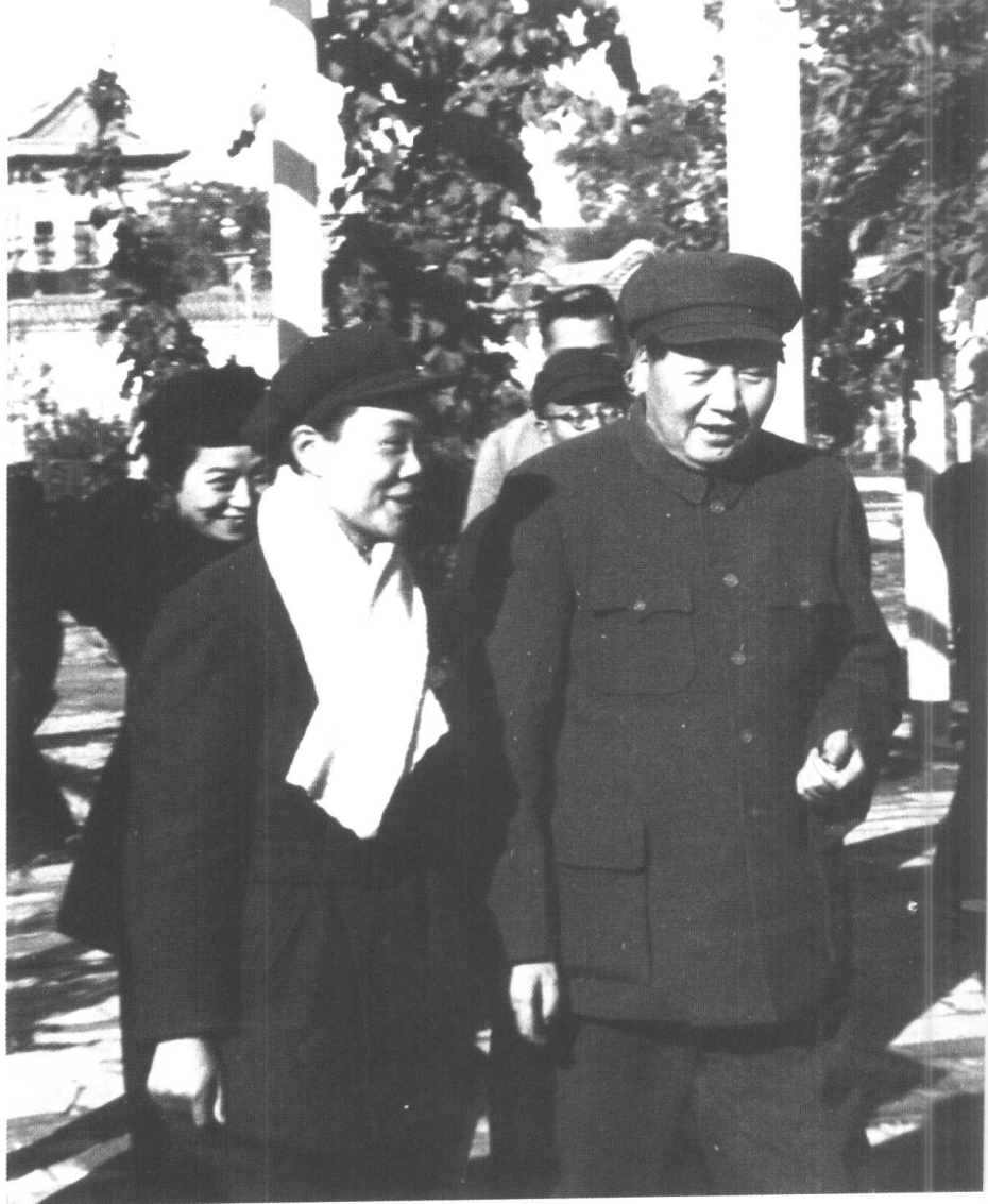
1951年10月，毛泽东和越剧 演员范瑞娟等在一起交谈。