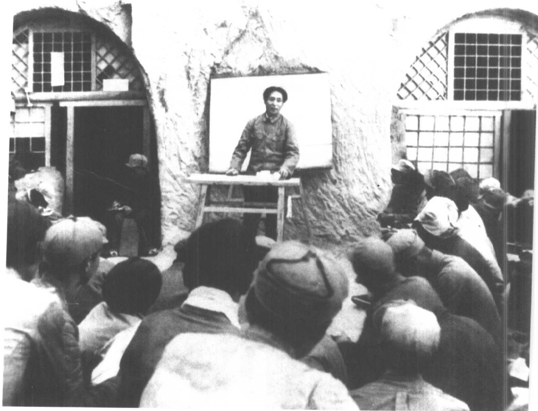
1938年4月，毛泽东在延安 鲁迅艺术学院讲演。