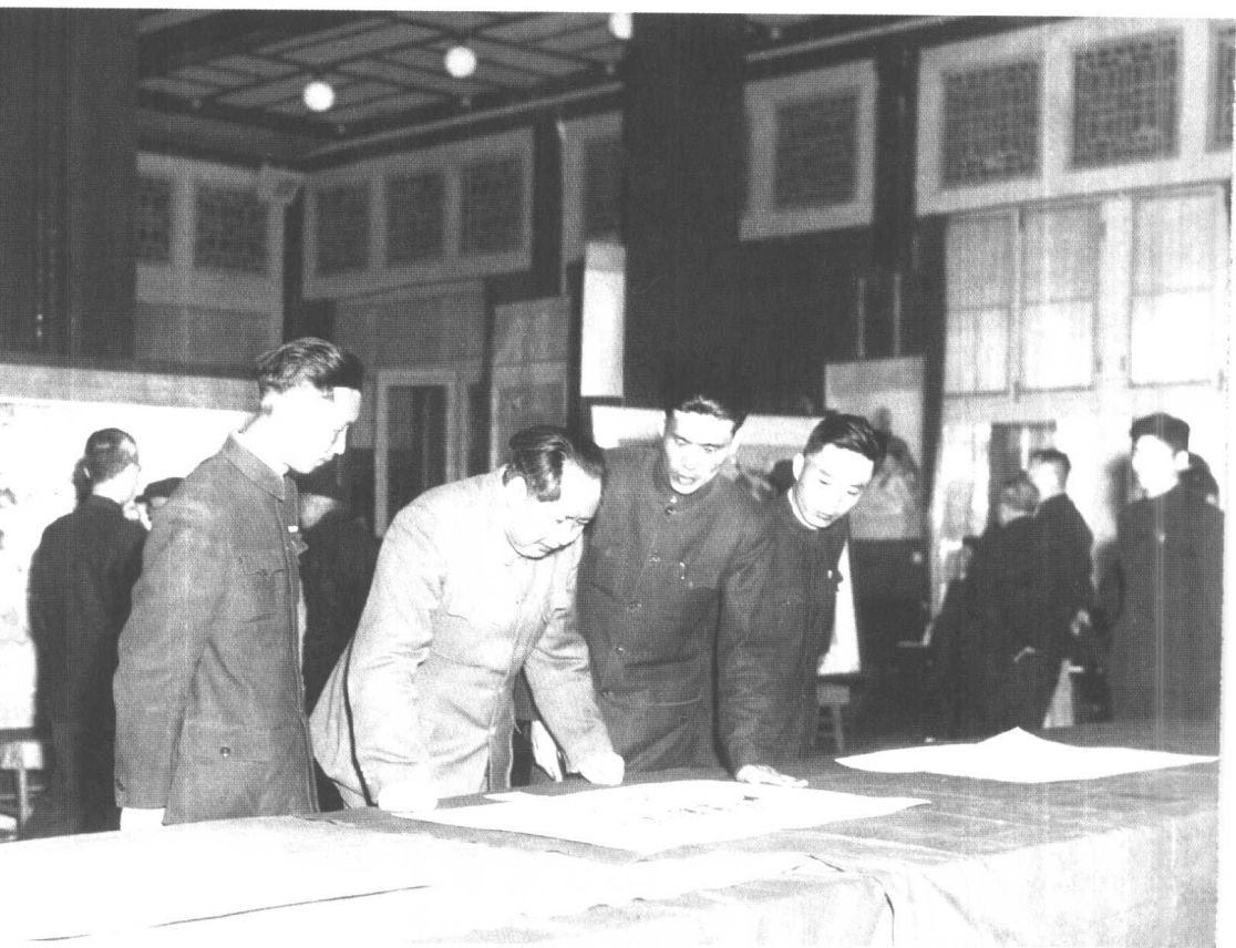
1953年4月，毛泽东 参观中央美术学院画展。