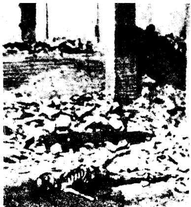
北京城内一处义和团的坛口被联军捣毁，内有四十名团员被枪杀。照片上可见团员的尸体。