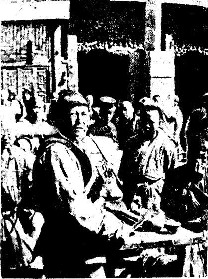
义和团在北京街头