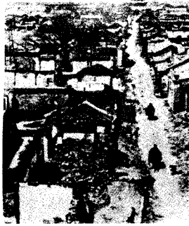
被八国联军炮毁的 天津街市