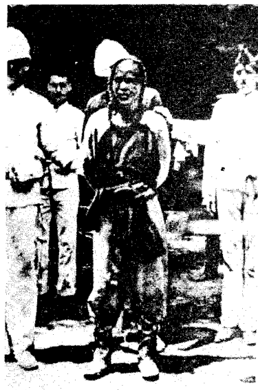
八国联军在北京搜捕义和团。