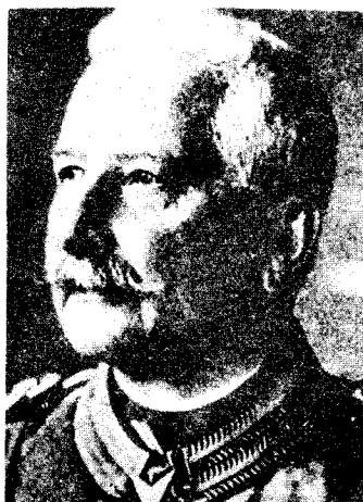
瓦德西(1832—1904)， 八国联军统帅，是侵 华联军的主要头目。