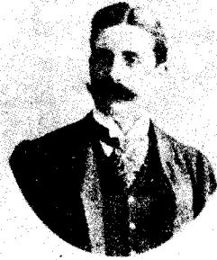
克林德(1853—1900)， 德国外交官。他随意 枪杀义和团，被虎神 营士兵打死。