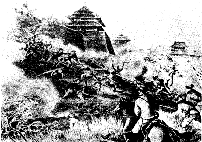
八国联军侵入北京。图为义和团在东直门抗击日本侵略军。