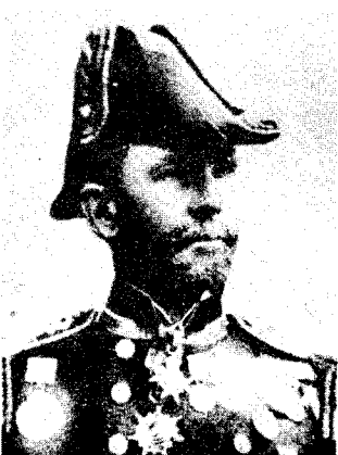
西摩尔（1840—1929），英国海军中将。1900年6月，他率领八国联军从北京进犯天津。