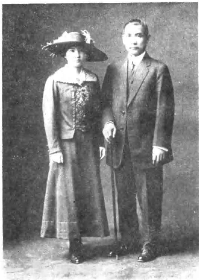
1915年10月宋庆龄与孙中山在东京合影。