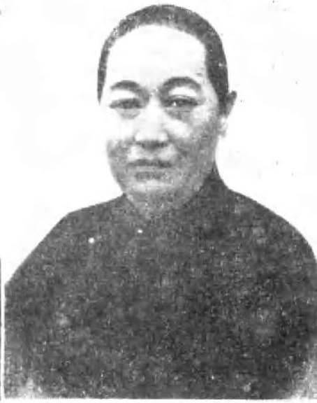
宋庆龄的母亲倪桂珍。