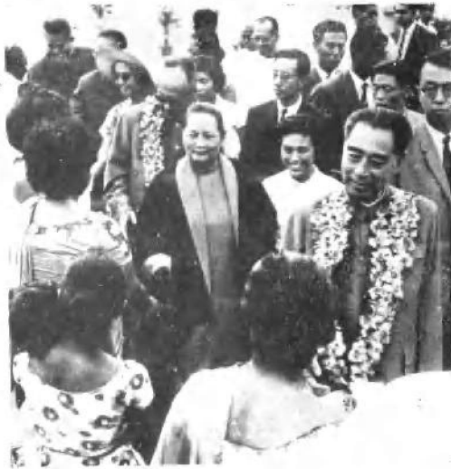
一九六四年二月和周恩来、陈毅 对锡兰进行国事访问