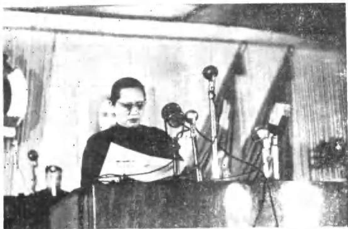
1949年9月在中国人民政治协商会议第一届全体会议上讲话。