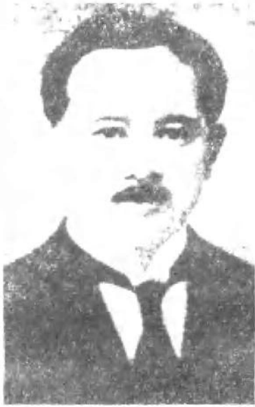
宋庆龄的父亲宋耀如。