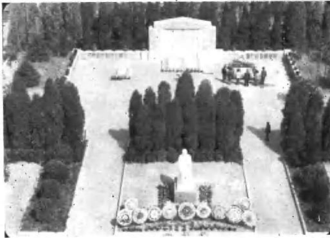
上海张虹路宋庆龄陵园