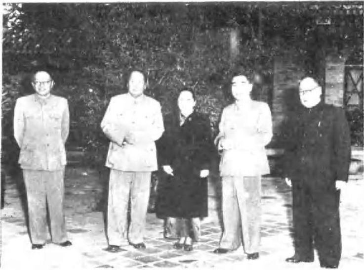
1956年和毛泽东、周恩来、陈毅、张闻天 在北京中南海合影。