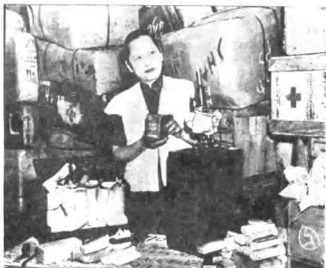
1948年亲自检查运往解放区的医药器材等物资。