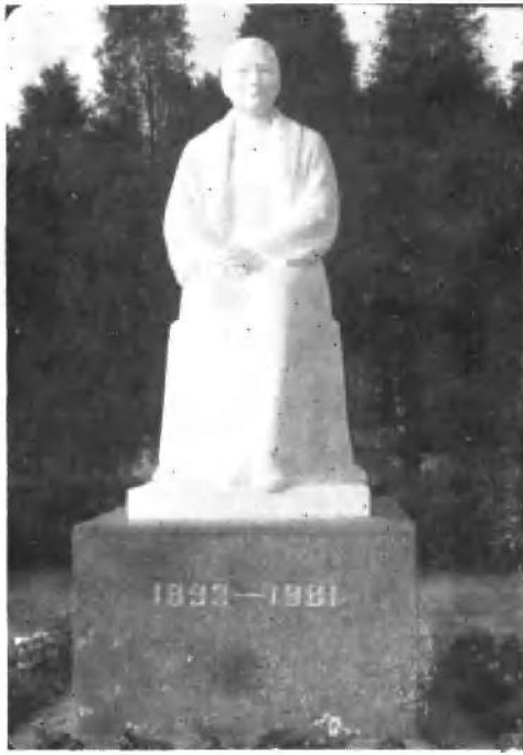
上海宋庆龄陵园中的大理石塑象