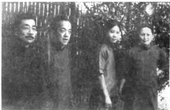
1933年与民权保障同盟执行委员鲁迅 (左一)胡愈之(左二)合影。