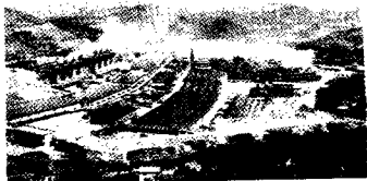
庐江铁矿生产 区鸟瞰。