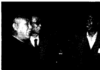
1988年10月，庐 江矾矿“三废”综合 治理项目参加全国化 工环境技术展览被评 为优秀项目，化工部 部长秦仲达(左一)、 国家环保局局长曲格 平(左二)前往参观 指导