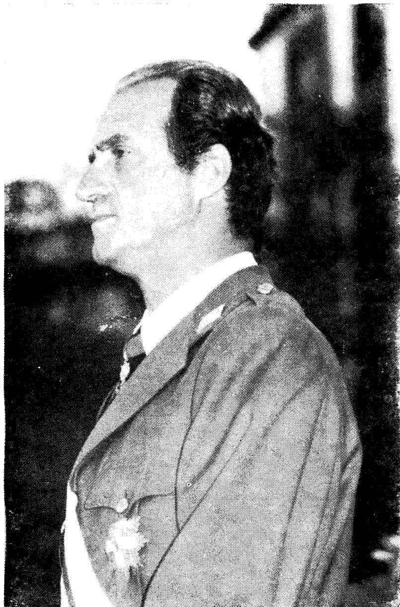
西班牙国王胡安·卡洛斯一世