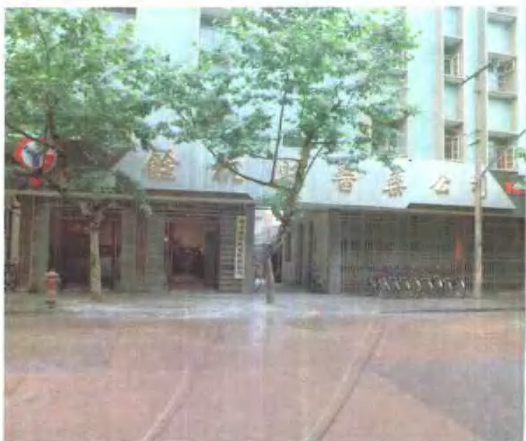
左 淳安县医药公司 上右 建德县医药公司 中 萧山市医药公司 下 余杭县医药公司