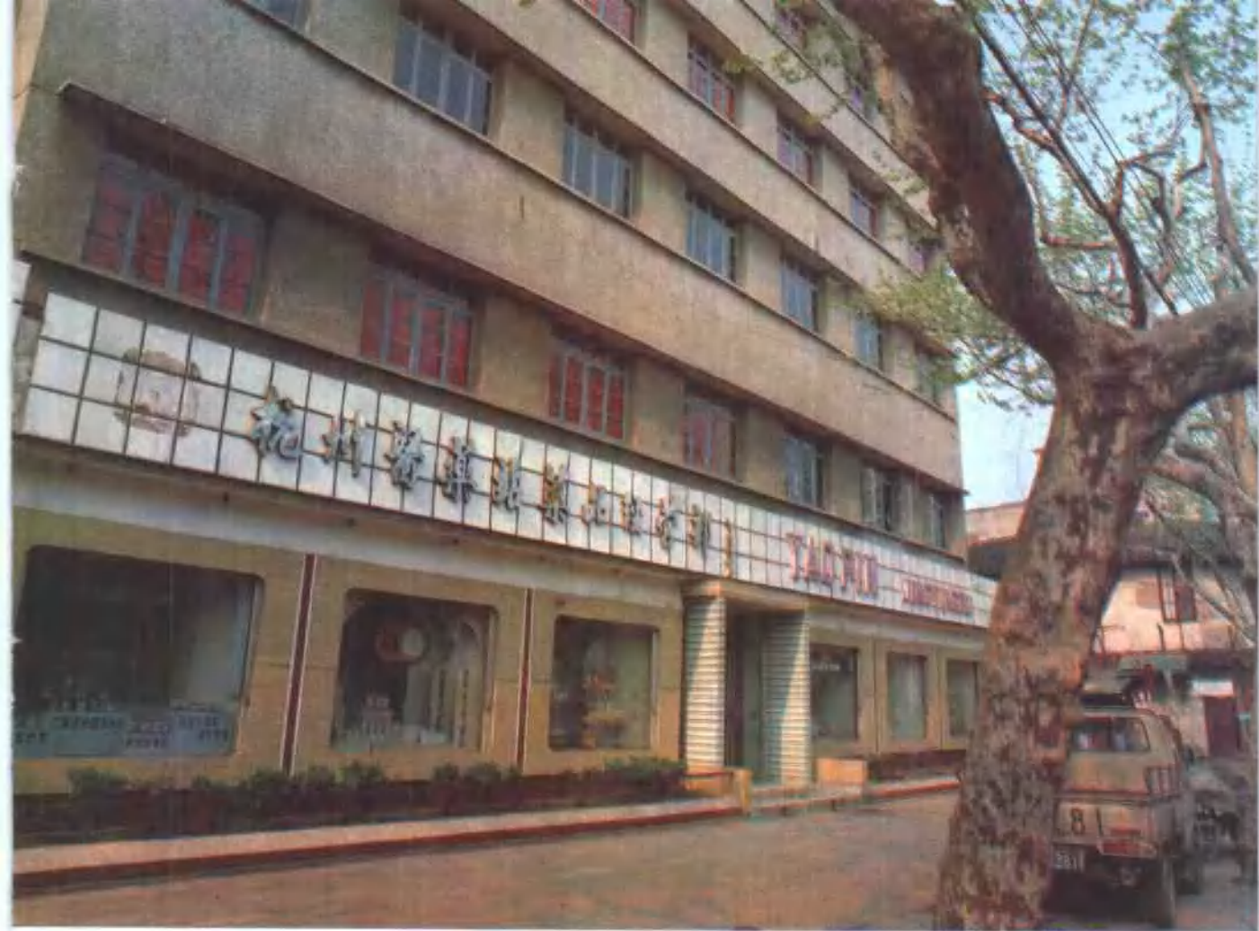
上 杭州医药站药品经营部 下左 西药批发开票 下右 中药经营部业务洽谈处