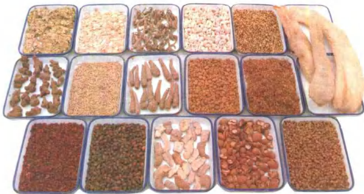
杭州部分地产药材