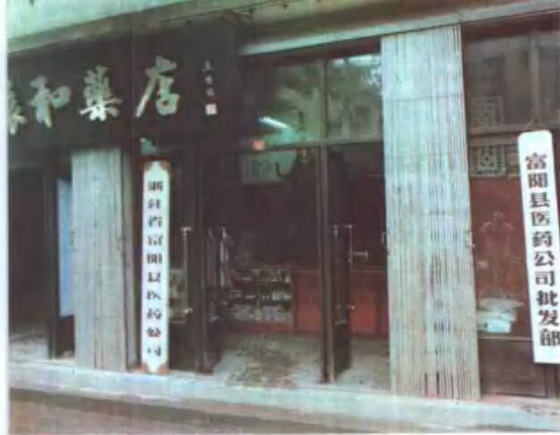
上左 富阳县医药公司 中左 杭州医药站汽车队 下左 杭州中药饮片厂、朱 养心药厂新厂房 右 朱养心药厂摊膏车间