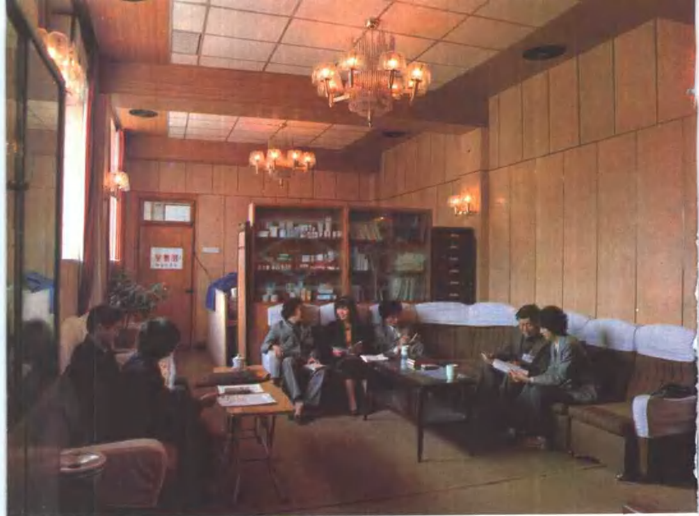
上 新药特药经营部在洽谈业务 下左 急救药品值班室 下右 器化玻经营部业务接待处