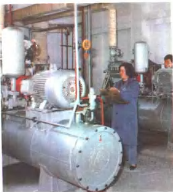
上左 施家桥冷藏仓库机房 上右 三多村中药仓库 下 施家桥西药仓库