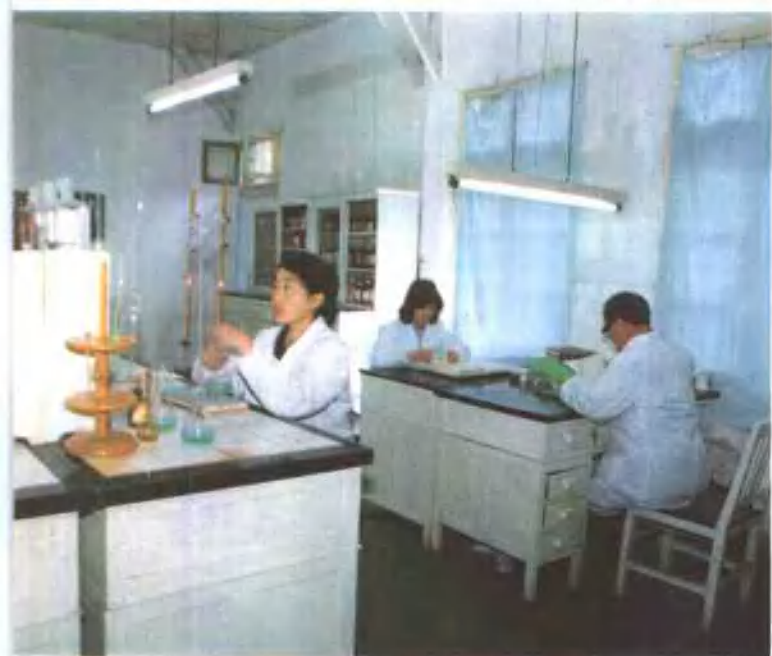
上左 杭州医药站电脑管理系统 上右 医药商品质量中心测试室 中 药品理化分析 下左 杭州医药商业衡器检定站 下右 中药师指导青年职工验收中药