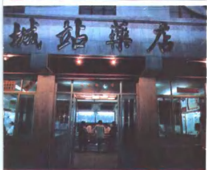
上左 长春药店 中左 城站药店夜市 下左 杭豫泰器化玻商店 上右 延庆堂药店 下右 老年保健滋补品商店