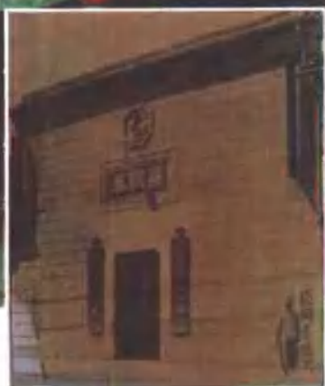
上 百年老店——张同泰药店 右小图张同泰药店老门面