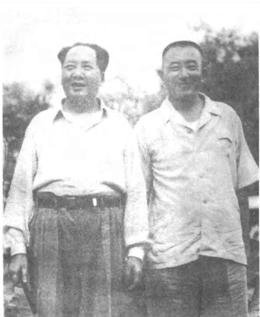
罗瑞卿同志和毛主席在颐和园。（一九五一年）