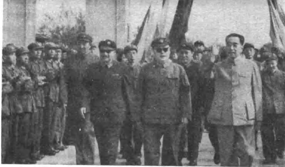
罗瑞卿同志陪同周总理和贺龙、陈毅同志视察部队。（一九六四年）