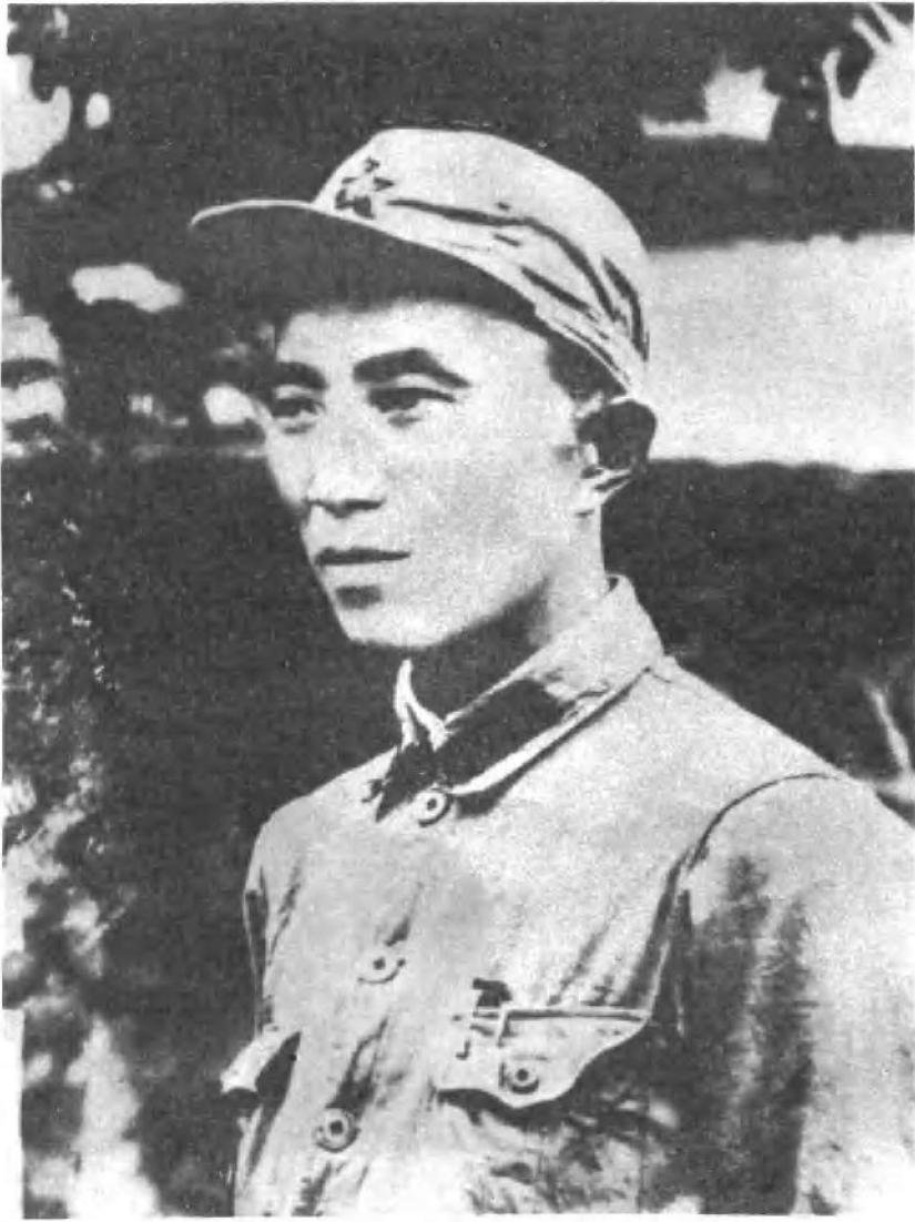
罗瑞卿同志在延安抗大。（一九三七年）