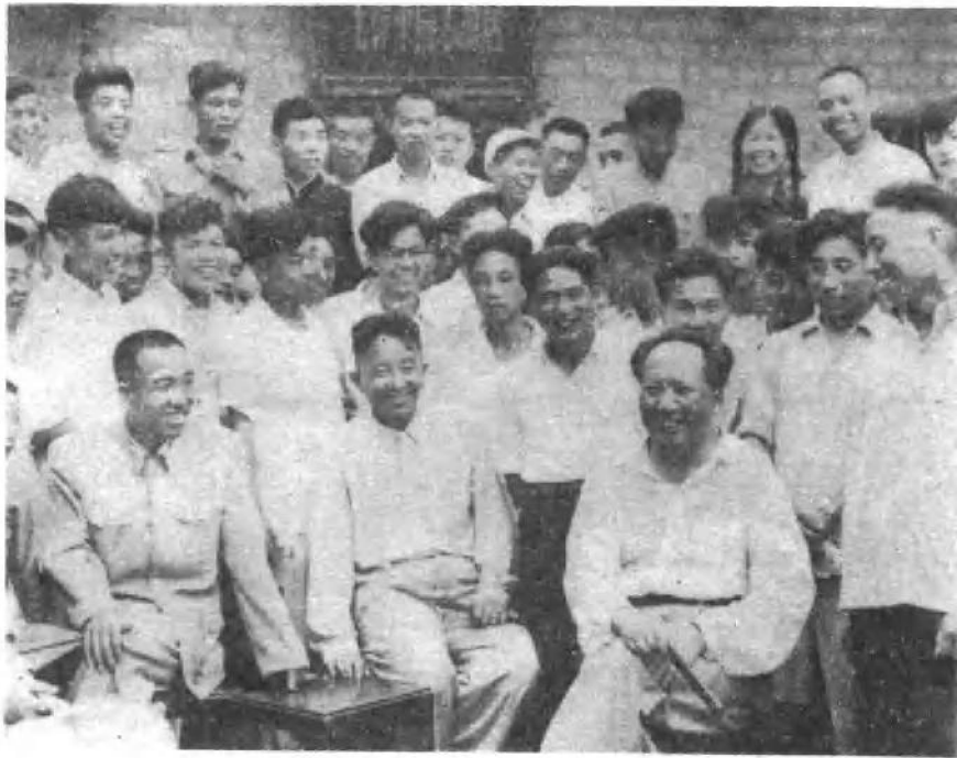
罗瑞卿同志和毛主席在韶山。(一九五九年)