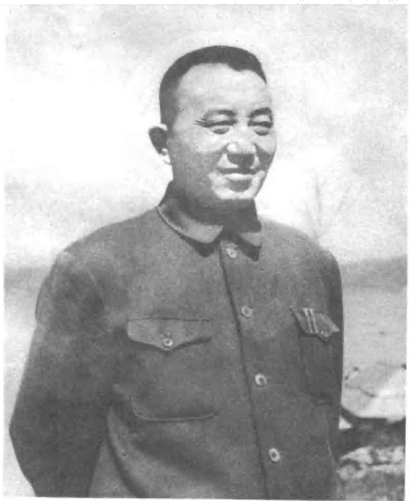
无产阶级久经考验的忠诚的革命战士罗瑞卿同志。（一九五四年）