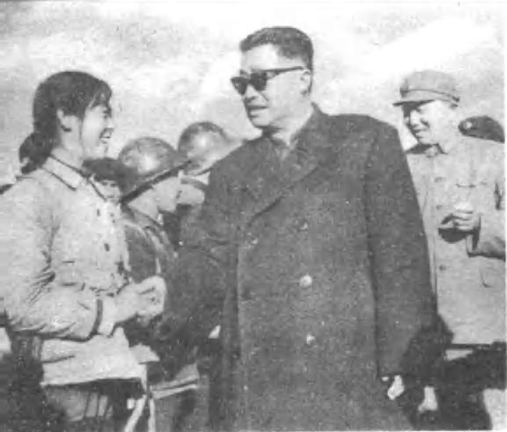
罗瑞卿同志与贺龙同志 接见民兵。 (一九六四年)