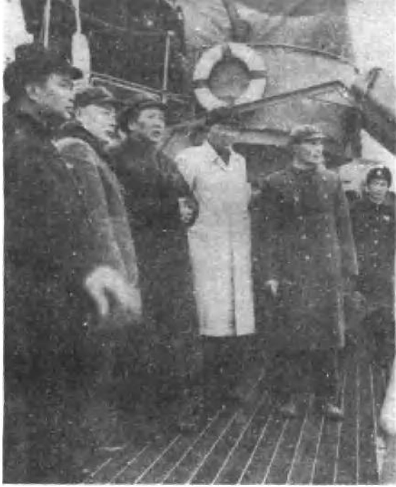
罗瑞卿同志陪同毛主席在“南昌”舰上。 (一九五三年)