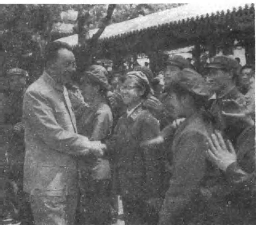
罗瑞卿同志在游园时会见部队文艺工作者。