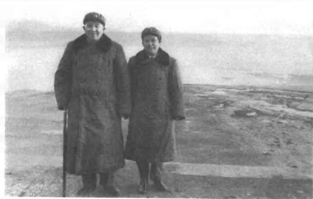
罗瑞卿同志和郝治平同志在湘江桔子洲头。（一九七七年）