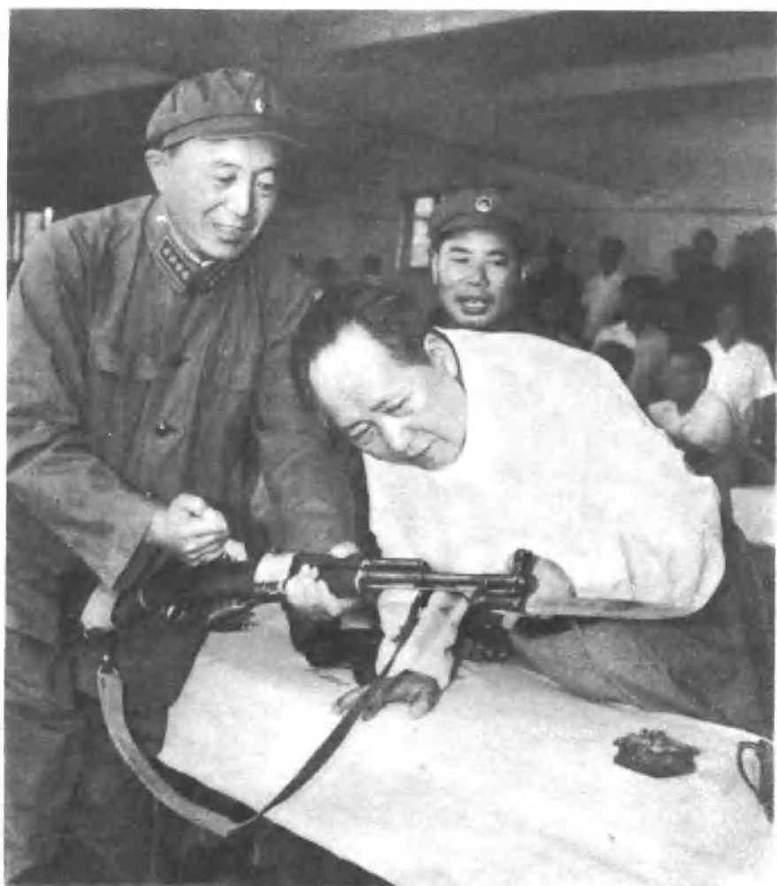
罗瑞卿同志陪同毛主席在北京观看军事表演。（一九六四年）