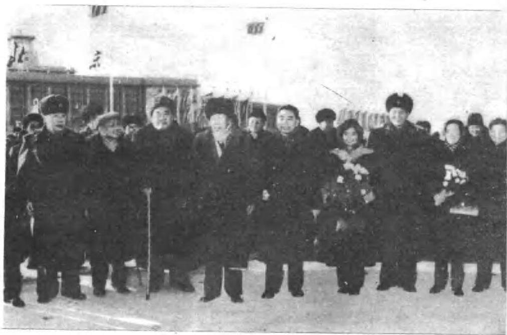
罗瑞卿同志陪同周总理、陈毅同志访问缅甸。朱德、董必武、邓小平、陈云同志等到机场送行。（一九六一年）