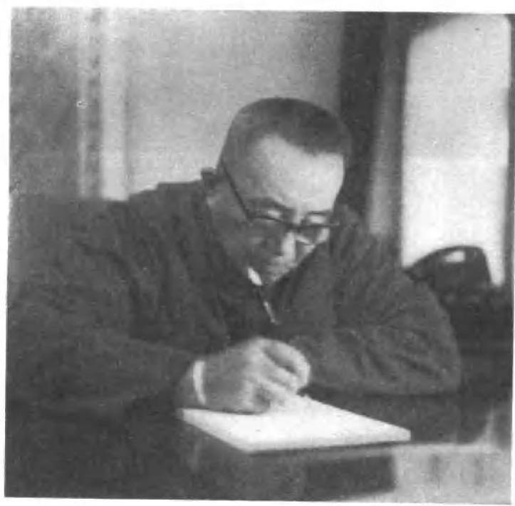
罗瑞卿同志在办公室。（一九七八年一月二日。）