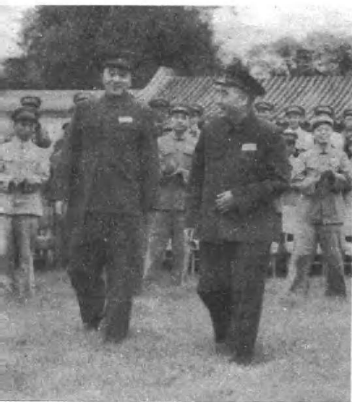
罗瑞卿同志陪同 朱德总司令接见公安 部队第一届功臣模范 代表大会代表。（一 九五三年）