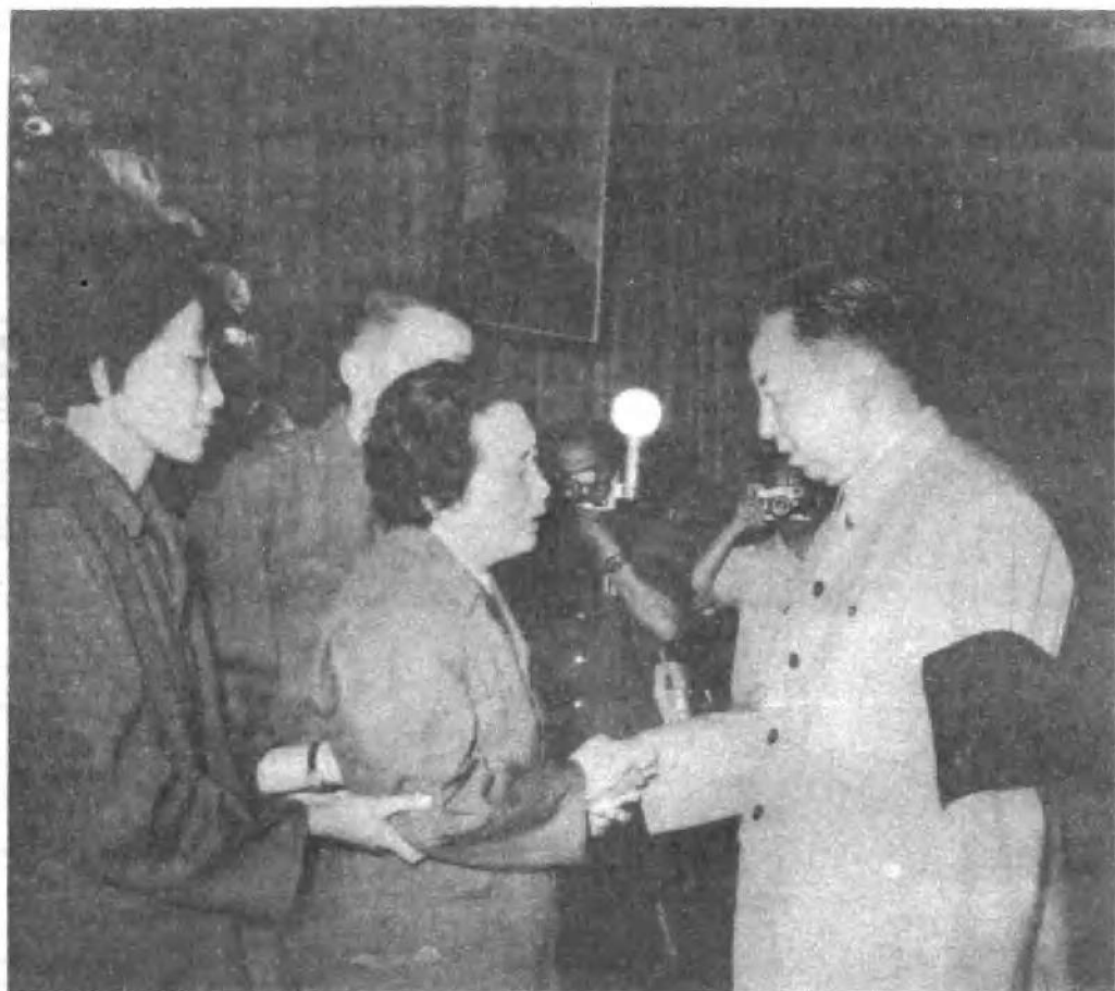
华主席向罗瑞卿同志的夫人郝治平同志表示亲切的慰问。 (一九七八年)