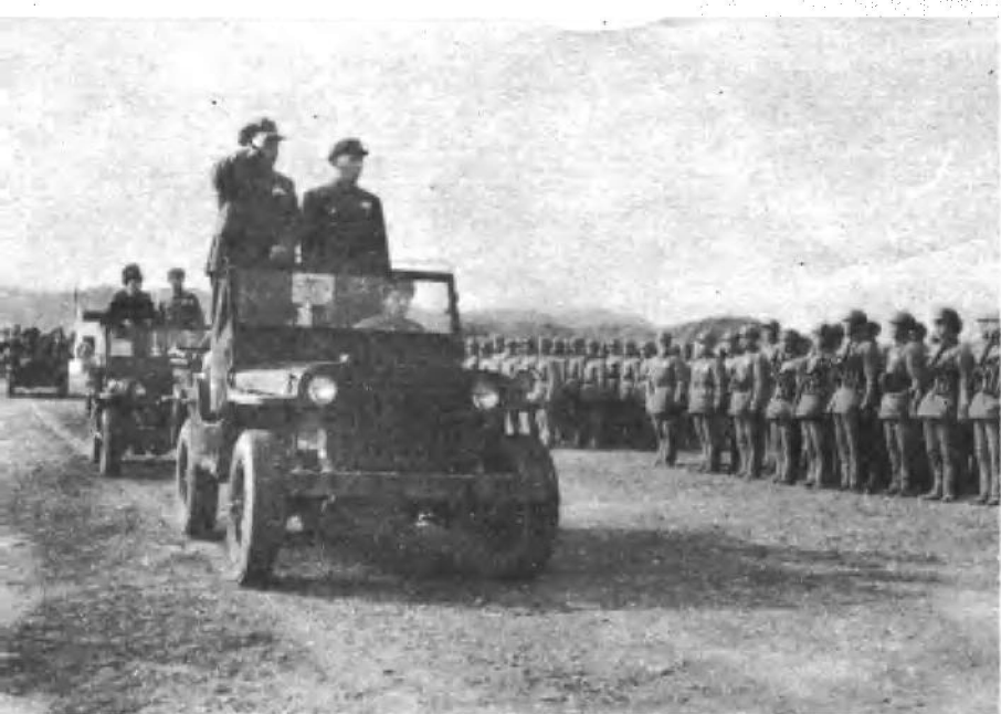
罗瑞卿同志陪同 朱德总司令检阅中央 公安纵队。（一九四 九年）