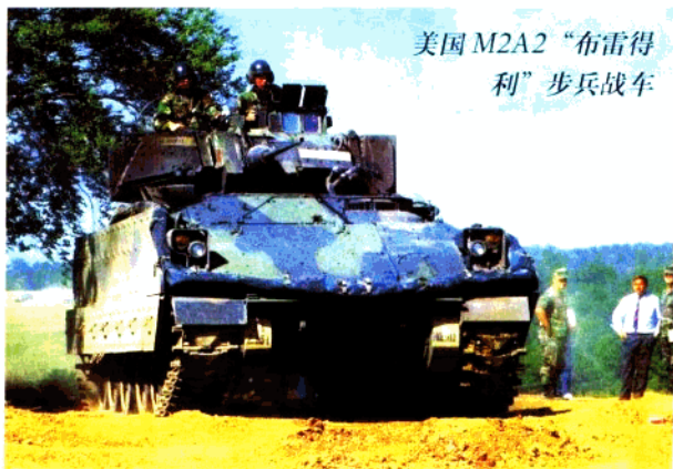
美国 M2A2 “布雷德利”步兵战车