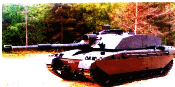
英国“挑战者”2主战坦克