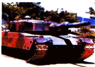
◁ 日本 90 式主战坦克