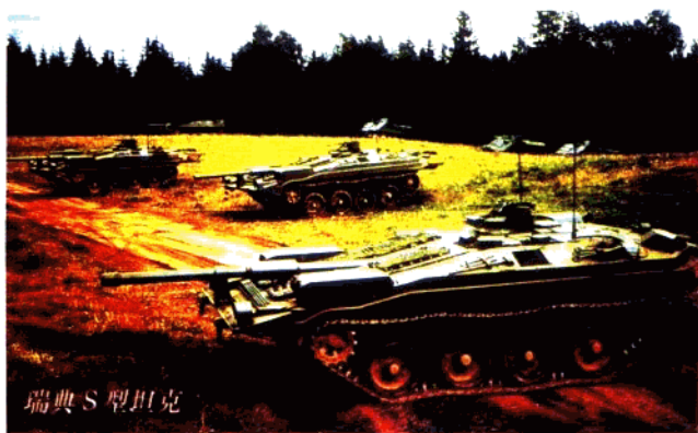
瑞典 S 型坦克