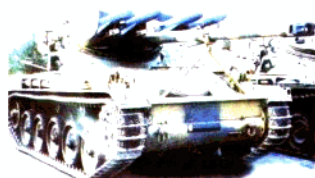
法国 AMX-13 轻型坦克