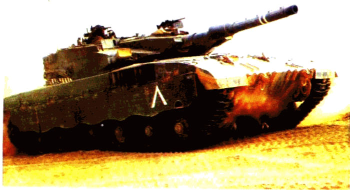
▽ 以色列“梅卡瓦”MK3 型坦克