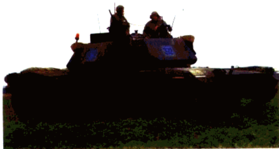
◁ 美国 M1A1 主战坦克