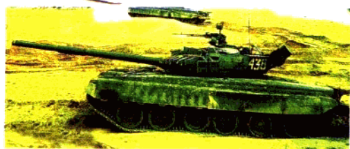
△ 苏联 T-80 主战坦克