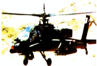
美国“阿帕奇”AH-64武装直升机