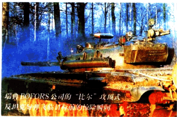
瑞典 BOFORS 公司的“比尔”攻顶式反坦克导弹飞临目标前的惊险瞬间