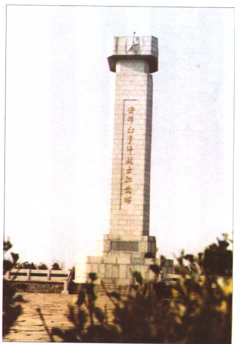
安峰山事件烈士纪念馆