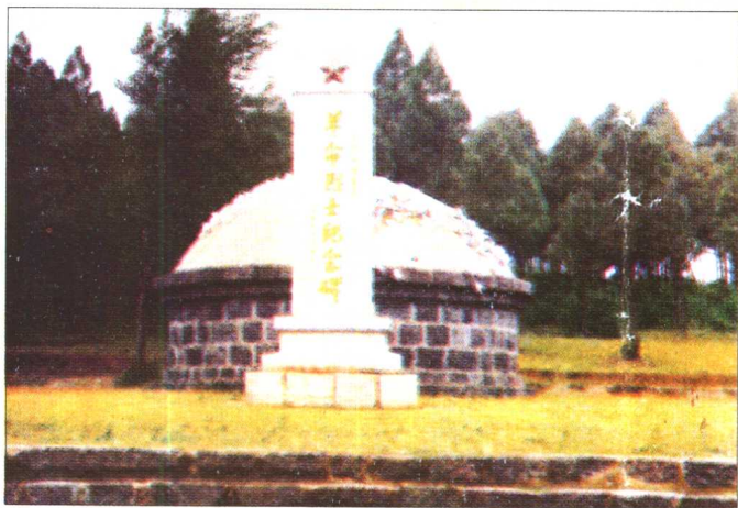
安峰山阻击战烈士纪念碑