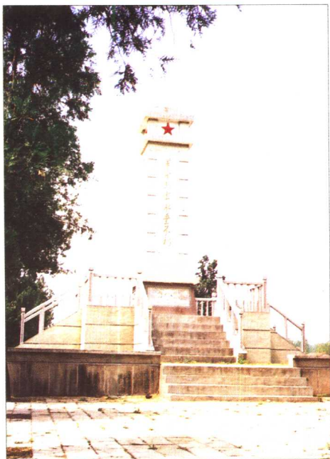
房山烈士陵园烈士纪念碑