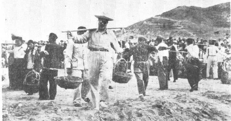
一九五八年五月二十五日，贺龙同志在十三陵水库参加劳动。