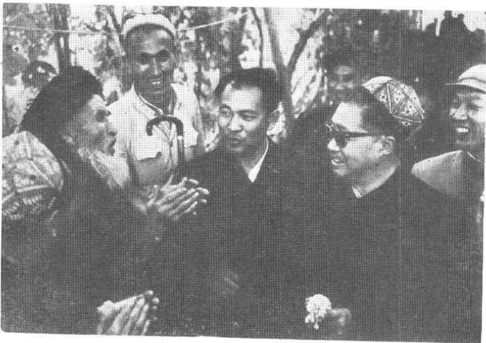
贺龙同志给百岁老人买买提木沙赠送拐杖