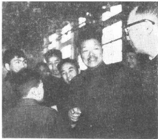
一九六五年四月十三日， 贺龙、聂荣臻同志视察成都峨 眉机械厂时，与新工人谈话。