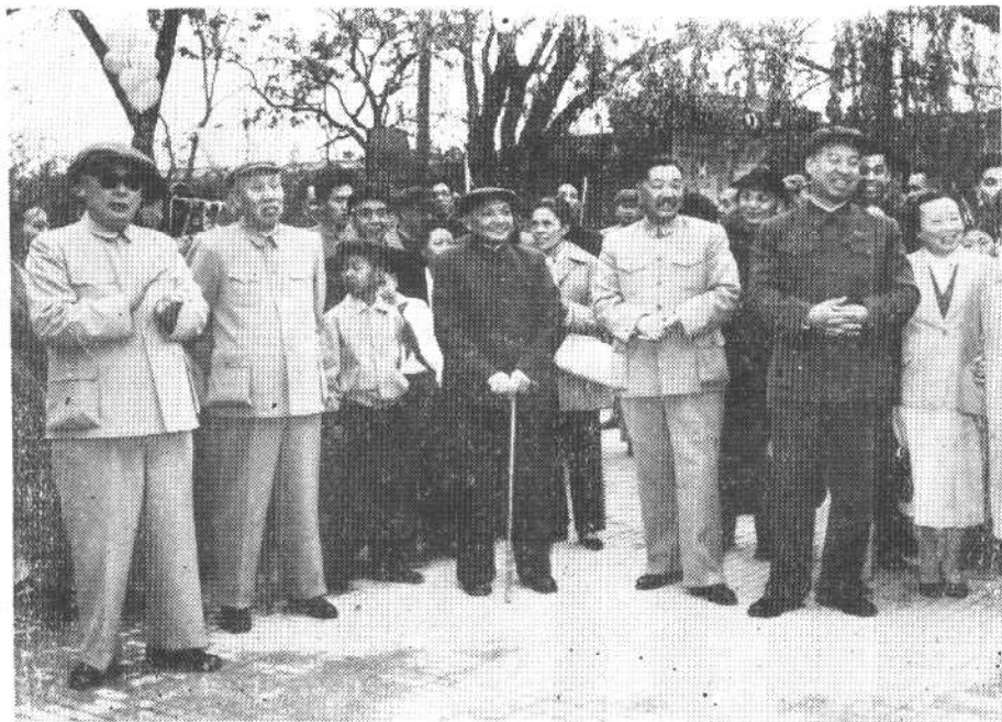
一九六一年五月九日，贺龙同志与董必武、邓小平、彭真、陈毅同志在景山公园。