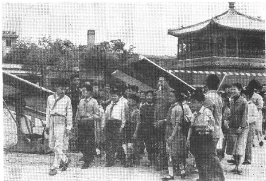
一九六一年五月十四日，贺龙同志观看国防体育表演。